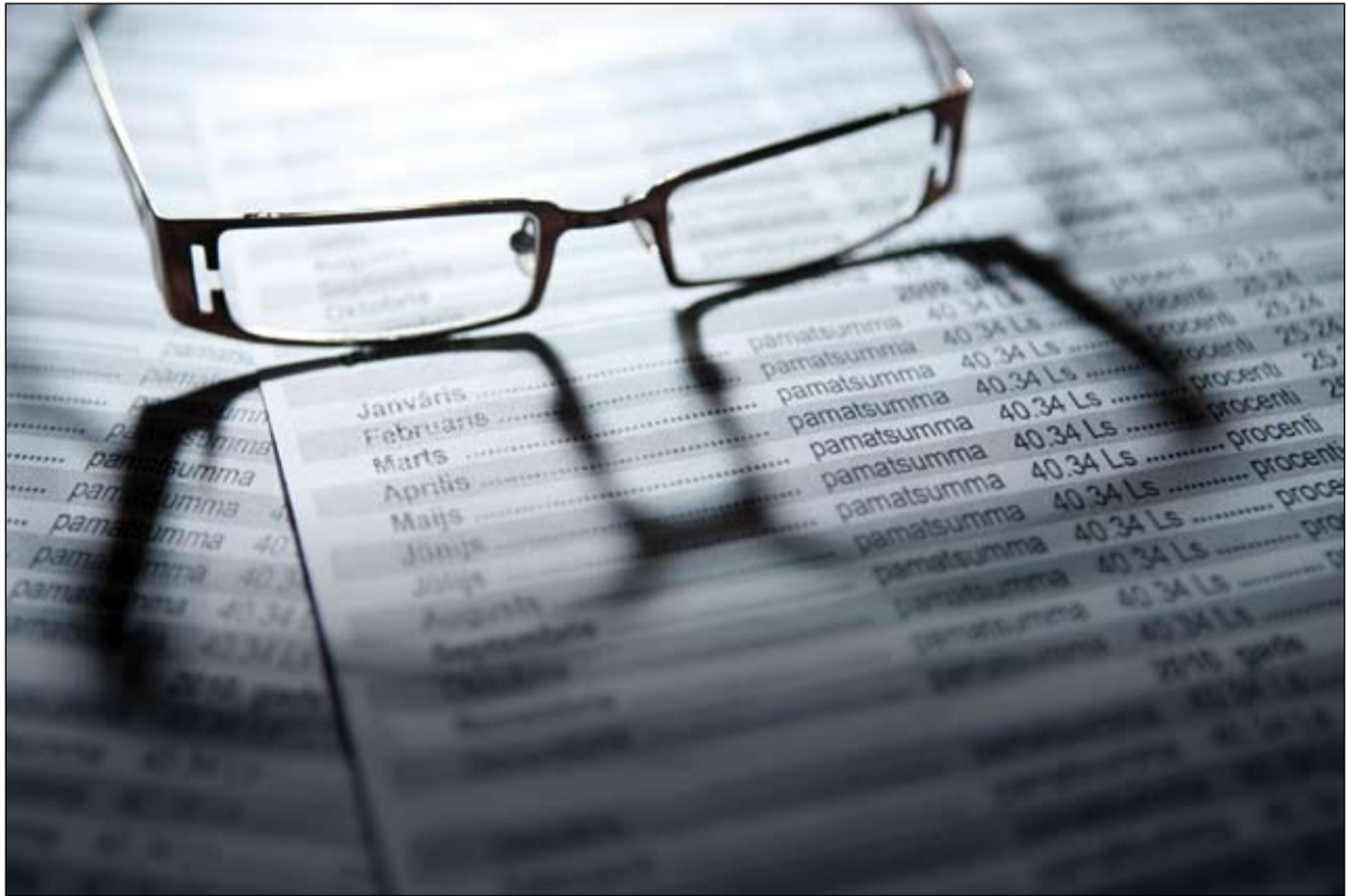
Pirms naudas aizņemšanās padziļināti izvērtējami dažādu finanšu iestāžu piedāvājumi. No interneta mājas lapām konkrētu skaidrību iegūt nav iespējams.

Patērētāju tiesību aizsardzības centrs (PTAC) norāda, ka šajā gadījumā līgumsods ir neproporcionāli augsts. PTAC, izvērtējot līgumu, atzītu, ka līguma noteikumi ir netaisnīgi un tie automātiski nebūtu spēkā. «Arī tad, ja lieta nonāk tiesā, tā parasti ņem vērā mūsu atzinumus,» klāsta PTAC Sabiedrisko attiecību un patērētāju infor-