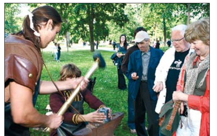
Pils parkā bija vairākas radošas darbnīcas, kurās varēja kalt monētas, gatavot stabulītes vai vērt pārļu rotas.