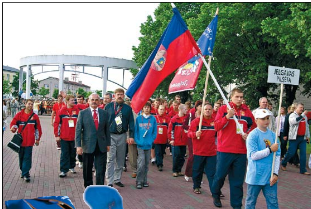
Jelgavu olimpiādē pārstāvēja 119 sportisti, to skaitā arī trīs sporta spēļu komandas basketbolā, futbolā un sieviešu volejbolā.