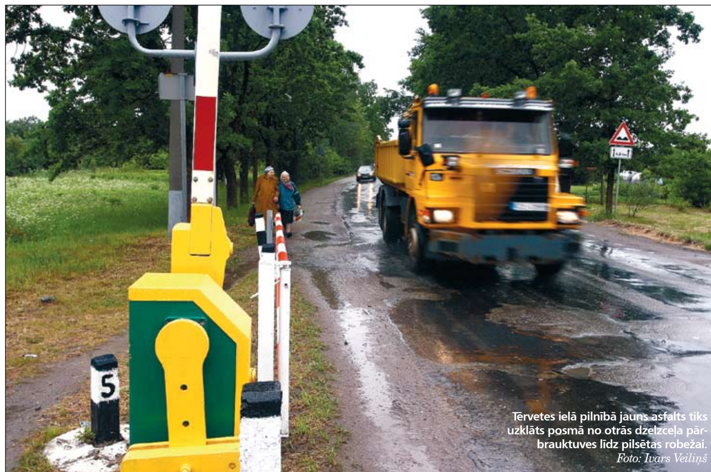
Tērvetes ielā pilnībā jauns asfalts tiks uzklāts posmā no otrās dzelzceļa pārbrauktuves līdz pilsētas robežai.