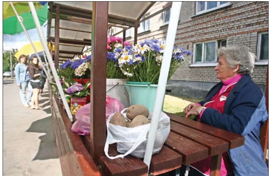
Pašmāju zemnieku audzētos dārzeņus, ogas un augļus jelgavnieki var iegādāties ne tikai tirgū, bet arī vairākās tirdzniecības vietās pilsētā.

Pensionāres vēstuli komentē Jelgavas pašvaldības izpilddi-