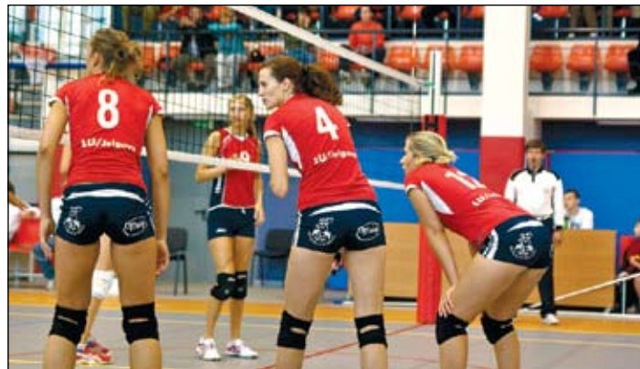
Volejbola finālsacensībās pievīla psiholoģiskā noturība, jo pat spēlēs, kuru gaitu kontrolēja jelgavnieces, uzvaras izcīnīt neizdevās.

gaitu, uzvarot ne tikai trešo setu, bet arī spēli (2:3). Grūti priest, kāpēc jau gandrīz pie izcīnītām medaļām trešajā setā meitenes pazaudēja koncentrēšanos, bet ir skaidrs, ka zaudējuma iemesls noteikti nav meistarības trūkums. Drīzāk tā ir psiholoģiskā nenoturība vai trenera nespēja motivēt cīnīties par katru bumbu no spēles pirmā seta līdz finālsvipei. Kopumā turnīru varētu uzskatīt par neveiksmīgu, jo bija reāla iespēja uzvarēt pat divās no trim spēlēm.