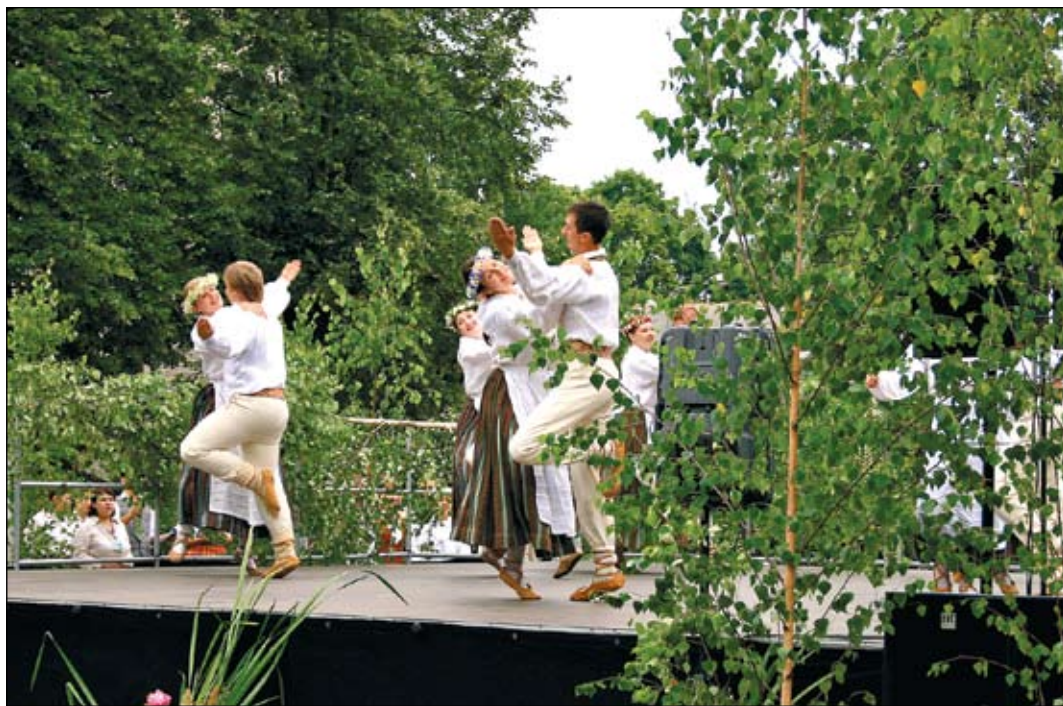
Arī šajā Zāļu tirgū jau no pulksten 10 ikviens līdztekus anđelei varēs baudīt pašdarbnieku kolektīvu priekšnesumus.

Jaundzimušo jelgavnieku sveikšana, konkursa «Sakoptākais pilsētvides objekts» laureātu apbalvošana, Līgo un Jāņu sumināšana – tās ir tradīcijas, bez kurām Zāļu tirgus mūsu pilsētā vairs nav iedomājams, tieši tādēļ jelgavnieki arī šogad aicināti tikties skvērā aiz kultūras nama, lai