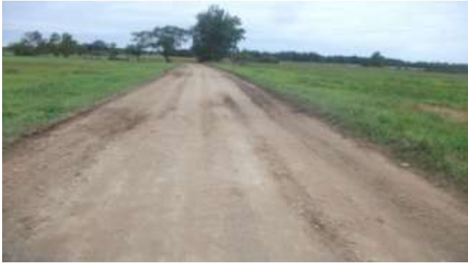
Čudarīnes-Obeļovas ceļš

Notika Baltinavas novada uzņēmēju sanāksme, lai izvērtētu iespējamo finansējuma piesaistes iespēju SAM 5.6..2. „Teritoriju revitalizācija, reģenerējot degradētās teritorijas atbilstoši pašvaldību integrētajām attīstības programmām”. Tika izvirzītas divas projektu aktivitātes: “Uzņēmējdarbības dažādošanas iespējas un ceļu kvalitātes uzlabošana Baltinavas novadā” (asfaltseguma izveide funkcionālajam savienojumam ceļš Čudarīne – Tutinava un “Uzņēmējdarbības attīstība Baltinavā” (ēkas pārbūve Tilžas ielā 17).