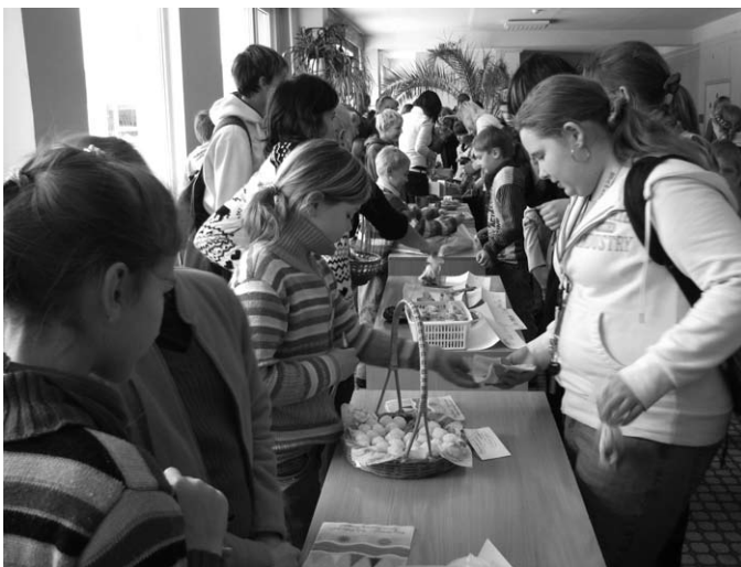
Ziemassvētku tirdziņā nopērkamās lietas bija gan garšīgas, gan acij tīkamas.