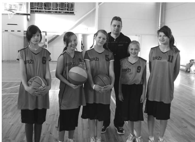
Biržu pamatskolas meiteņu komanda (2. vieta).