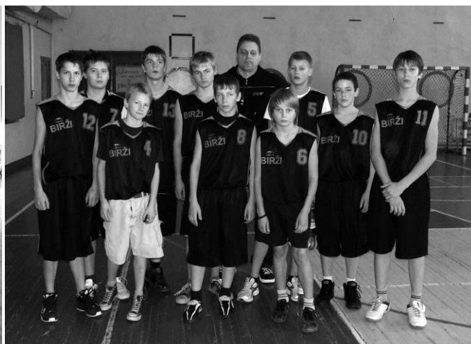
Biržu pamatskolas puīšu komanda (2. vieta).