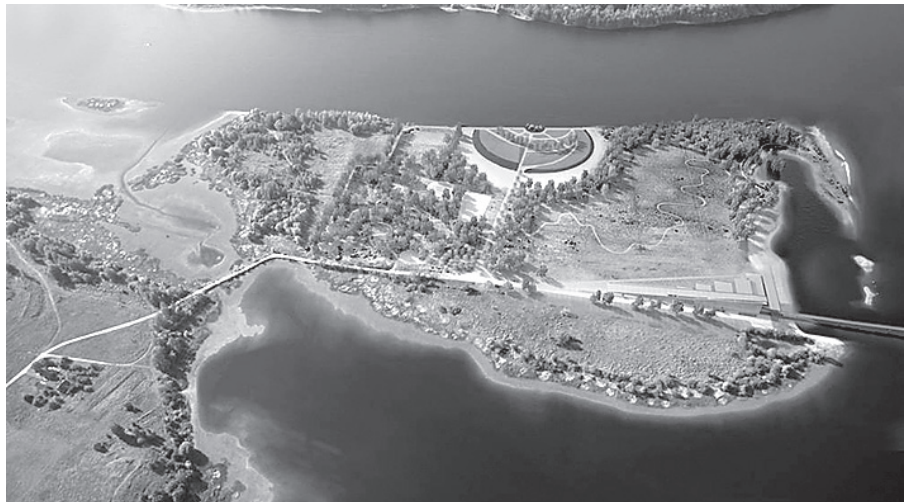
Skats uz „Likteņdārzu” no helikoptera 2010. gada rudenī.

Pirmie darbi tā īstenošanā iesākti 2008. gadā, un pēc pabeigšanas dārzs nonāks Kokneses pašvaldības īpašumā. 2008. gadā par dibinātāju ieguldītajiem līdzekļiem tika izbūvēts centrālais ceļš uz dārza amfiteātri un iestādīta ābeļu aleja, 2009. gadā par saziemotajiem līdzekļiem izbūvēts perimetrālais ceļš, un 2010. gadā iesākta dārza centrālās daļas – amfiteātra – būvniecība. Kopš tā īstenošanas sākuma tā tapšanā iesaistījušies vairāk nekā 12 000 cilvēku no Latvijas un citām valstīm – ASV, Austrālijas, Brazīlijas, Japānas, Kanādas, Nor-