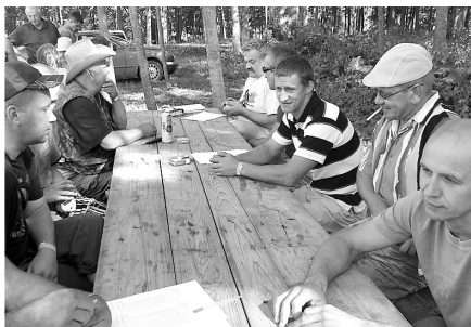
Vīri savas spējas parādīja, spēlējot zoli.