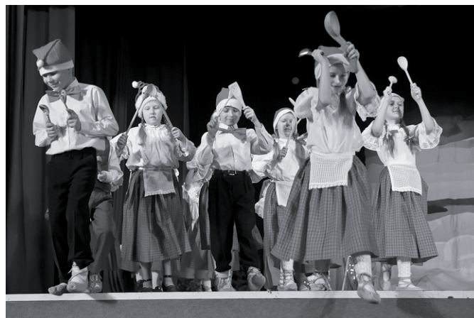
Dziesmas tika papildinātas arī ar tikai rūķiem zināmiem līdzekļiem.