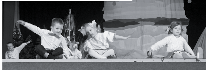
Ar rotaļīgām dejām priecēja mazākie dalībnieki – „Mazulīši”.

Laiks, kad robežojas Vecais gads ar Jauno gadu, ir ne tikai pārdomu, bet arī brīnumu laiks, kad uz mirkli atliekam savas ikdienas rūpes un darbus, lai atskatītos uz aizvadīto gadu. Tik daudz tiek runāts par Ziemassvētku un Gadu mijas laika brīnumu. Un šoreiz tāds mazais brīnums tika pieredzēts arī Salas novada Salas kultūras namā, kas pārtapa par Pasaku mežu ar daudziem pasaku tēliem.