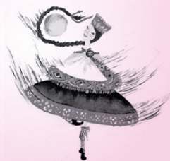
Foto izstāde „Sievietes fotomirklis” atklāj sievietes būtību laikmeta kontekstā

Deju pute- nis, kurā pie- dalīsies un ar dejām priecēs dāmu deju kole- ktīvi no dažā- diem novadiem.