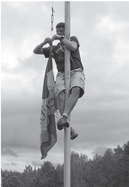
Par nometni „Cerība-2012” liecināja arī augstu mastā iekārtais karogs.