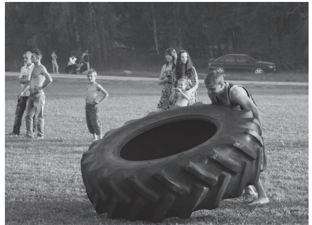
Ar interesi tika gaidītas spēkavīru sacensības.

Šogad Salas novada Sēlpils pagasta Zvejnieklīcī Daugavas svētki tika svinēti nu jau 22.gadu pēc kārtas, tādēļ var teikt, ka tie ir kļuvuši par tradīciju un visu gaidītiem svētkiem, kuros plaši pārstāvēta gan sporta, gan kultūras programma, kā arī bērniem visas dienas garumā sarūpētas dažādas aktivitātes.