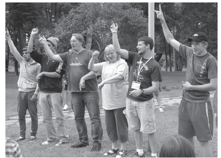
Tika dziedātas arī dziesmas.