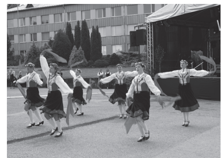
Krāšņus priekšnesumus sniedza Jēkabpils Valsts ģimnāzijas dejojāji.