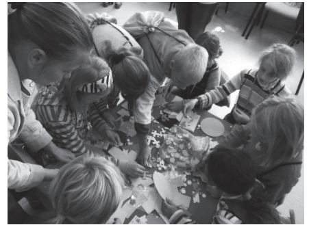
Bērni labprāt iesaistījās rokdarbu pulciņos.