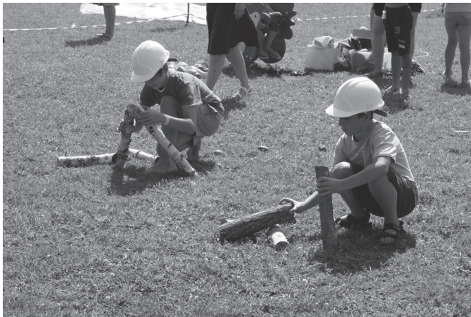
Bērni iesaistījās spēlēs un stafetēs.