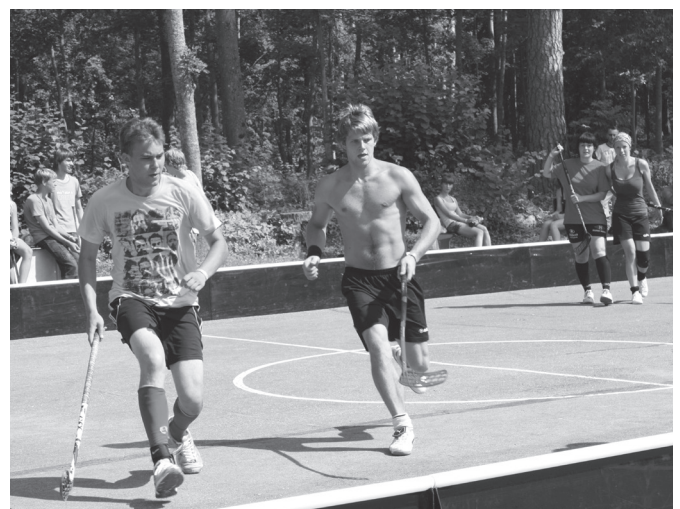
Sacensības norisinājās arī ielu florbolā.