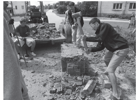
Ar kopīgu darbu iepazīties un sadraudzēties var ātrāk.