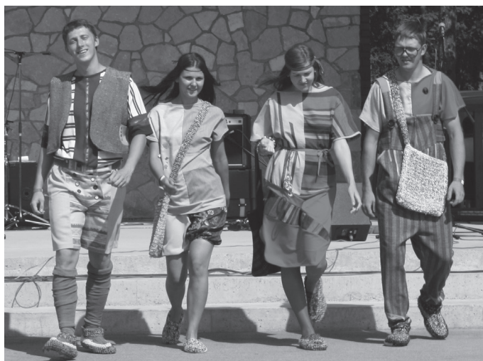
Interesantas idejas tika parādītas tērpu “Summer kitchen” skatē.