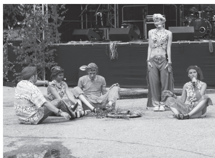
Ar Āfrikas pasakām iepazīstināja teātristudija „ESTEPATĀS”.