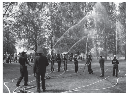
Savas prasmes demonstrēja Salas BUB ugunsdzēsēji.