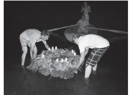
Koncerta noslēgumā Daugavas straumē tika palaists ziediem un svecēm rotāts vainags.