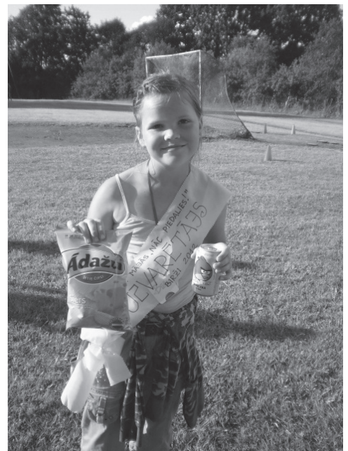
Visdažādākās balvas sagaidīja daudzo sacensību uzvarētājus.