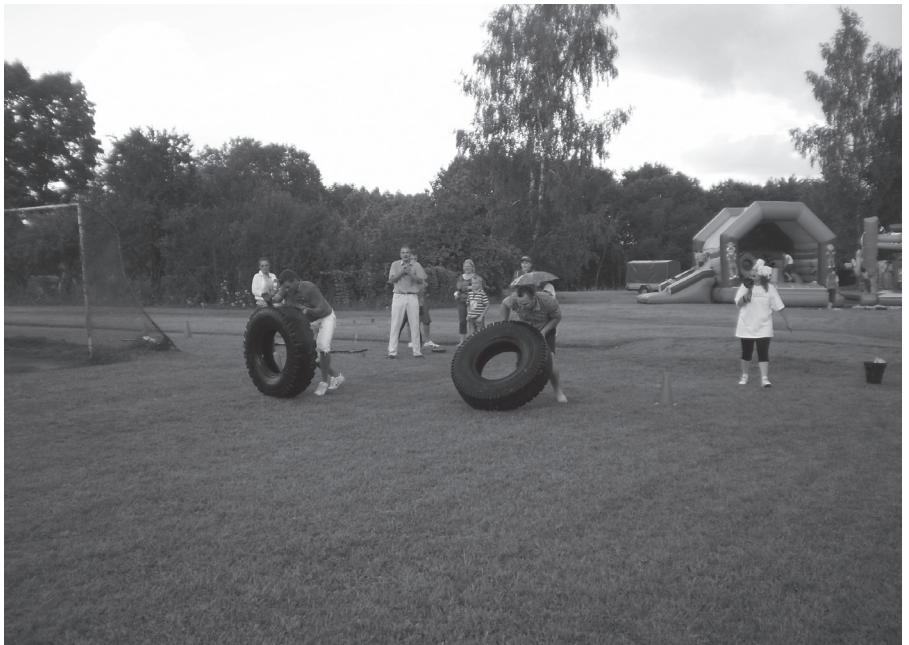
Spraiģi norisinājās spēkavīru sacensības.