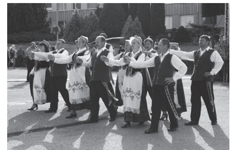
Ar dejām bija ieradušies arī viesi no Kriaunas.