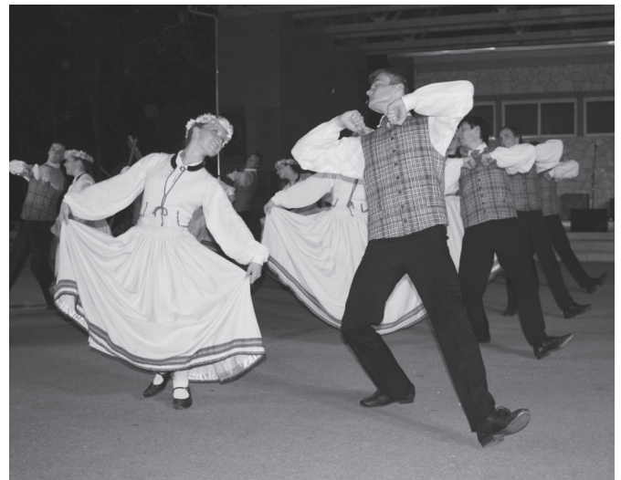
Ar skaistām dejām priecēja Rīgas celtniecības koledžas deju kolektīvs „Austris”.