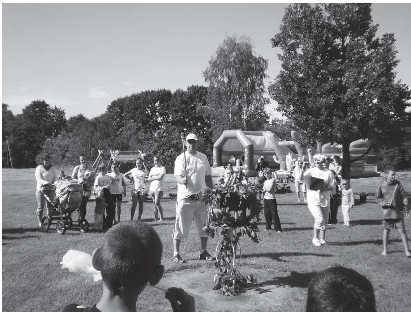
Tika aizdegta olimpiskā uguns.