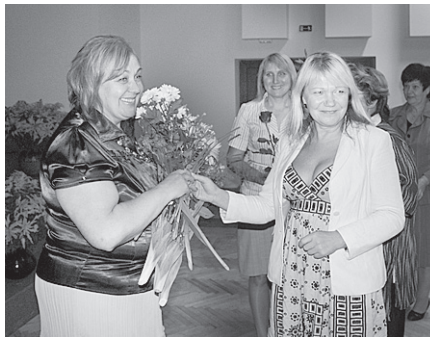
Pedagogus priecēja ne tikai Pateicības raksti, bet arī kolēģu apsveikumi un dāvētie ziedi.