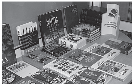
Izstāde „Ceļveži informācijas pasaulē”.