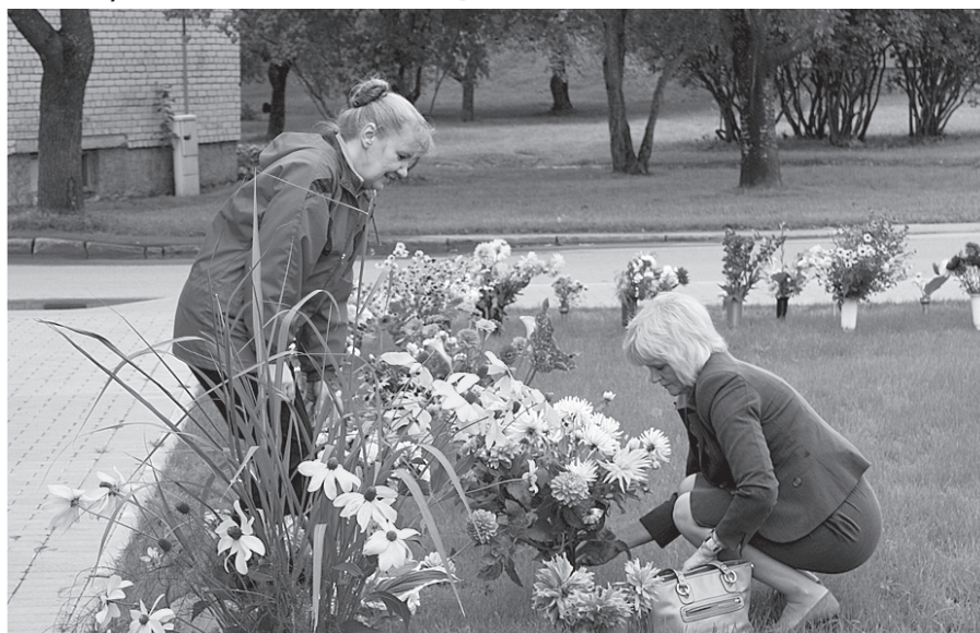
Garās ziedu rindas bija apskatāmas Salas centrā.

Šogad Salas novadā septembra mēnesis tika sagaidīts ar krāšņām ziedu kompozīcijām visos novada ciemos. Asociācijas ar šo laiku var būt dažādas – rudens atmāksana, rudens darbi vai skaistie ziedi dārzos un pagalmos. Un noteikti arī skolas gaitu sākums jaunajā mācību gadā. Tie ir svētki skolēniem, kas skolā sanākuši ar ziedu pušķiem, lai sveiktu skolotājus, un skolotājiem, kas gatavi sniegt savas zināšanas skolēniem, bet arī skolēnu vecākiem, vecvecākiem. Tādēļ ar ziedu kompozīcijām Salā, Sēlijā un Biržos tika sveikta rudens atmāksana un skolas gaitu uzsākšana.