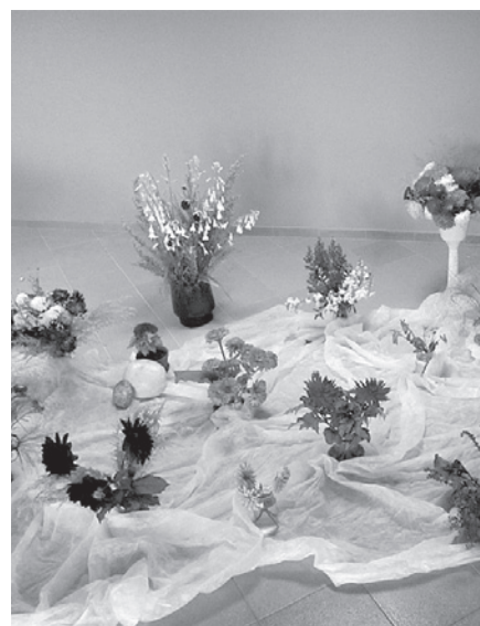
Ziedu izstāde Sēlpils kultūras namā.