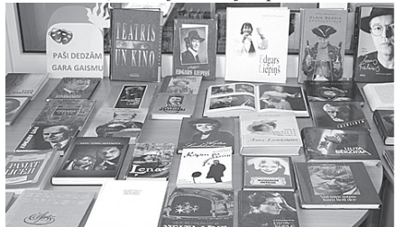
Izstāde „Paši dedzām gara gaismu”.