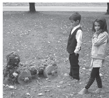
Bērniem visvairāk patika interesantās ziedu figūriņas Biržu tautas nama apkārtnē.