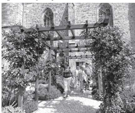
Bībeles augu dārzā Allendorfā.

ekskursijā uz Allendorfas pilsētu, kur pazemē atrodas sāls krājumi un vietējā upē ūdens ir ļoti sāļš, iespaidīga bija milzīgā sāls siena, kura veidota no sīkiem žagariem, uz kuriem līst sāļš ūdens un veidojas sāls kristāli. Apskatījām Allendorfas baznīcu un pie baznīcas esošo „Bībeles dārzu,” kurā atrodas visi augi, kas pieminēti Bībelē. Bijām vietā, kur kādreiz robeža sadalīja Vācijas divās daļās. Iepazināmies ar vēsturiskiem materiāliem un kara tehniku. Iespaidīga izskatījās augstā kalnā 1170. gadā celtā „BurgHanstein” pils, kuru kara laikā kā novērošanas punktu izmantoja krievu armija.