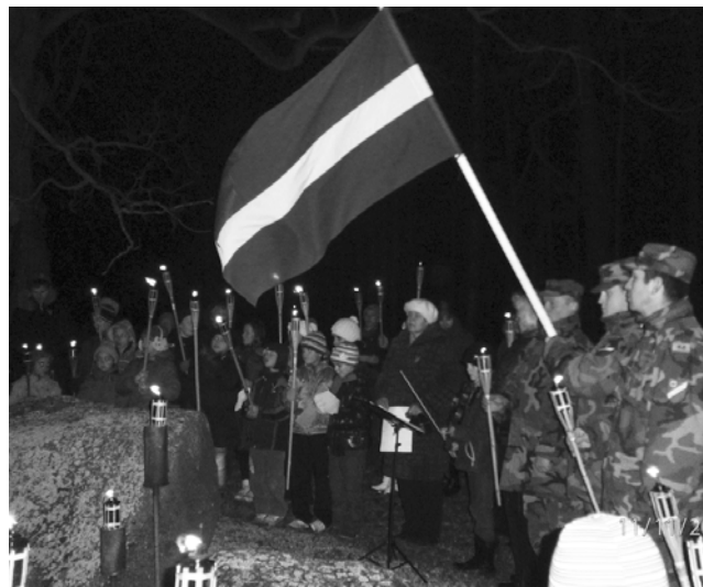
Lāpu gājienā tika pieminēti visi brīvības cīnītāji.

11. novembris ir Lāčplēša diena, kas tiek atzīmēta par godu neatkarīgās Latvijas valsts armijas uzvarai pār Rietumu brīvprātīgo armiju jeb tā saukto Bermona karaspēku 1919. gada 11. novembrī. Tādēļ tieši šajā dienā tiek godināti Latvijas brīvības cīnītāji.