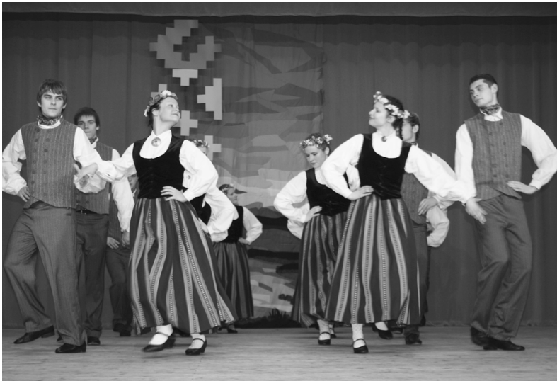
Ar jaunām dejām uzstājās jauniešu tautu deju kolektīvs „Dūmiņš”.