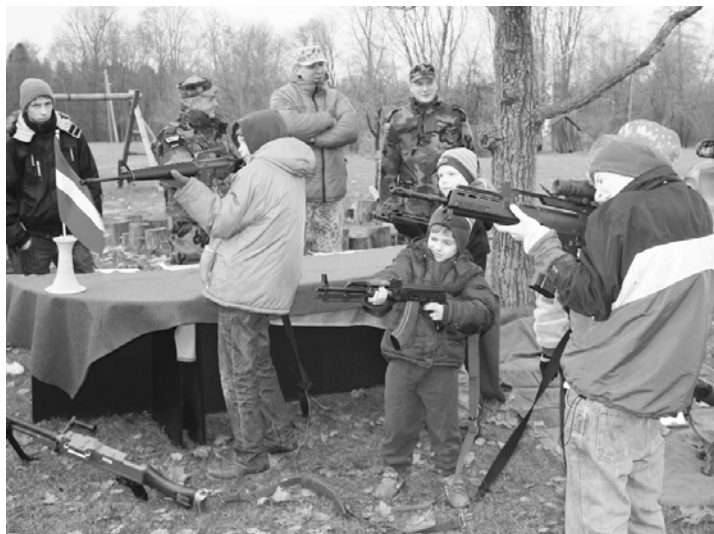
Zemessargi ne tikai pastāstīja par katra ieroča uzbūvi, bet arī pamācīja, kā tos lietot.