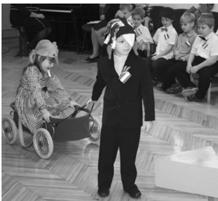
Tika iestudēta teika par to, kādēļ Rīgas torņa galā sēž gailis.

Laikā, kad visā valstī tika svinēti Valsts svētki, arī pirmsskolas izglītības iestādē „Ābelīte” bērni bija sagatavojuši dažādus priekšnesumus, lai parādītu tos citiem.