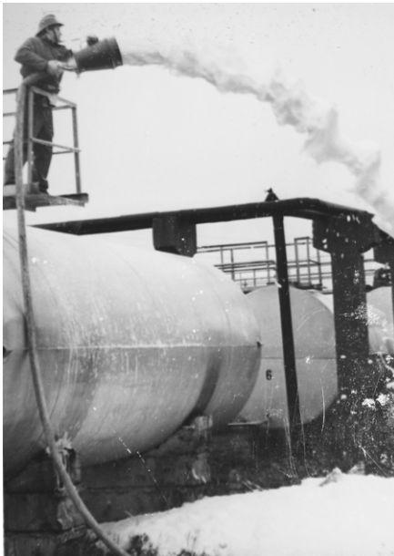
Valdis Straume mācībās Salas naftas bāzē 1980-to gadu beigās.