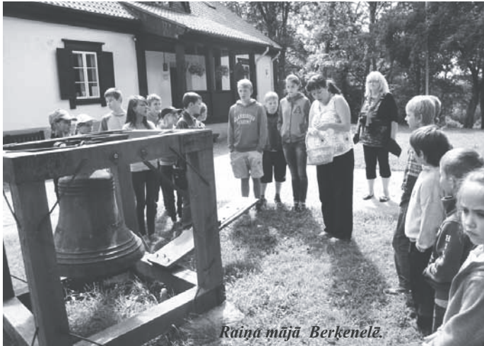
Raiņa mājā Berkenelē.