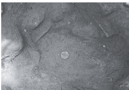
Strūves ģeodēziskā loka punkta „Arbidāni” centrs

Šā gada 17. janvārī novada pārstāvji piedalījās Latvijas Ģeotelpiskās informācijas aģentūras, Latvijas Mērnieku biedrības un Valsts kultūras pieminekļu aizsardzības inspekcijas organizētā pasākumā „UNESCO Pasaules mantojuma objekta Strūves Ģeodēziskais loka divu autentisko punktu un vienas lauka observatorijas iekļaušana Valsts kultūras pieminekļu sarakstā. Eiropas mērnieku padomes (GLCE) pasludinātā Strūves gada sākums” par Strūves ģeodēziskā loka punkta „Arbidāni” Sēlpils pagastā iekļaušanu valsts aizsargājamo pieminekļu sarakstā.