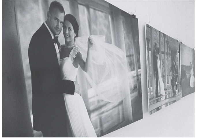
Dž. Saulītes kāzu fotogrāfiju izstāde "Par mīlestību"

Informāciju sagatavoja: M. Bataraga Salas KN direktore