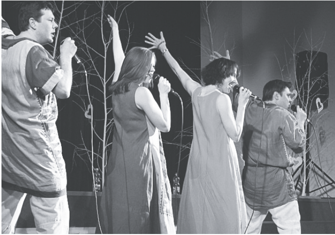
LNT dziedošo aktieru ansamblis "DRĀMA"