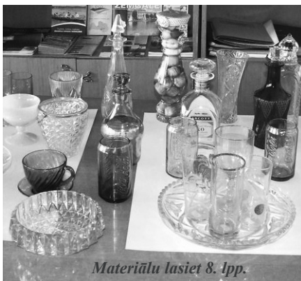
Materiālu lasiet 8. lpp.