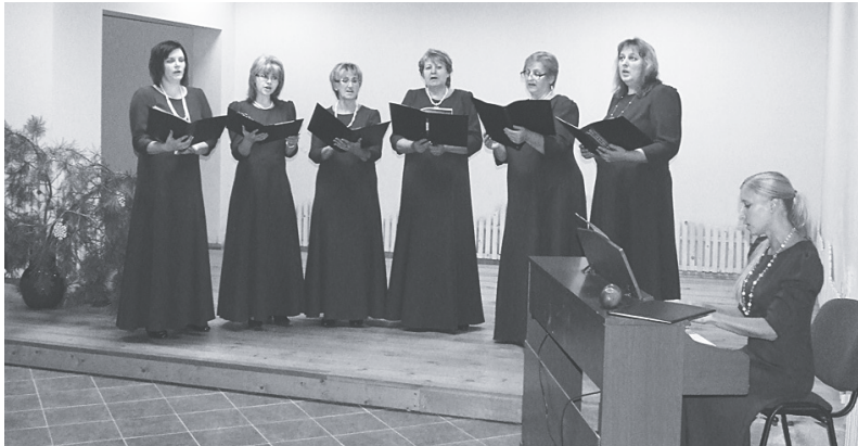
Sieviešu vokālais ansamblis „Lira”

Šā gada 7. martā Jēkabpils Tautas namā notika Aknīstes, Jēkabpils, Krustpils, Salas, Viesītes novadu „Jēkabpils pilsētas un Madonas novada Kalsnavas pagasta vokālo ansambļu skate – koncerts.