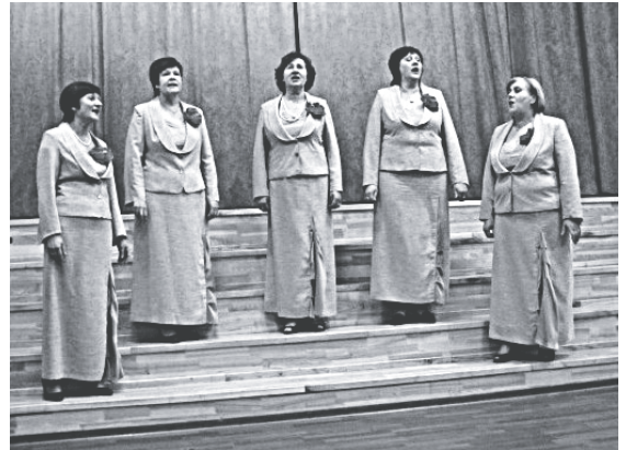
Sieviešu vokālais ansamblis „Belkanto”

Izglītības un kultūras pārvaldes speciāliste kultūras un interešu izglītības