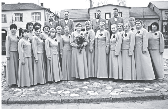
Jauktais koris „Sēlpils”