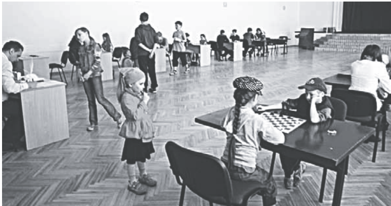
Dambretes spēle aizrauj arī skatītājus.