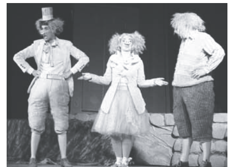
„Trīs sivēntiņi un vilks Vilmārs”