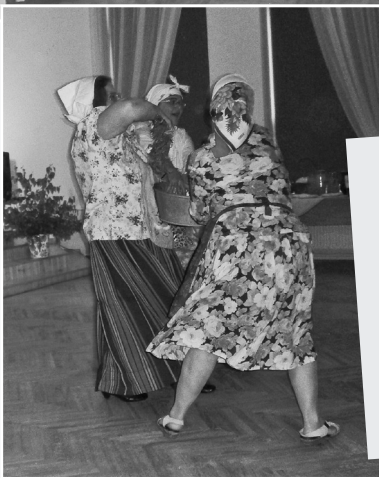
Biržu Tautas nama teātra grupas variācija par R. Blaumaņa "Skroderdienām Silmačos"