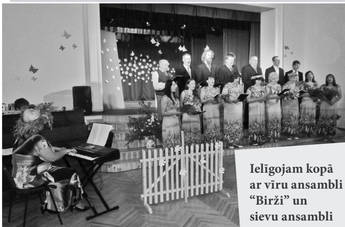
Ielīgojam kopā ar vīru ansambli "Birži" un sievu ansambli "Melodija"