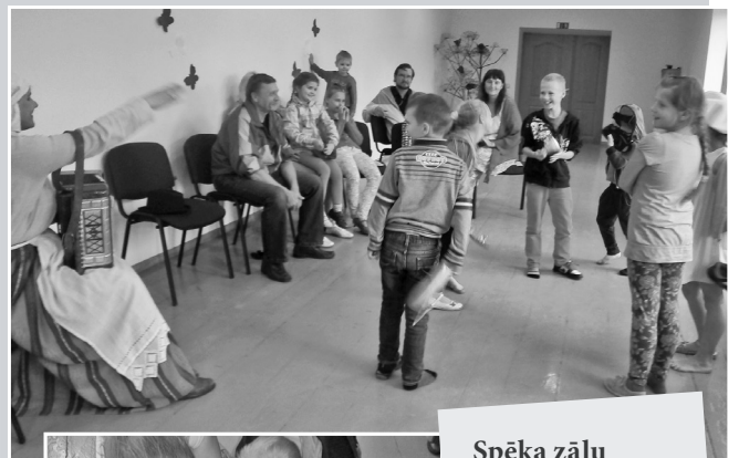
Spēka zāļu iepazīšana, ticējumi, zīlēšana u.c. ar Ligo laiku saistītas izdarības