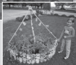
Ziedi ar rudens smaržu pie Biržu Tautas nama