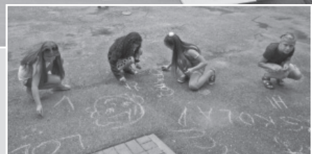
1.septembris – pēcpusdienu