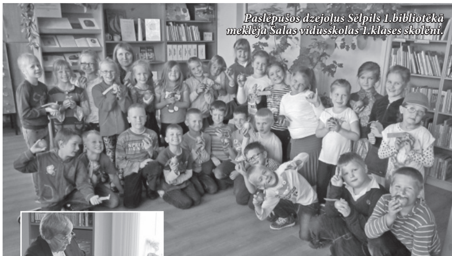
Paslēpušos dzejoļus Sēlpils 1.bibliotēkā meklēja Salas vidusskolas 1.klases skolēni.