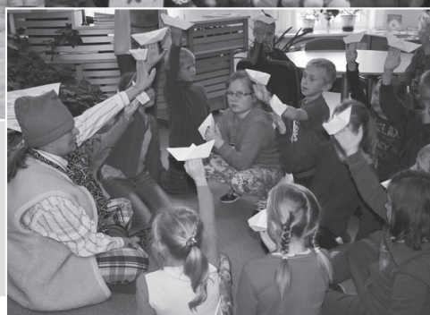
Bērni kopā ar Rūķi locīja kuģiņus, lai ceļotu no dzejoļa pie dzejoļa.

savs dzejolis pēc J.Baltvilka dzejoļa „Apoga alfabētš” noklausīšanās.