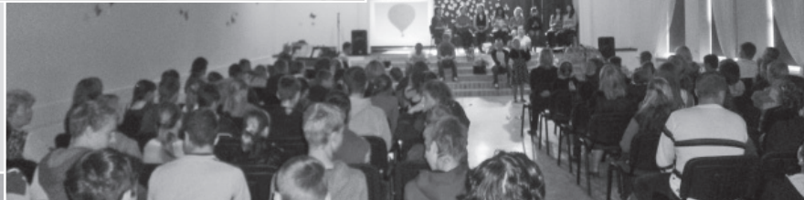
Br.Martuževas dzejas uzvedumā „Caur dienām nevalodīgām