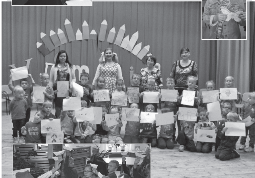
Pirmsskolas vecuma bērni ar Lellīti Annīti un Lellīti Lolīti uzzīmēja katrs savu dzejoli.