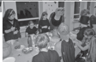
Helovīnu vakariņu galds