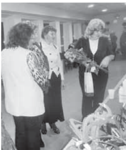
Dzintras Siliņas origami izstāde