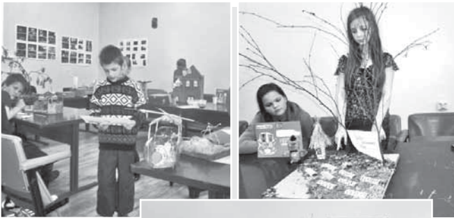
Radošā darbnīca bērniem "Aiz apvāršņa"