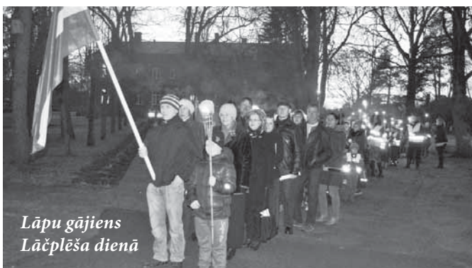
Lāpu gājiens Lāčplēša dienā

"Gaišma šūpojas kā šūpoles: spēžak rēnāk spēžak rēnāk bet nekur nepazūd jo gaišma caur dvēseli ienāk ne caur loga rūtīm. /M. Laukmane/