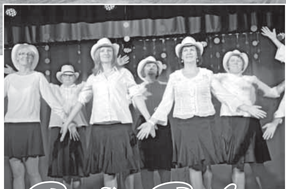
Biržu Tautas namā