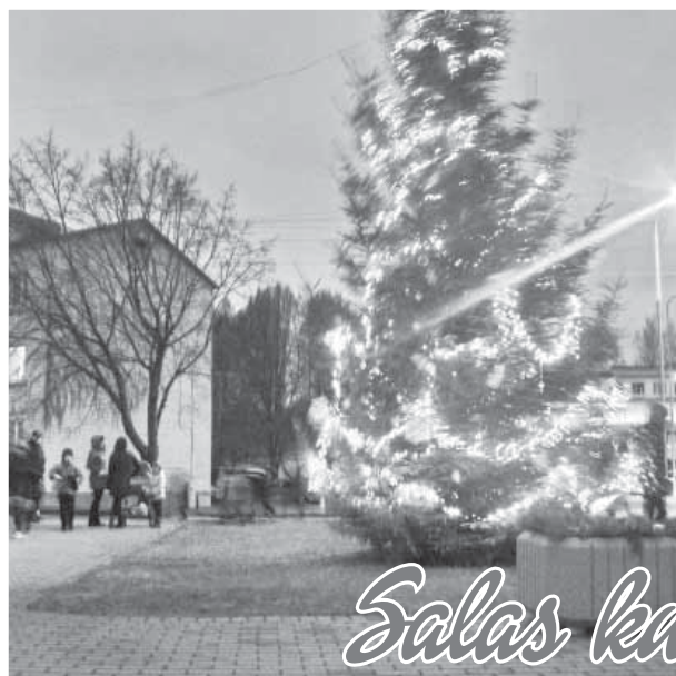
Salas kultūras namā