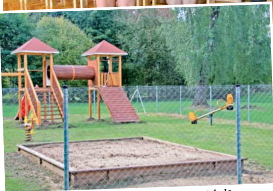
Rotaļlaukums Biržu internātpamatskolā

Ir pagājis 1.septembris. Svētku gaisotne mainījies ar mācību darba procesa sākumu. Šovasar kā nekad agrāk masu plašsaziņas līdzekļos notika diskusijas par atalgojuma aprēķināšanas izmaiņām pedagogiem, par mazajām lauku un mazpilsētu skoliņām, kurās grūti nokomplektēt klases.