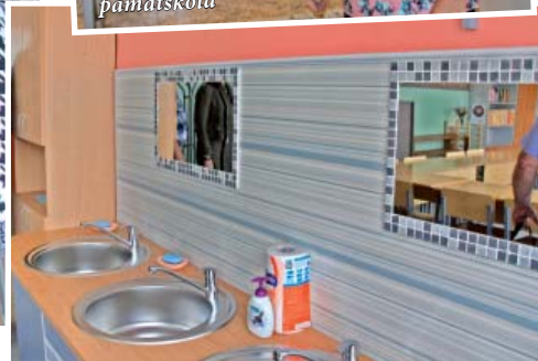
Salas vidusskolas vizuālās mākslas kabinets jaunā veidolā