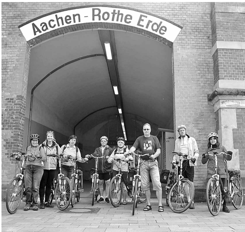
Kopā ar kolēģiem no Latvijas un Spānijas, uzsākot braucienu pa „Vennbahn” no Āhenas (Vācija).