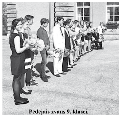
Pēdējais zvans 9. klasei.

Desmitā klase mūs izsvērtēja no skolas pateicībā par 12. klases organizētājiem lieliskajām, šermīnošajām iesvētībām.