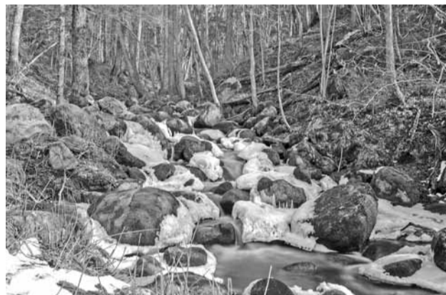
Akmeņupīte 2016. gada 27. martā.

Atklājot Ērgļu novadu sev no jauna - Lelde Gangnuse-Bērziņa