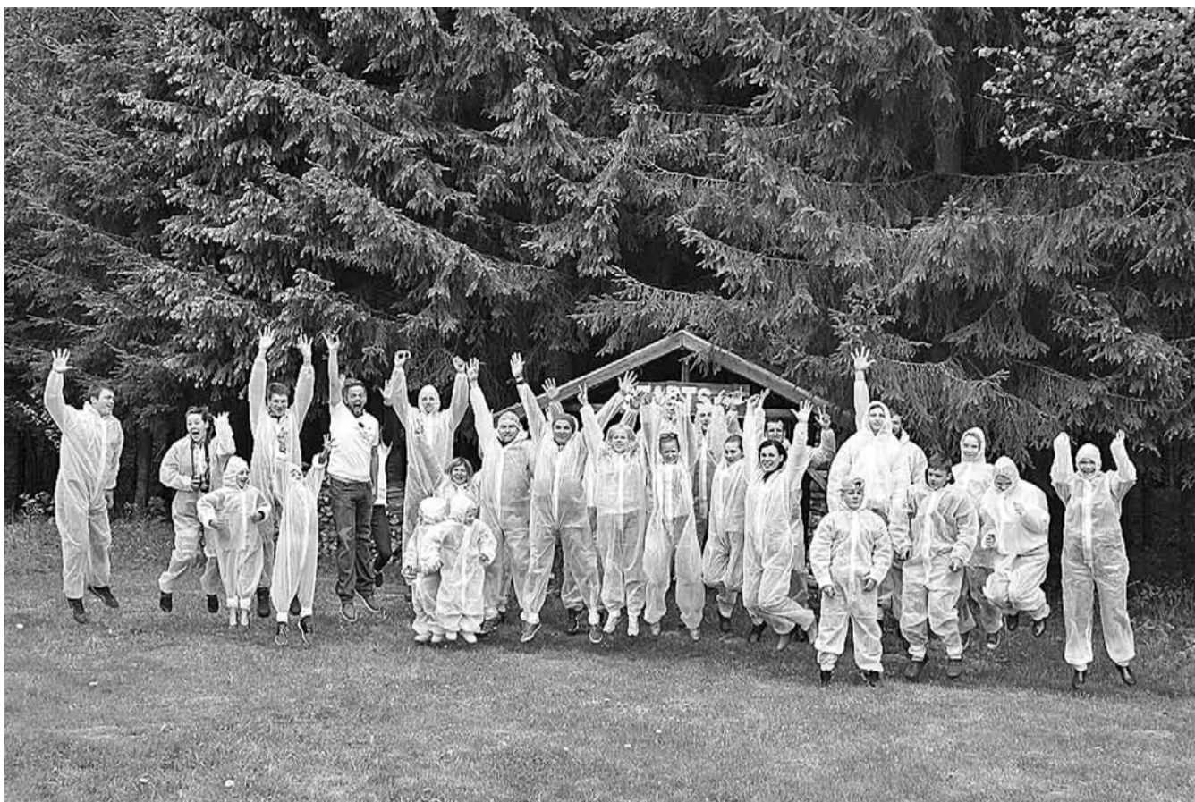
2016. gada čempionāta dalībnieki.