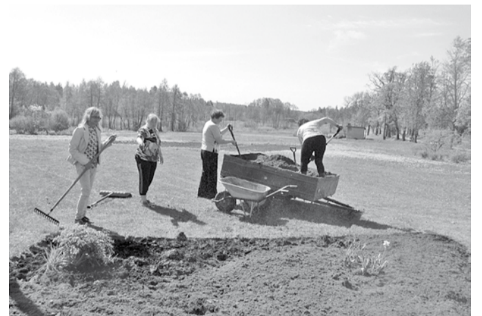
Top ziemciešu puķu dobe pie Jumurdas pagasta pārvaldes.