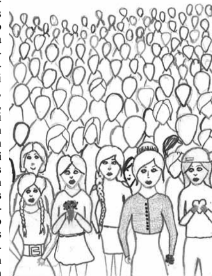
Benitas Kārklīnas zīmējums

(..) Stāsts nav uzrakstīts kā parasti stāsti, tas vairāk tiek pasniegts kā pasaka, kas nesākās ar slaveno „Reiz bija...”, bet ar „Kad man bija seši gadi...”. Grāmata „Mazais princis” rakstīta bērniem, bet vairāk domāta pieaugušajiem. (..) Izlasot tieši šo stāstu, tu saproti, kas ir kļūdas, cik daudz tev nozīmē paši tuvākie, cik ļoti tu viņus mīli, patiešām mīli no visas sirds. „Katram cilvēkam zvaigznes ir citādas. Ceļniekiem tās norāda ceļu. Citiem tās ir tikai mazas uguniņas. Zinātniekiem tās ir problēmas. Manam biznesmenim tās bija zelts. Bet visas šīs zvaigznes kļūst. Tev turpretim būs zvaigznes kā nevienam...” Ko vēlos ar šo teikt? Ir jānovērtē katra zvaigzne, kas mums ir. Citiem tās varētu būt vislabākās māšas, mamma, omītes un krustmātes. Kādam brāļi, tēti, opīši un krusttēvi.