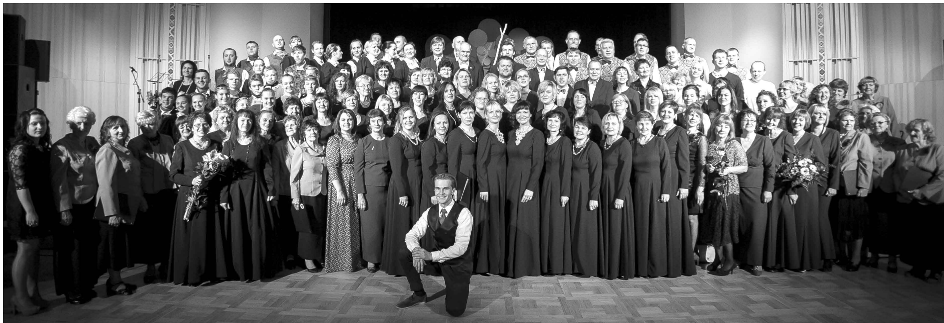
2015./2016.gada sezonas ieskandināšanas koncerts.

Ja citiem jaunais gads sākas 1.janvārī, tad pie mums, Smiltenes pilsētas Kultūras centrā, tas sākas jau septembrī, kad pēc atpūtas atgriežas mūsu amatiermākslas kolektīvi. Varam droši teikt – esam gatavi jauniem darbiem, idejām un notikumiem!