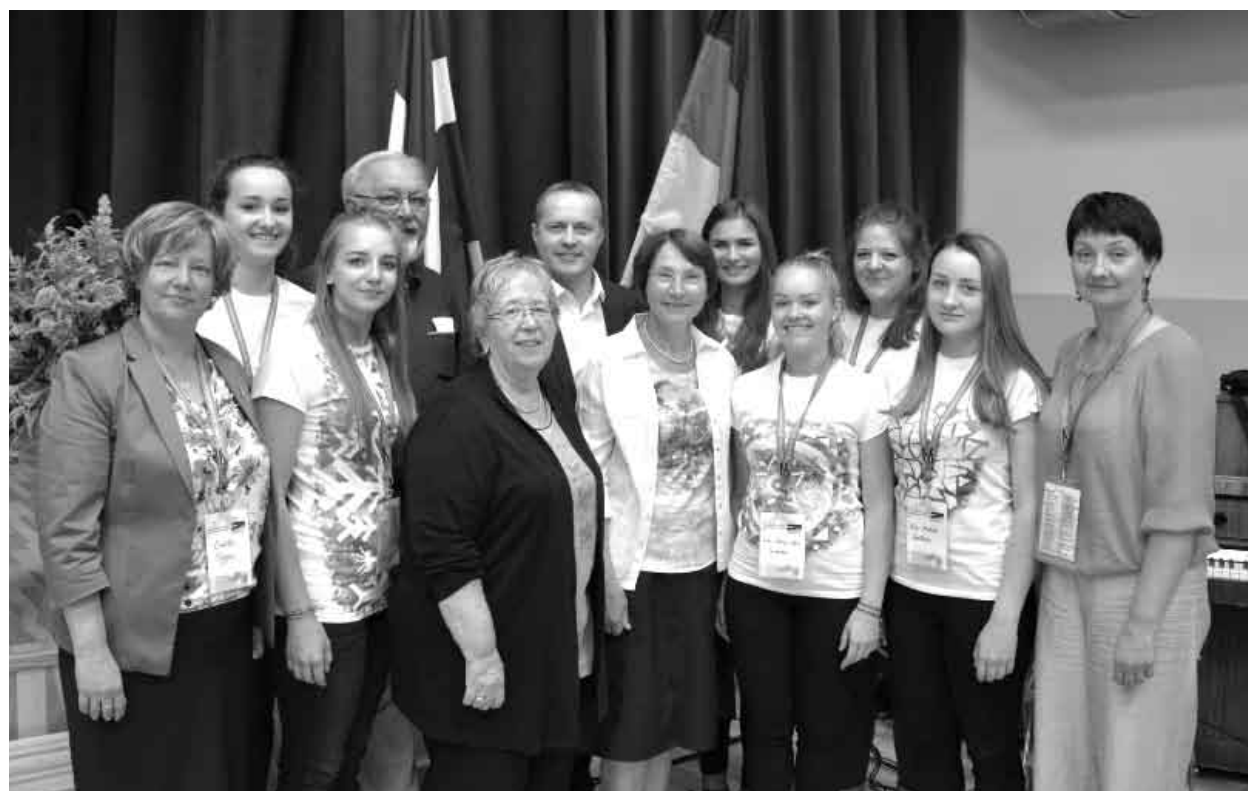
Smiltenes vidusskolas jaunieši kopā ar domes priekšsēdētāju un draugiem no sadraudzības pilsētas Villihās

Smiltenes vidusskolas jaunietes ir gandarītas par dalību forumā, lai gan pirms došanās uz forumu nebija ne jausmas, kas viņas tur sagaida, forumam noslēdzoties