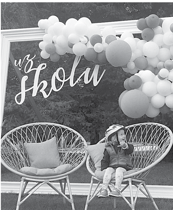
Uz skolu! Bērnudārzu izlaižam!