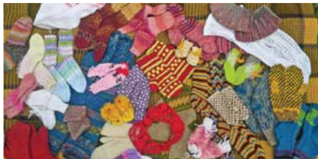
Maruta rāda pašdarinātās zeķes un citus adījumus.

„Stāsts ir arī šai brošiņai. To uzdāvināja krustmāte, kad vēl biju pioniere. Atdeva man, jo pašai meitas nebija. Sakta ir Latvijas karoga krāsās, un tajā laikā man kā mazajam padomju pionierim tā likās tāda aizliegta lieta. Visus šos gadus noturēju koka lādītē, tikai pirms pieciem gadiem izņēmu un sāku nēsāt.”