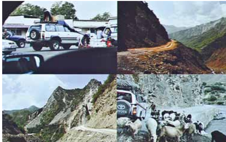
Pamira lielceļš – viens no bīstamākajiem un augstākajiem pasaulē.