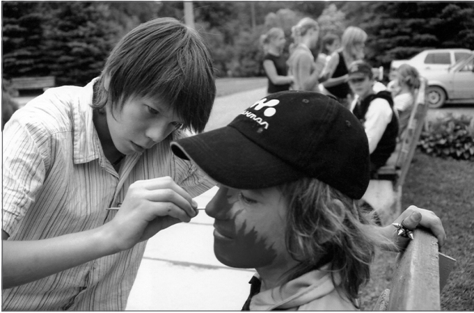
Arvis Mālpils mākslas skolā

ku laimīgi aizmirstot, atkal sevī no jauna atradu, kad pievērsos bītboksam (beatbox).