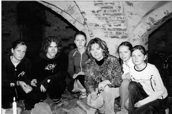
Izziņas process Mālpils baznīcas kriptā

Tā ir sagādājies, ka šis, iespējams, ir pēdējais stāsts par Mālpils Mūzikas un mākslas skolu mūsu visu iecienītajā un lasītajā avīzītē "Mālpils Vēstis"... Tāpēc gribas šeit ievietot stāstus par māksliniekiem, kuri pie mums atnāca vēl kā zēni. Statistiski Mākslas nodaļu pa šiem 27 gadiem beiguši 128 audzēkņi, no kuriem 27 bijuši zēni. Tātad 1 zēns 1 gadā. Tā ir tikai statistika, bet katrs no viņiem ir izvēlējis savu ceļu dzīvē. 7 puiši turpināja un turpina savu izglītību arī mākslas nozarē – diviem sākotnējā interese bijusi par modes dizainu, kas ļāva piepildīt vēlmes būt atšķirīgam arī vizuālā tēla ziņā. Diviem interese vairāk saistīta ar ar-