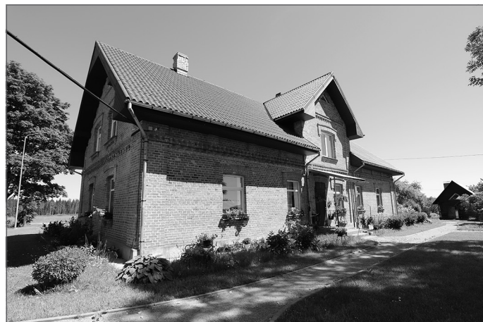
Atjaunotās un skaisti sakoptās Jaunbūņas, 2021. gada 17. jūnijs