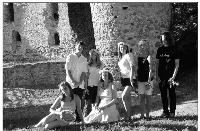
Izlaiduma turpinājums Cēsu pilī, 2007. gads