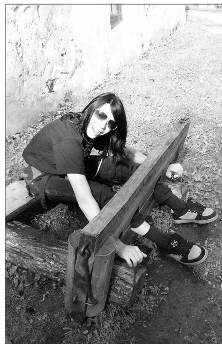
Arvis Mālpils mākslas skolā