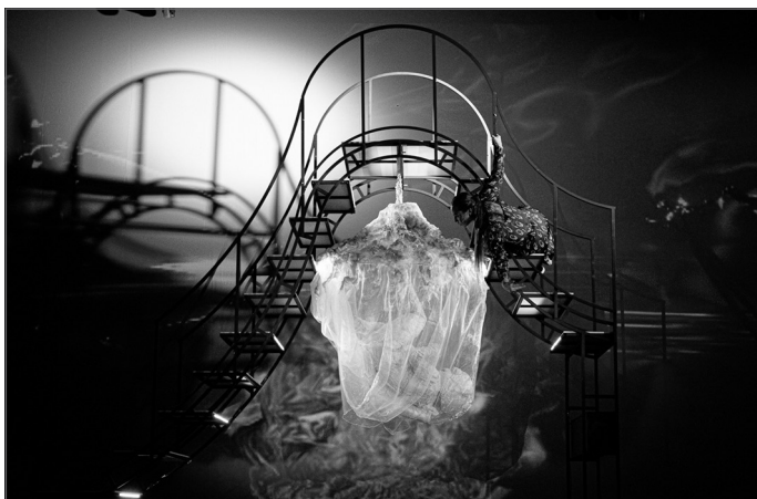
Butaforija izrādē "Alise Brīnumzemē" Latvijas Nacionālajā teātrī