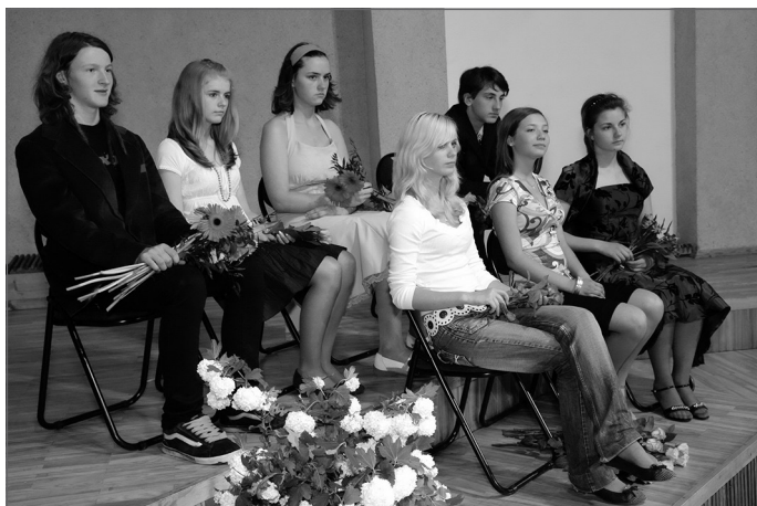
Ernests (1. no kr.) izlaidumā, 2007. gads