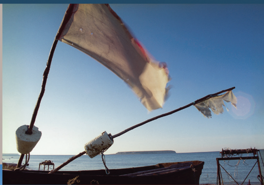
Foto- och musikutställning EN VIRTUELL BRO MELLAN LIVLAND OCH GOTLAND av fotografen JANIS MEDNIS

Fotogrāf JĀNIS MEDNIS fotomūzik nāgtīmi LĪVĒD RĀNDA – GOTLAND KUBBŪIKIMI