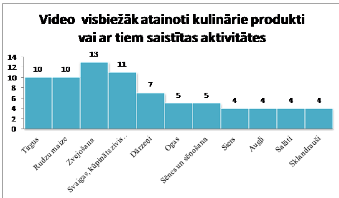
5. tabula. Video visbiežāk atainoti kulinārie produkti vai ar tiem saistītas aktivitātes