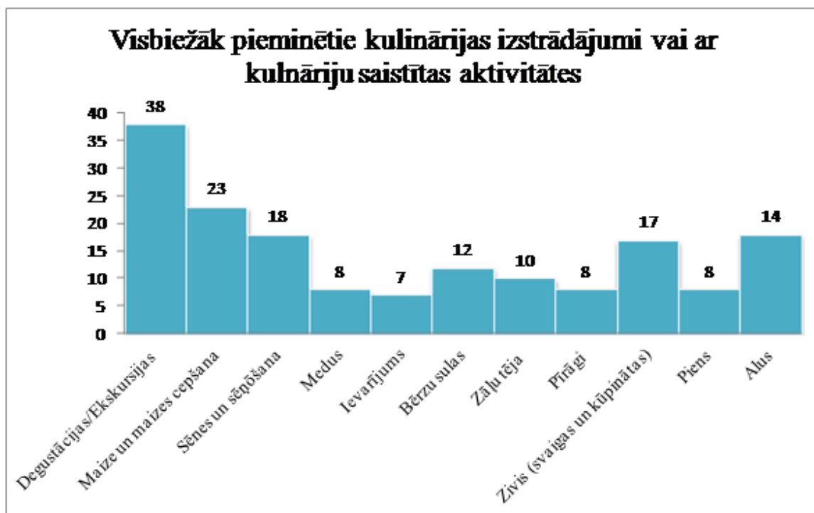
1.tabula. Visbiežāk pieminētie kulinārijas izstrādājumi vai ar kulināriju saistītas aktivitātes