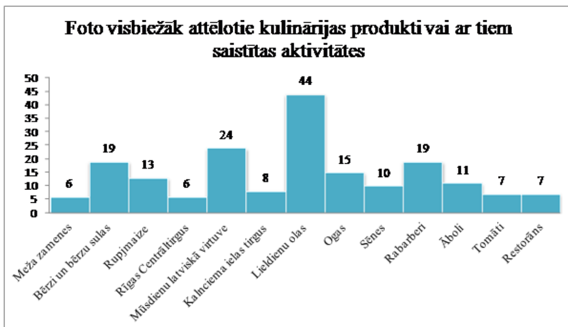
2.tabula. Foto visbiežāk attēlotie kulinārijas produkti vai ar tiem saistītas aktivitātes.