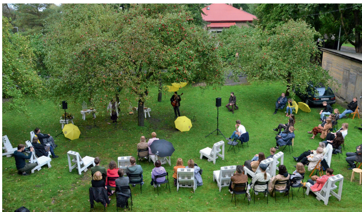
Sarīkojums Ojāra Vācieša muzeja dārzā

Dzejas dienas Jūrmalā tika svinētas ar dzejas lasījumiem pie Raiņa priedēm, poētisku pastai-