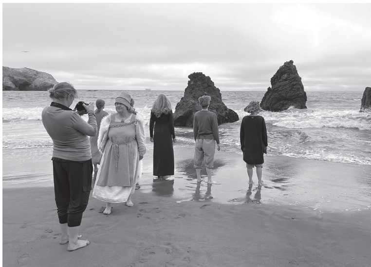
SFJT aktieri, filmējot video A. Brigaderes lugai "Pastari"