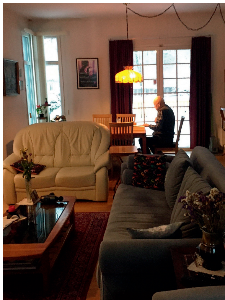
Mežaparka mājā, lasot