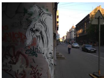
21 - stencila tehnikā veidotais zīmējums