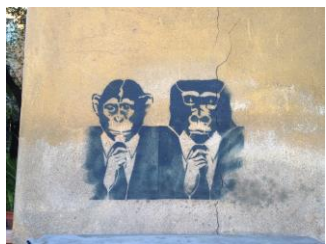
1 – stencila tehnikā veidotais zīmējums