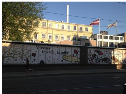
5 - sienas gleznojums