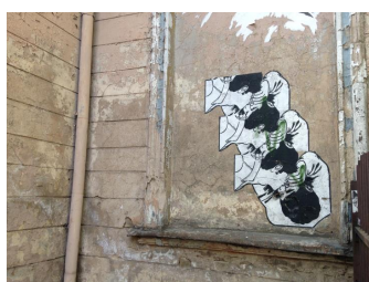
13 - stencila tehnikā veidotie zīmējumi