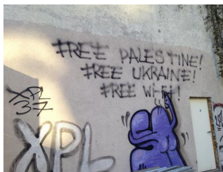
12 – uzraksts uz sienas