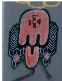
2 - uzlīme