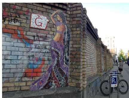
11 – mozaīka uz sienas