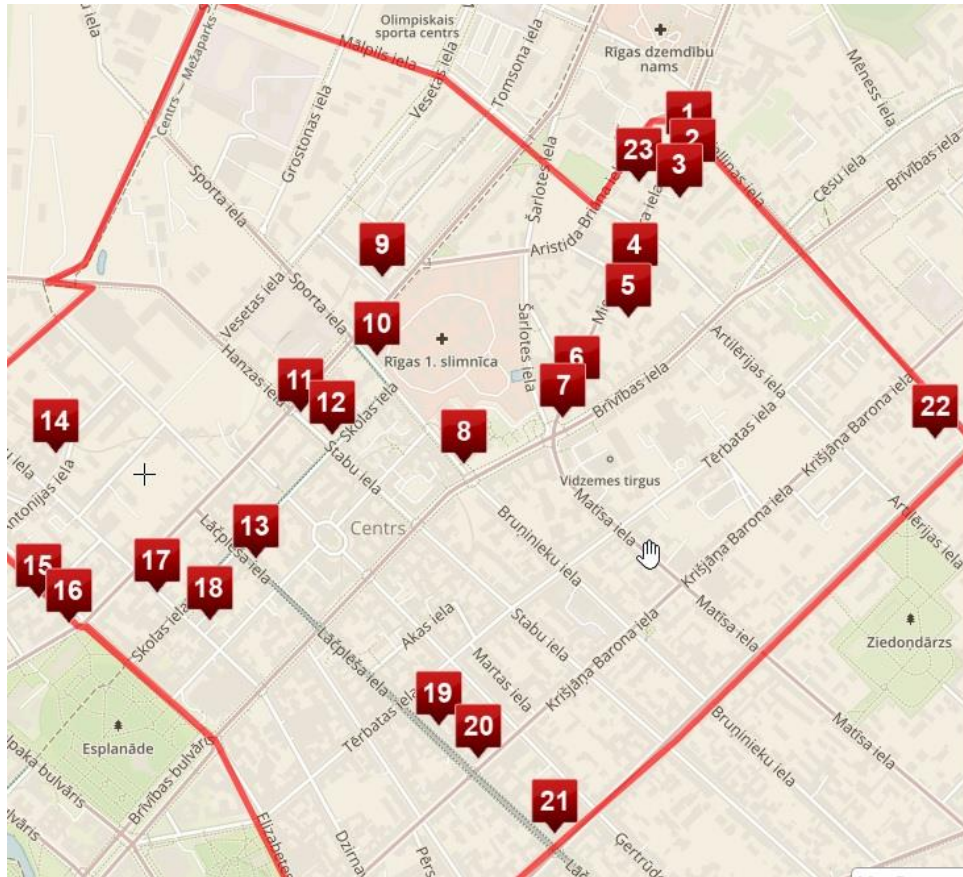
Rīgas ielu mākslas darbu karte