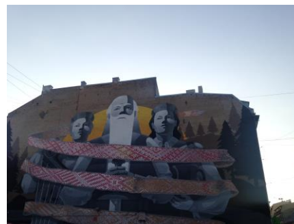
22 - stencila tehnikā veidotais sienas apgleznojums