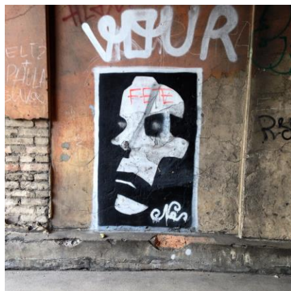
9 - stencila tehnikā veidotais zīmējums