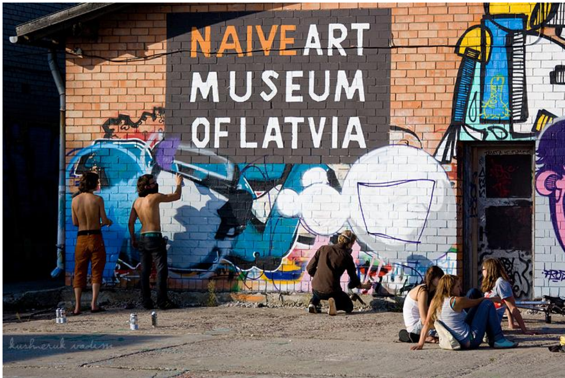
Latvijas Naīvās mākslas muzejs