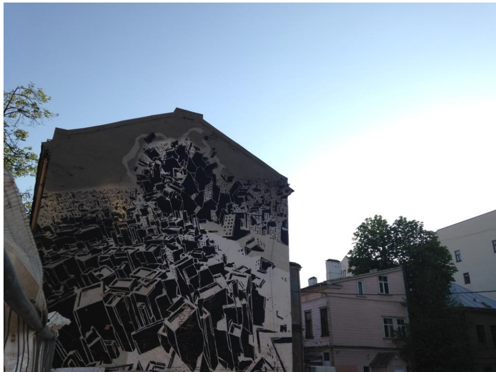
Ielu mākslas darbi uz Kaņepes Kultūras centra sienām Nofotografēts 2016. gada 9. maijā.