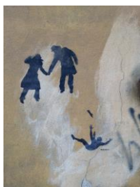
3 - stencila tehnikā veidotais zīmējums