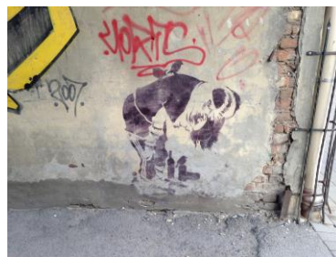
20 - stencila tehnikā veidotais zīmējums