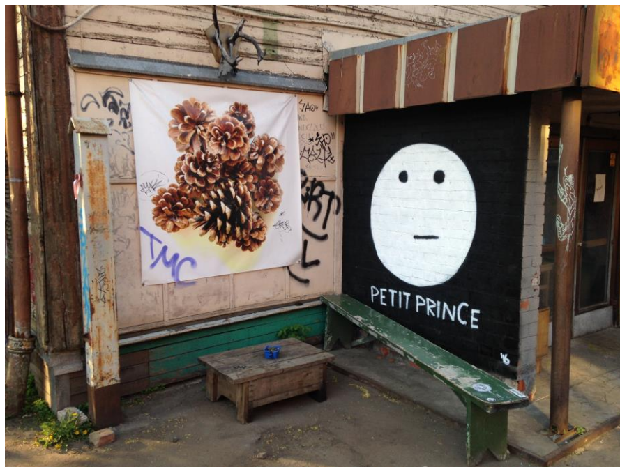
Ielu mākslas darbu uz Autentika 2 ēkas Nofotografēts 2016. gada 9. Maijā