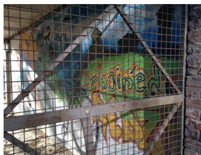
4 – sienas gleznojums