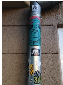
6 - uzlīmes