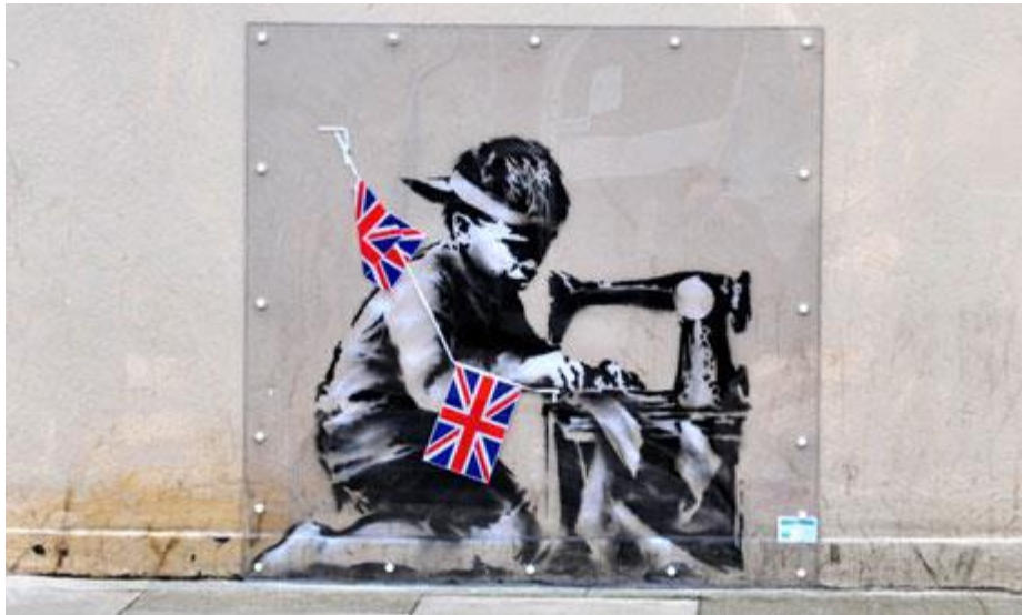
Banksy „Slave Labour”