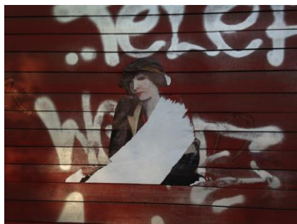
7 - afiša