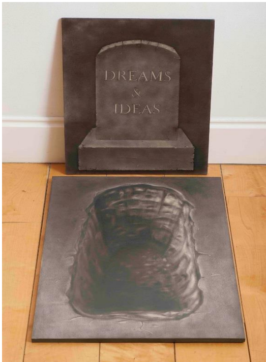
4.attēls – Sapņi un idejas (2014)