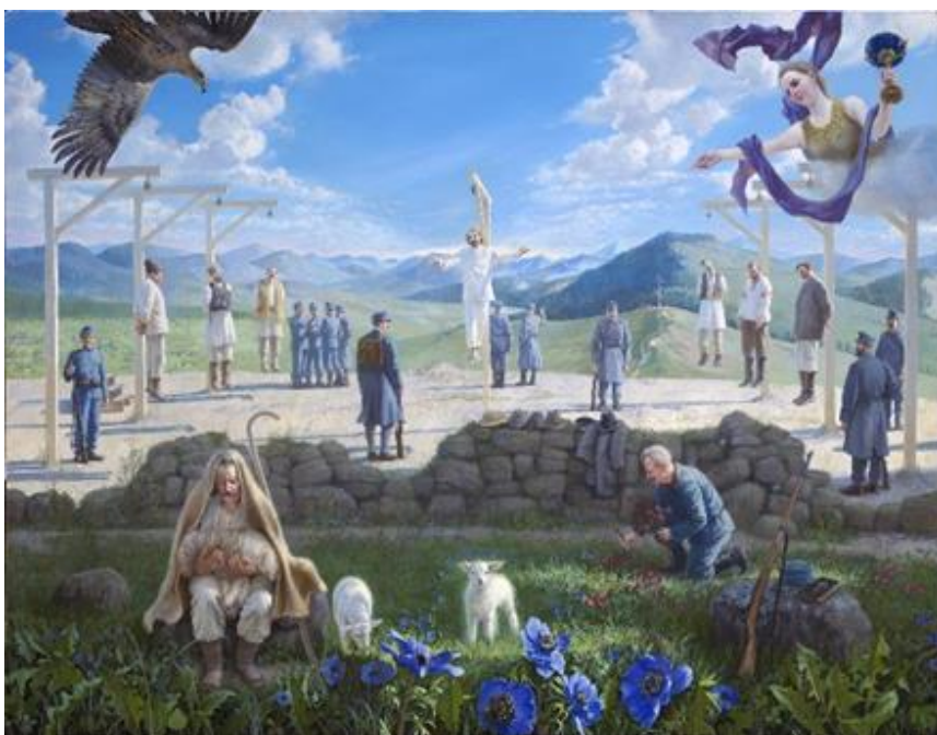
8.attēls – Jēra apraudāšana (2007 – 2009)