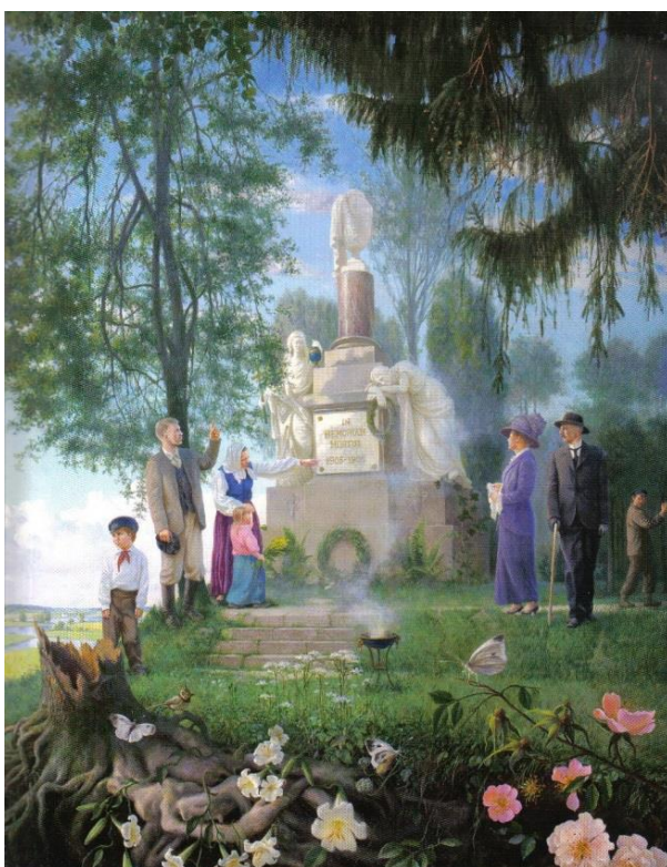
2. attēls – In memoriam (2006 – 2009)