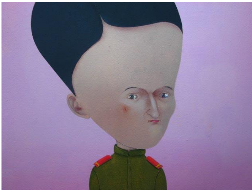
1. attēls – Femina militaris (2007)