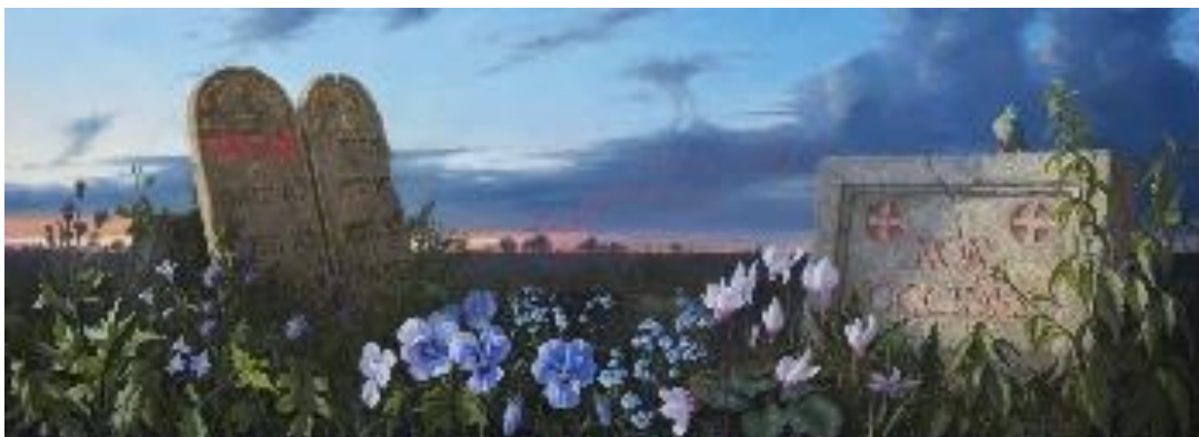
5.attēls – Non Occides (2008 – 2009)