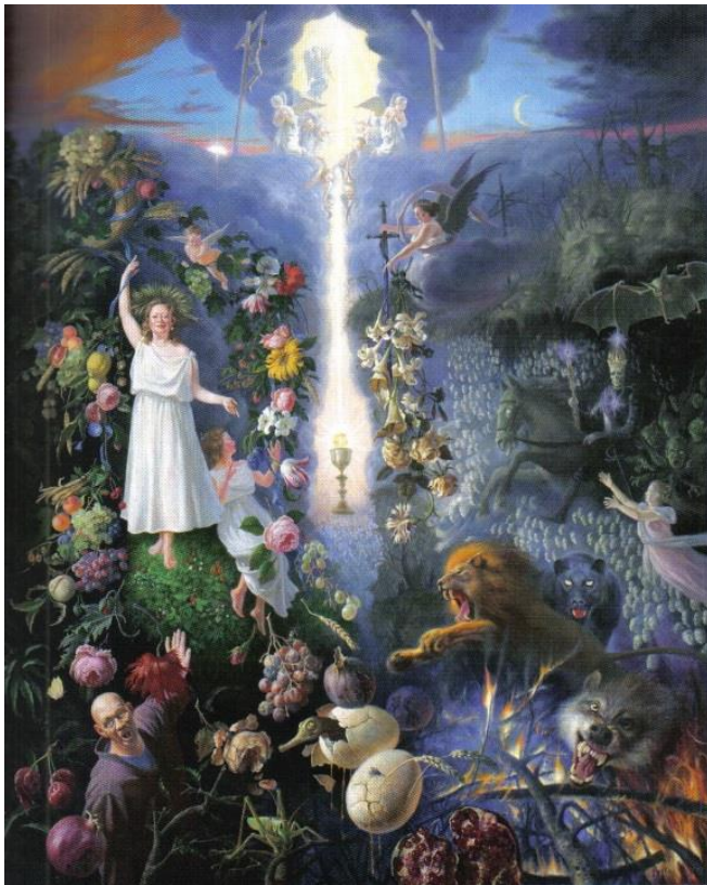
4. attēls – Ceturtais Apokalipses jātnieks (2007 – 2009)