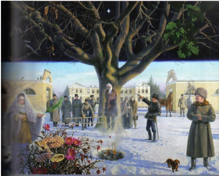
3.attēls – Upuris (2006 – 2009)