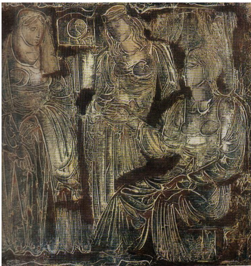
3.attēls – Kurzeme (1976)