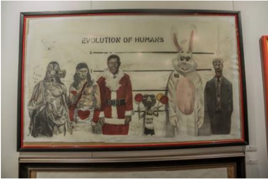
5. attēls – Evolution of humans /Notiesātie par slavu (2014)