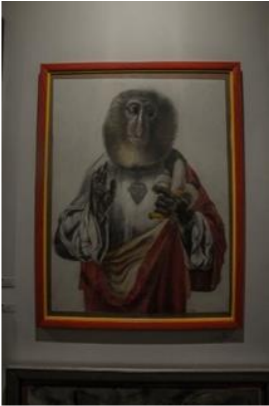
6. attēls – Pesūtājs (2014)