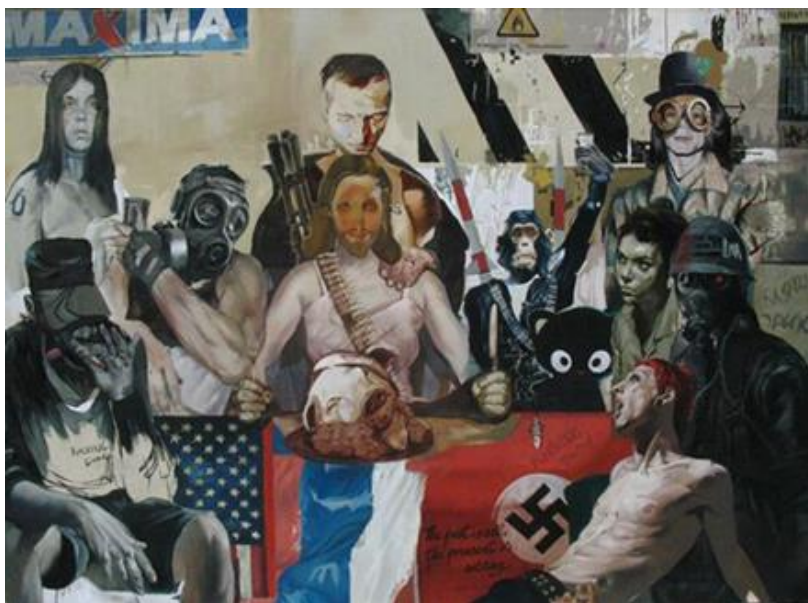
3. attēls – Svētais vakarēdiens (2011)