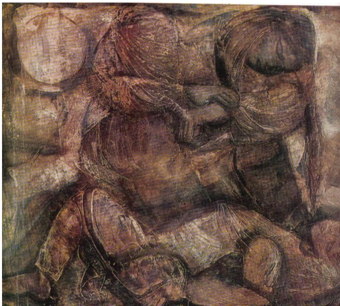
2. – Vjetnamas māte (1971)