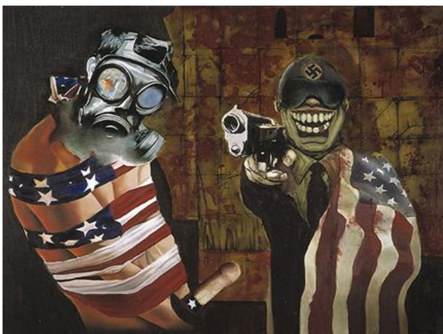
4. attēls – Jaunā Amerika (2014)