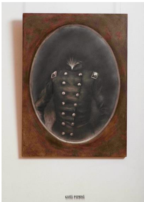
2. attēls – Gaišā piemiņā (2014)