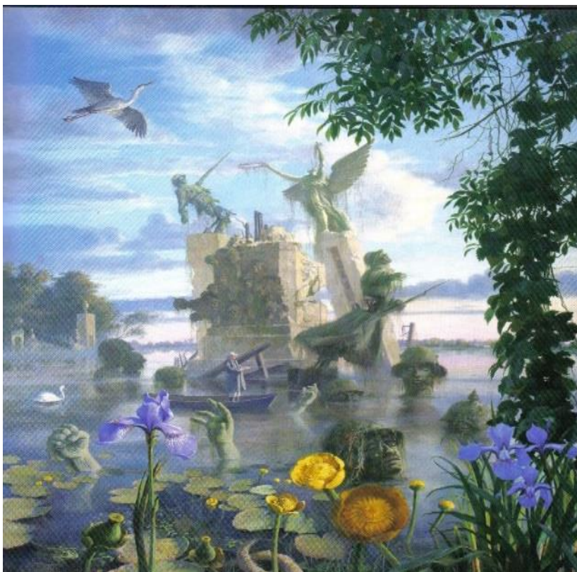
7.attēls – Nogrimušais piemineklis (2007 – 2009)