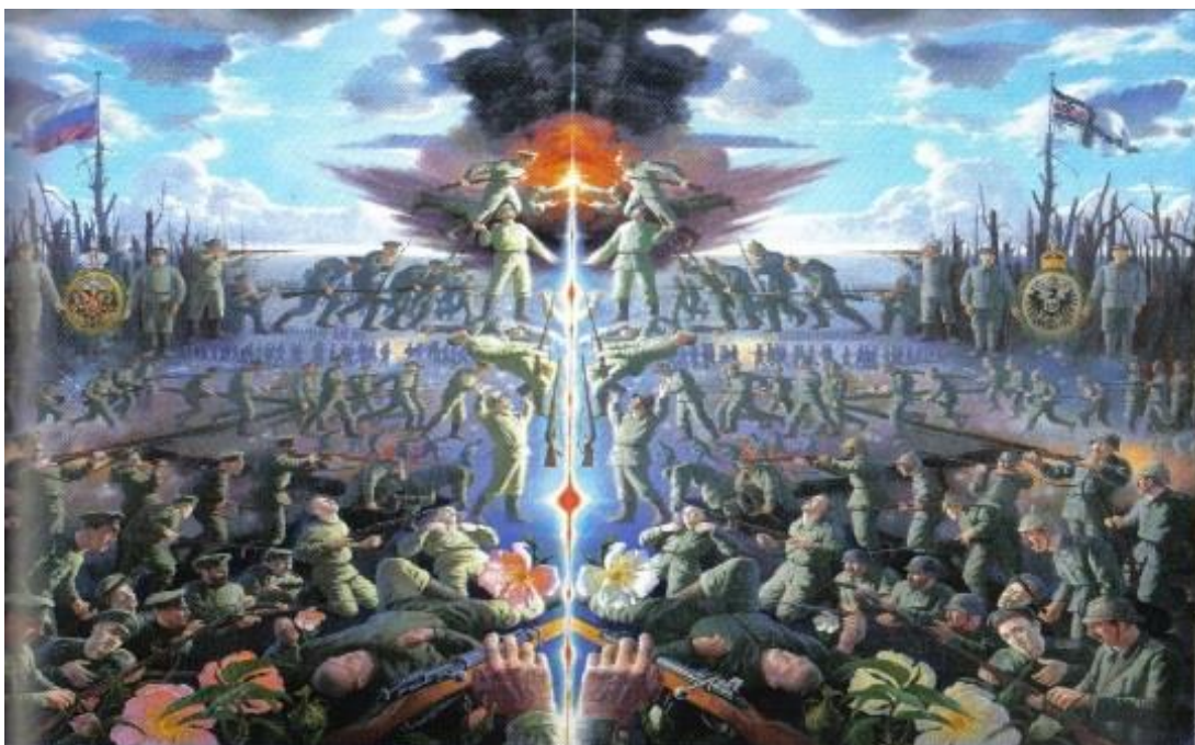
6.attēls – Uzbrukums (2007 – 2009)