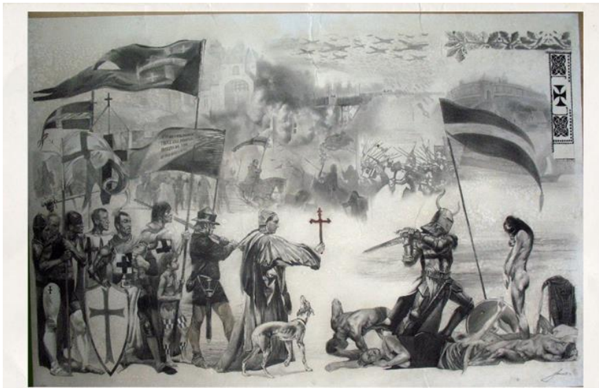
2. attēls – Kristietības ieviešana Latvijā (2014)