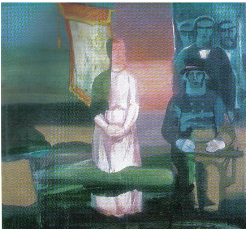
4. attēls - fragments no gleznas Pērkona gaisā (1979)