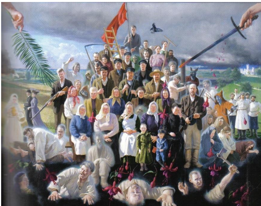
1. attēls – Revolūcijas piramīda (2006 – 2009)