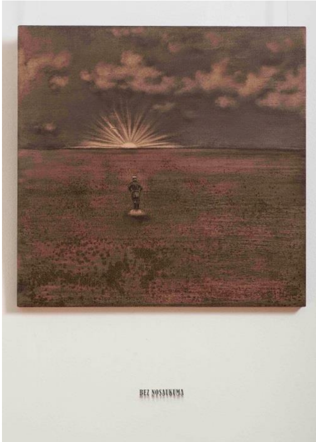
3. attēls – Bez nosaukuma (2014)