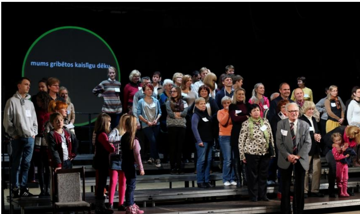
4. attēls. Mobile Academy Berlin projekts sadarbībā ar Latvijas Jaunā teātra institūtu „Noderīgu zināšanu un ne-zināšanu melnais tirgus nr. 16”. 99