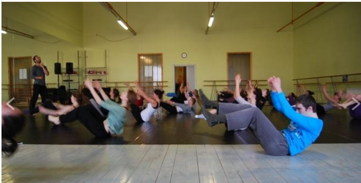
6.attēls. Dejas dienu ietvaros veidotā dejas izrāde, 2010.gads. 101