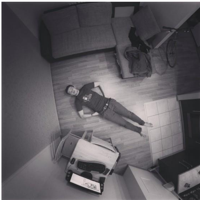
8. attēls. Rīgas Pašportretu foto darbnīca Āgenskalnā, kurā fotogrāfijas dalībniekie uzņēma savās dzīvesvietās. 103