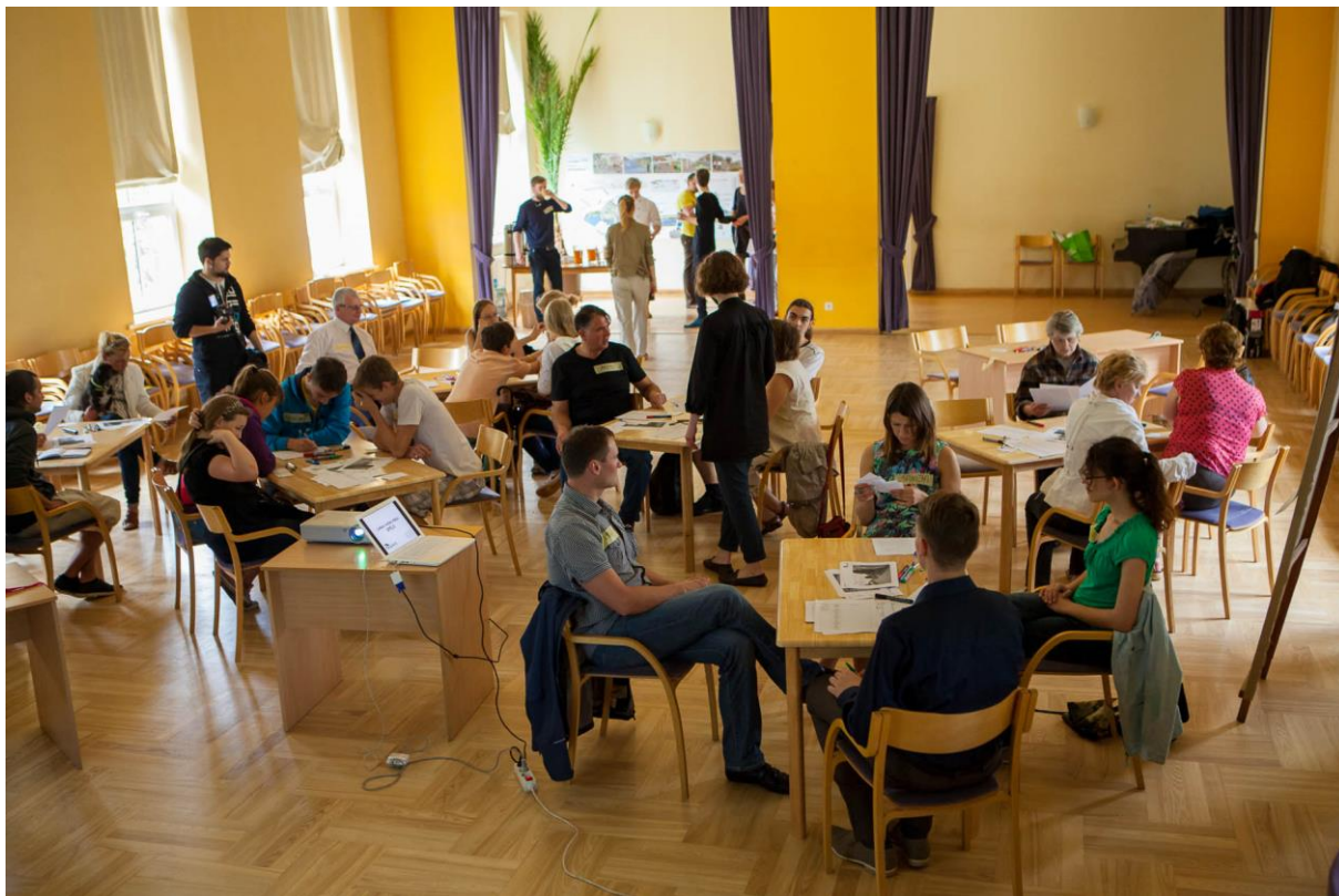
10. attēls. Labas vietas talka. Sarkandaugavas Alekša skvēra labiekārtošana. 105