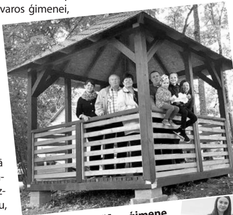
Miežānu ģimene jaunatklātajā atpūtas vietā Dunavas pagasta Sudrabkalna muižas dārzā.

Miežānu ģimene Duna- vas pagastā vēlējās iepazīstināt ar jaunatklāto atpūtas vietu Sudrabkalna muižas dārzā: „Šī vieta agrāk bij aizmirsta un ne- sakopta, bet pateicoties Sudrabkalna jauniešu entuziasmam un projekta „LMT Latvijai” līdzfinansējumam, ir tapusi vieta, kur var atpūties jebkurš Jēkabpils novada iedzīvotājs. Šī vieta mūsu ģimenei ir svarīga, jo tā ir tapusi mūsu mazajā ciematīnā ar pašu spēkiem, tajā var atpūties no pilsētas steigas, vai pa- vadīt omulīgus vakarus pie ugunsкура.”