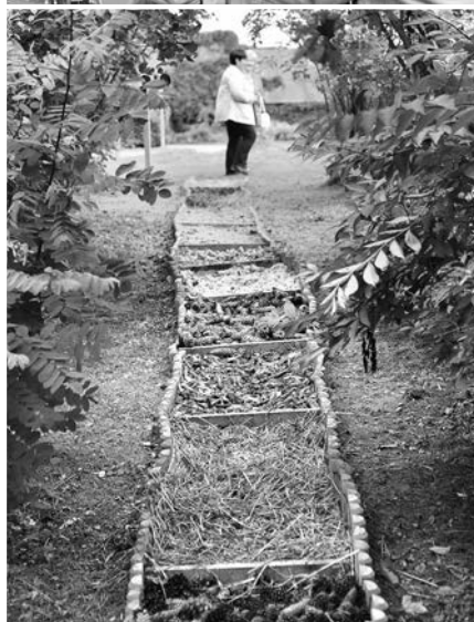
Baskāju taka „Cirkuži”.

Sestdien, 17. septembrī, Eiropas sporta nedēļas ietvaros, pie Dignājas pamatskolas tika atklāta aktīvās atpūtas taka. Iecerī izdevies īstenot, pateicoties „Latvijas Mobilā Telefona” (LMT) projektu konkursa „LMT Latvijai” un Jēkabpils novada pašvaldības piešķirtajam finansējumam.