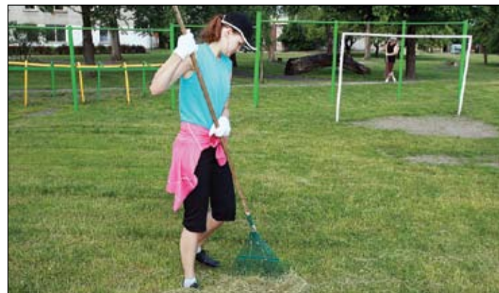
Audzēkņiem, kas pārnāktu uz mācībām 2. sanatorijas internātpamatskolā, ieguvums noteikti būtu mācību vide – gan telpas labākas, gan plašāka zaļā zona sporta un citām aktivitātēm.