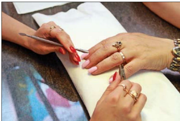
Paši meistari higiēnas prasības vērtē kā vajadzīgas. Arī citviet viņi pievērsot uzmanību tīrībai un instrumentu dezinficēšanai.

nevienu mata, jo tie rodas darba procesā. Ar fēnu žāvējot, ne viens vien līdinās pa gaisu...» novērojuši friziere ar stāžu.