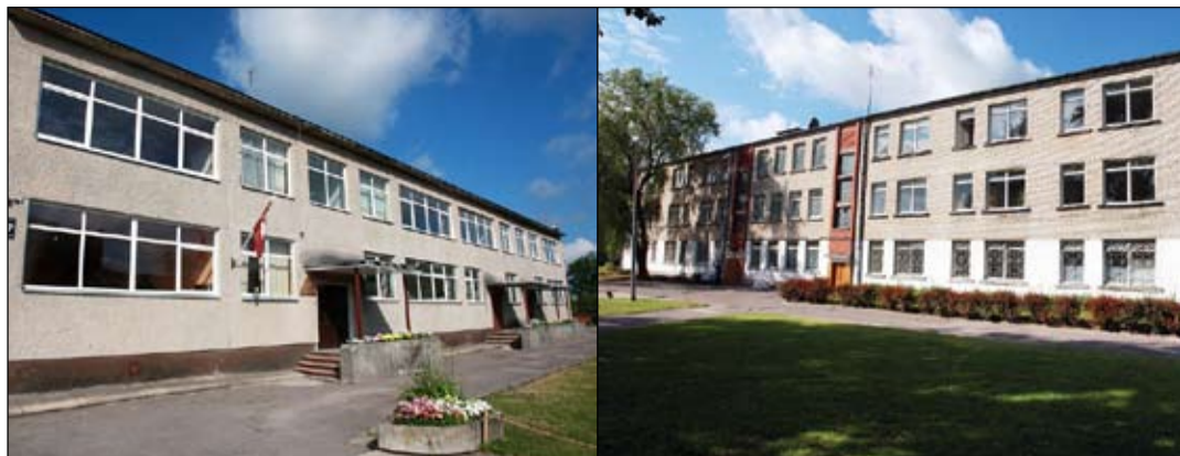
Iespējams, ka jau 2009. gadā 3. pamatskolas filiāle Pulkveža Brieža ielā kļūs par jaunu pirmsskolas izglītības iestādi pilsētā, bet bērni, kas līdz šim mācījās šeit, to turpinās darīt kā 2. sanatorijas internātpamatskolā, tā 3. pamatskolā Uzvaras ielā.