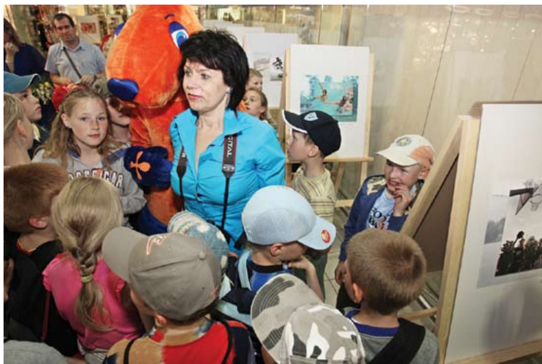
Izstādes atklāšanā piedalījās arī daudz bērnu, kas ar lielu interesi vēroja, kur tad viņi var pilsētā aktīvi atpūsties.

«Mēs visi ļoti gaidām, lai kāds cits par mums parūpējas,