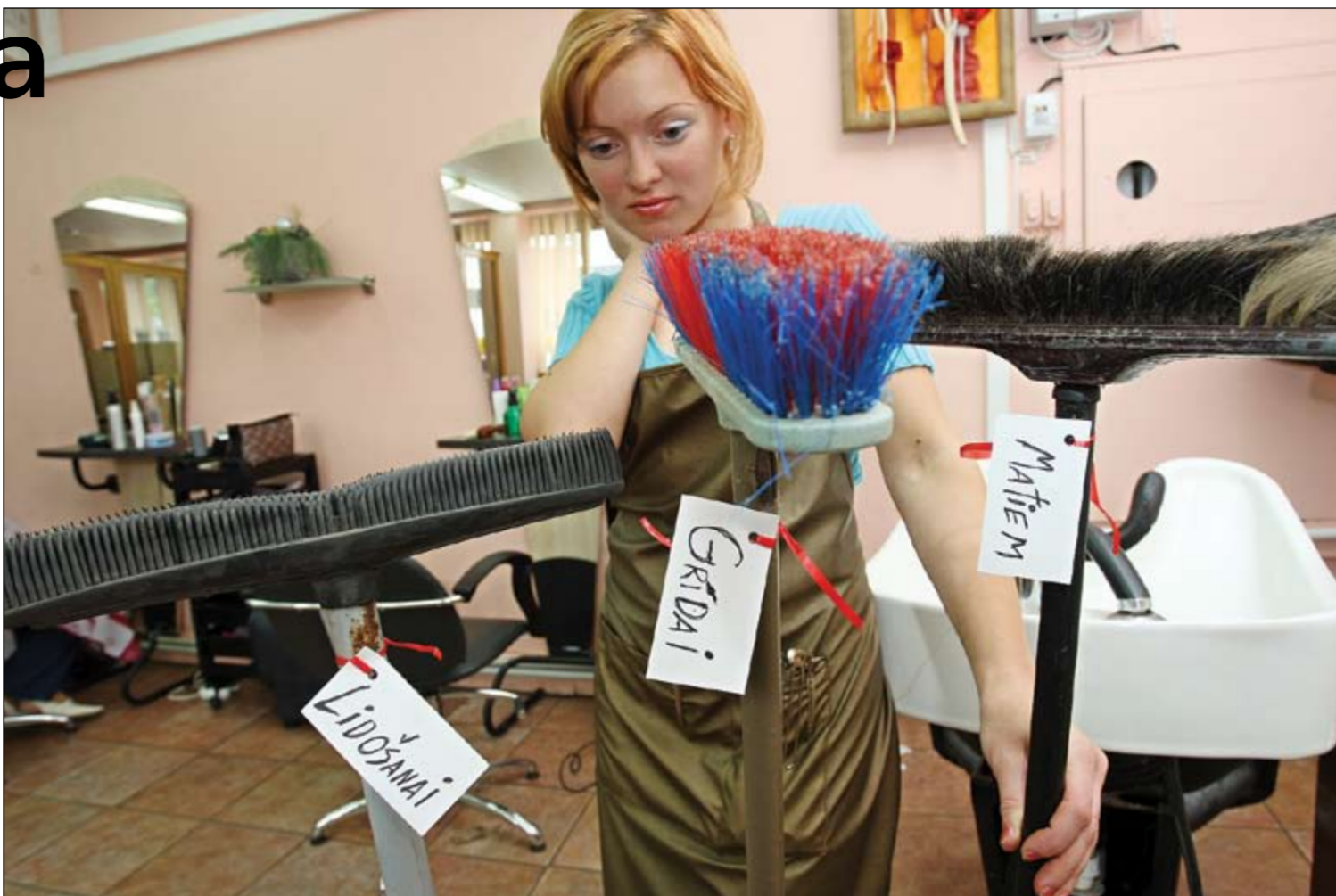
Ar matu savākšanai domāto slotu uzkopjot grīdu, tie iznēsātos pa visu telpu. Ikdienā humors meistārem netraucē marķēt slotu arī kā likuma autoru fantāzijas lidojumiem domāt.

Vasarā aktuāls ir centralizētās ūdens apgādes sistēmas un bērnu nometnes. Dzeramā ūdens nekaitīguma nodrošināšanas prasību izpildē publikajos dzeramā ūdens apgādes objektos pārbauda visu, sākot ar ūdens ņemšanas vietu un beidzot ar patērētāju, kā arī dokumentāciju par uzņēmumu veiktajām analizēm u.c., kā arī aizsargjoslas – vai tās ir ierobežotas un uzturētas, vai tajās aizliegts uz-