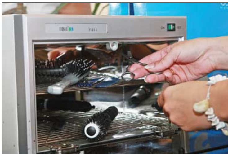
Salonos, kur domā par reputāciju, tostarp «Skaistuma servisā» ir piederumu sterilizatori.