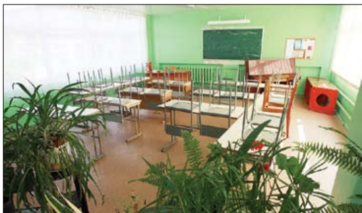
3. pamatskolas filiāle Pulkveža Brieža ielā jau pēc projekta celta kā bērnu dārzs, tāpēc tās pārveide par pirmsskolas izglītības iestādi nebūs sarežģīta.