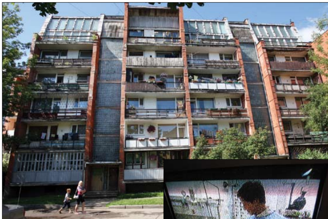
Pasta ielā 57 tā ir ikdiens – ja kādu brīdi «bilde» televizora ekrānā ir puslīdz skaidra, tad jau pēc pāris dienām to atkal nomāc «migla», šņākoņa, iemīļoto raidījumu skatīšanās prieka vietā sagādājot vien galvassāpes.