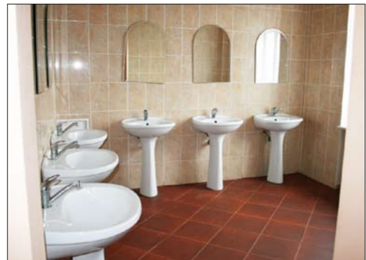
Salīdzinot ar kādreizējo, situācija LLU dienesta viesnīcā koplietošanas telpās jūtami uzlabojas. Katru gadu kaut kas tiek paveikts, bet darāmā vēl netrūkst.

Inspekcijas pārraudzībā ir arī pirtis pie viesu namiem un publiskās pirtis. Tajās tvaika un karstuma del krāsojums jāatjauno samērā bieži, kas ne vienmēr notiek. Reizēm kāds interesējas par pirti, kas pie publiskās kategorijas nepieder. Pie personīgajām mājām izvietotās pirtis inspektori isti pārbaudīt nevar, jo saimnieki parasti uzsvēr, ka tā ir viņa personīgā pirts, uz kuru brauc atpūsties draugi, lai gan faktiski to regulāri izmanto papildus ienākumu gūšanai. «Šādā situācijā meko nevaram darīt. Vienīgi izteikt priekšlikumus savai vadībai, kas arī tiek darīts, par