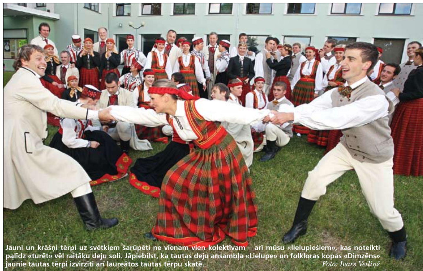
Jauni un krāšņi tērpi uz svētkiem sarūpēti ne vienam vien kolektīvam – arī mūsu «lielupiešiem», kas noteikti palīdz «turēt» vēl raitāku deju soli. Jāpiebilst, ka tautas deju ansambļa «Lielupe» un folkloras kopas «Dimžens» jaunie tautas tērpi izvirzīti arī laureātos tautas tērpu skatē.