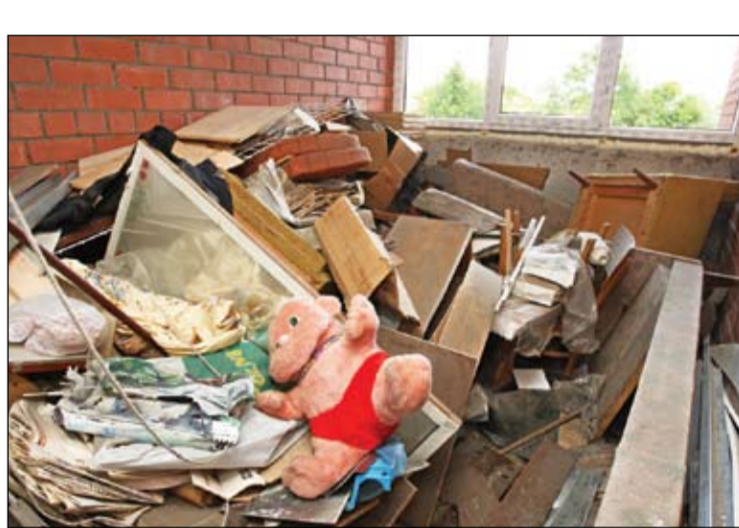
Iedzīvotāji Veselības inspekcijai sūdzas arī par nekārtībām dzīvojamā namu pagrabos, koplietošanas telpās un pagalmos.

neatbilstību drošuma prasībām. Kopumā no 15 pamatotās izraudzītās septiņas sūdzības, nepamatotās – trīs, bet pārdējas nav atbildušas darba profilam.