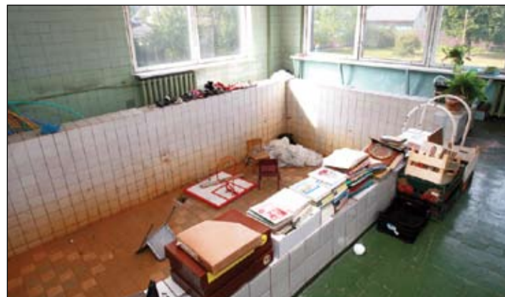
3. pamatskolas filiāles ēkā ir arī baseins. Lai gan morāli novecojis, tomēr atjaunojams – tas būtu papildus ieguvums bērnu dārza audzēkņiem.