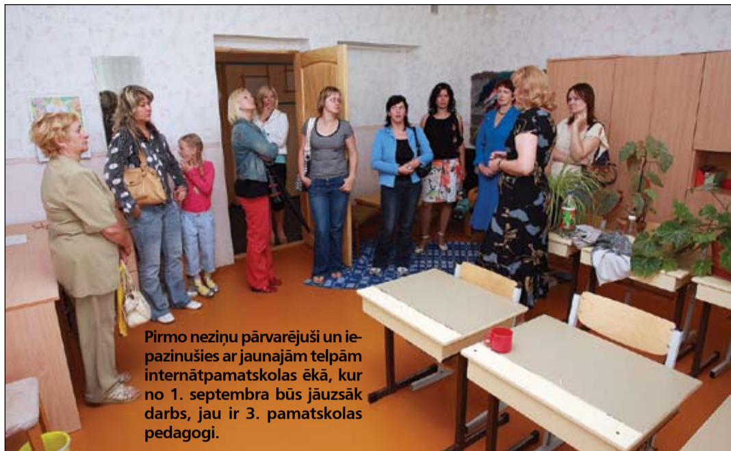
Pirmo neziņu pārvarējuši un iepazīlušies ar jaunajām telpām internātpamatskolas ēkā, kur no 1. septembra būs jāuzsāk darbs, jau ir 3. pamatskolas pedagogi.

Jāpiebilst, ka 3. pamatskolas korekcijas klases un pirmsskolas vecuma grupas uz internātpamatskolu nāktu kopā ar saviem skolotājiem – tā kā arī bērniem jauna būtu tikai izglītības vide,