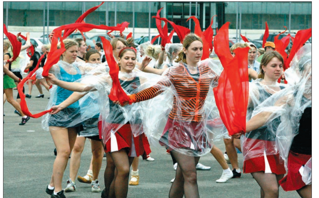
Tautas deju kolektīviem mēģinājums ilgst visu dienu, bet vakarā seko uzstāšanās skatītāju priekšā. Nogurums esot liels, bet Jelgavas dejojāji tik un tā esot laimīgi.