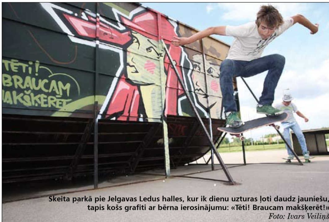
Skeita parkā pie Jelgavas Ledus halles, kur ik dienu uzturas ļoti daudz jauniešu, tapis košs grafiti ar bērna ierosinājumu: «Tēti! Braucam makškerēt!»

Viņa stāsta, ka šī projekta galvenais mērķis bijis divarpus mēnešu laikā izgatavot 26 informatīvus plakātus un 26 grafiti zīmējumus par tēmu «Attiecības: