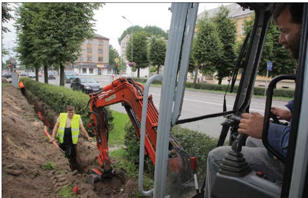
Vakar ar tranšēju rakšanu kabeliem sākās apgaismojuma rekonstrukcijas darbi Lielaajā ielā. Tās laikā pilnībā tiks nomainīta ielu apgaismojuma armatūra, tostarp kvēlspuldžu vietā par gaismu gādās ekonomiskās nātrija spuldzes.