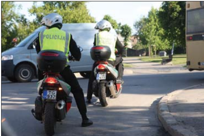
Mēneša laikā, kopš Pašvaldības policijas rīcībā ir arī četri skūteri, tie apstiprinājuši savas priekšrocības – gan ar skūteriem ērtāk piedalīties intensīvajā satiksmē, gan tie ir ekonomiskāki: uz 100 kilometriem patērē apmēram trīs četrus litrus degvielas, un vidēji tieši tik tiek arī nobraukti vienā maiņā.