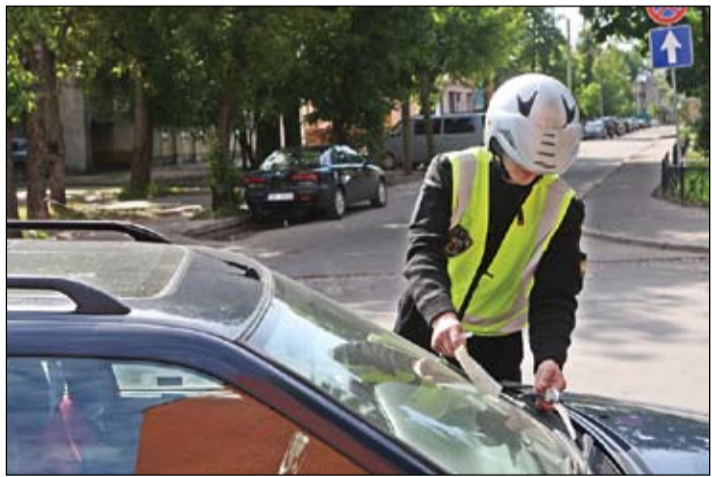
«Pēc Administratīvā pārkāpumu kodeksa – 149. 10 pants, 5. daļa, 7. punkts, pēc ceļu satiksmes noteikumiem – 135.6. punkts,» nešaubīgi zina inspektori, rakstot protokolu par automašīnas novietošanu brauktuvi krustojšanās vietā. Šoreiz – Dambja ielā.