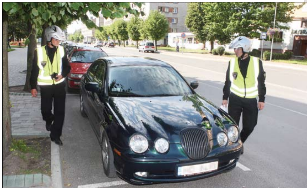
Agrāk Jelgavas Pašvaldības policijas satiksmes uzraudzības inspektori ik dienas fiksēja ap 50 pārkāpēju, tagad to skaits sarucis līdz 10, 15.

Kopš Pašvaldības policijas autoparku papildinājuši četri skūteri, aprītijs mazliet vairāk nekā mēnesis. Divi šie transportlīdzekļi atstāti iecirkņu inspektoru ziņā, savukārt ar otriem diviem pārvietojas satiksmes uzraudzības inspektori, gādājot, lai aizvien mazāk ir tādu autovadītāju, kas pilsētā