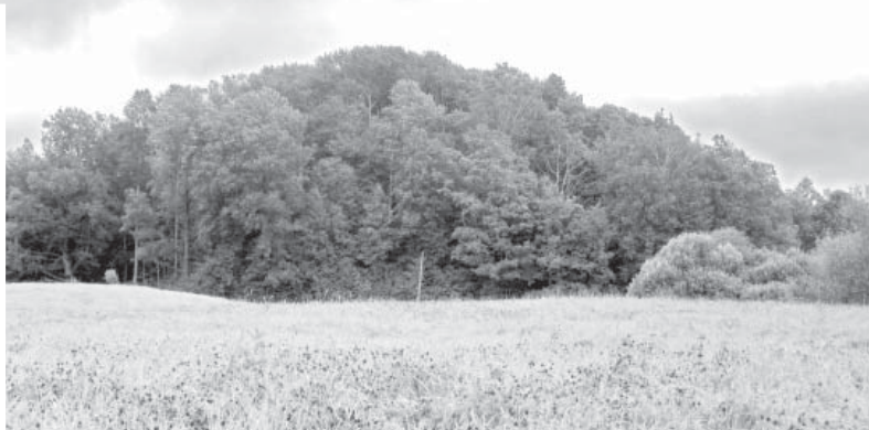
Maz zināmais Elkšņu pilskalns kopš 1921. g. atrodas Lietuvas teritorijā.

pagastos, sapratām, ka tie ir unikāla vērtība, kas šobrīd maz zināma plašākai sabiedrībai.