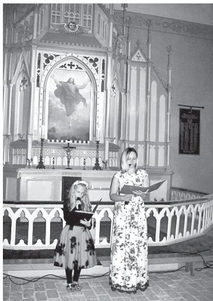
Iekārta jau veiksmīgi izmantota Baznīcu nakts pasākumā Sunākstes Baltajā baznīcā šī gada 10. jūnijā.

Viesītes evaņģēliski luteriskā draudze iesniedza projekta pieteikumu Viesītes novada domes izsludinātajā vietējo projektu