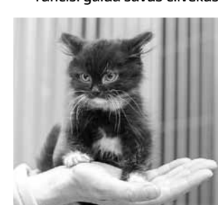
Arī divus mēnešus vecais kaķu puisis grib nonākt labās mājās.

Katrina Spuleniece-Aišpūre Jēkaba Aleksandra Krūmiņa foto