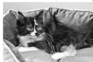
Garspalcinājai trīskrāsu kaķēnītei ir divi mēneši.