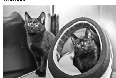
Melnajiem brālīšiem jau ir četri mēneši.