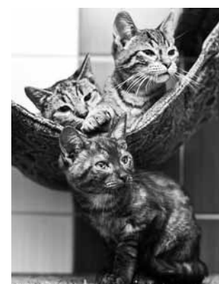
Trīs strīpaini četrus mēnešus veci runcīši gaida savus cilvēkus.