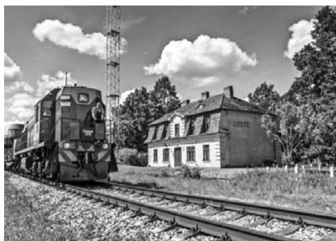
No ievērojamākajiem objektiem mūsupusē ir bijusī Airītes dzelzceļa stacija, kurā pēdējais vilciens pieturējās 1993. gadā.

Visus objektus var apskatīt tūrisma kartē www.industrialheritage.travel/lv/map.