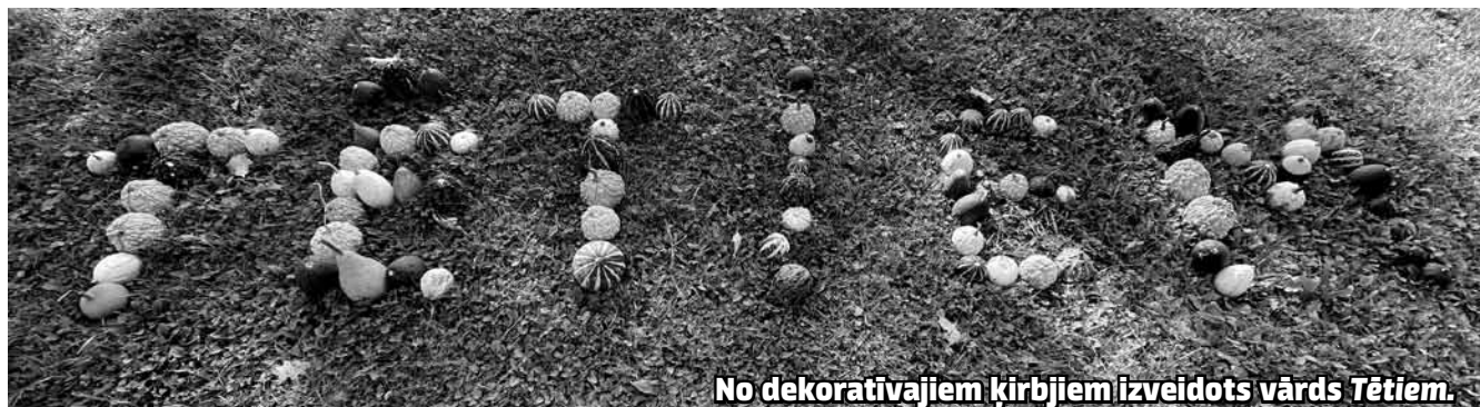
No dekoratīvajiem ķirbjiem izveidots vārds TĒTIEM.