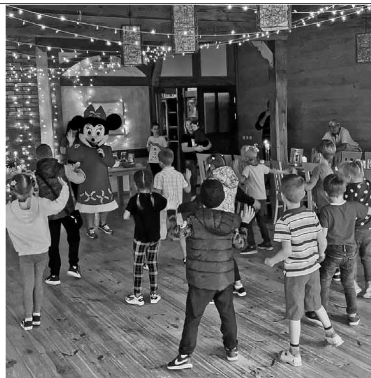
Audzūģimeņu un aizbildņu ģimeņu pasākumā Kuldīgas jauniešu biedrības Sprādziens nodarbes pašiem mazākajiem – jautras dejas ar Mikipeli Minniju.