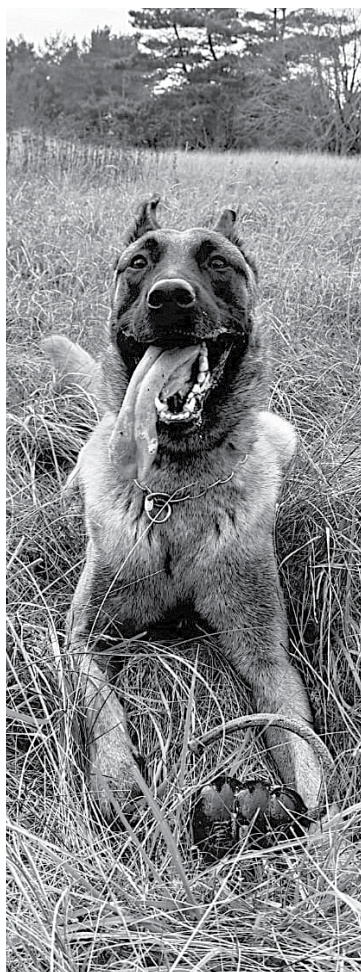
Pēc labi padarīta darba nav nekā labāka par rotaļu ar bumbiņu.

– Kad iestājas kinologos, piecas nedēļas jāmācās teorija, lai saprastu, kur tu esi nācis un kas būs jādara. Jāzina pirmā palīdzība sunim: ko darīt, ja gūst traumas,