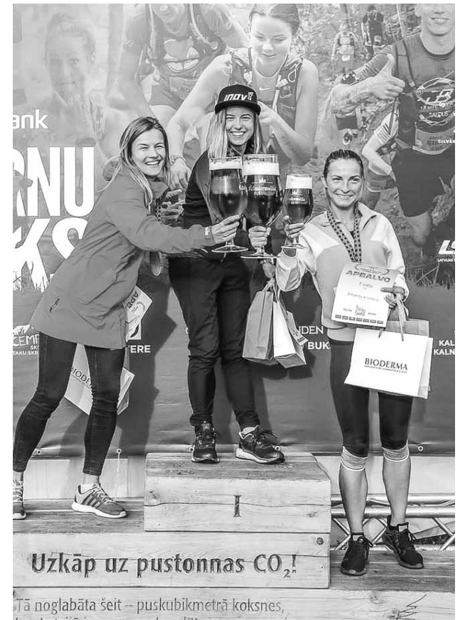
Sacensības Stirnu buks. Lūšu trasē – trešā vieta.