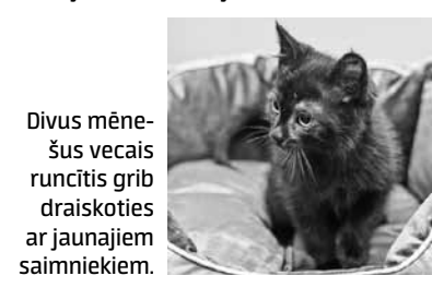
Divus mēne- šus vecais runcītis grib draiskoties ar jaunajiem saimniekiem.