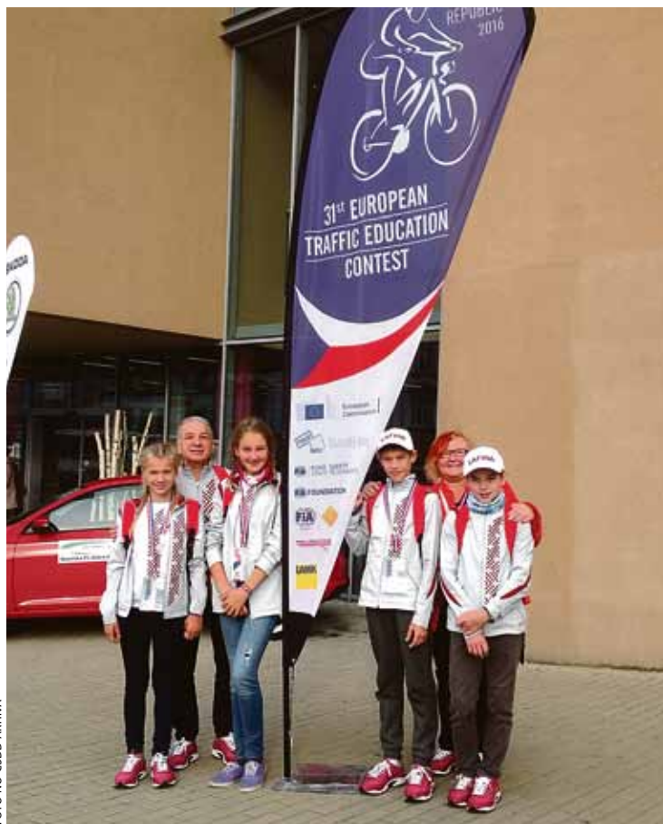
Latvijas jauno velosipēdistu izlase.

Jaunieši šovasar sasniedza visaugstākos rezultātus CSDD jauno velosipēdistu Latvijas sacensībās „Jauno satiksmes dalībnieku forums”. Līdzīgi kā jauno satiksmes dalībnieku forumā, arī starptautiskajās sacensībās galvenais uzsvārs bija likts uz divām lietām – kopīgu komandas darbu un satiksmes drošības teorētisko