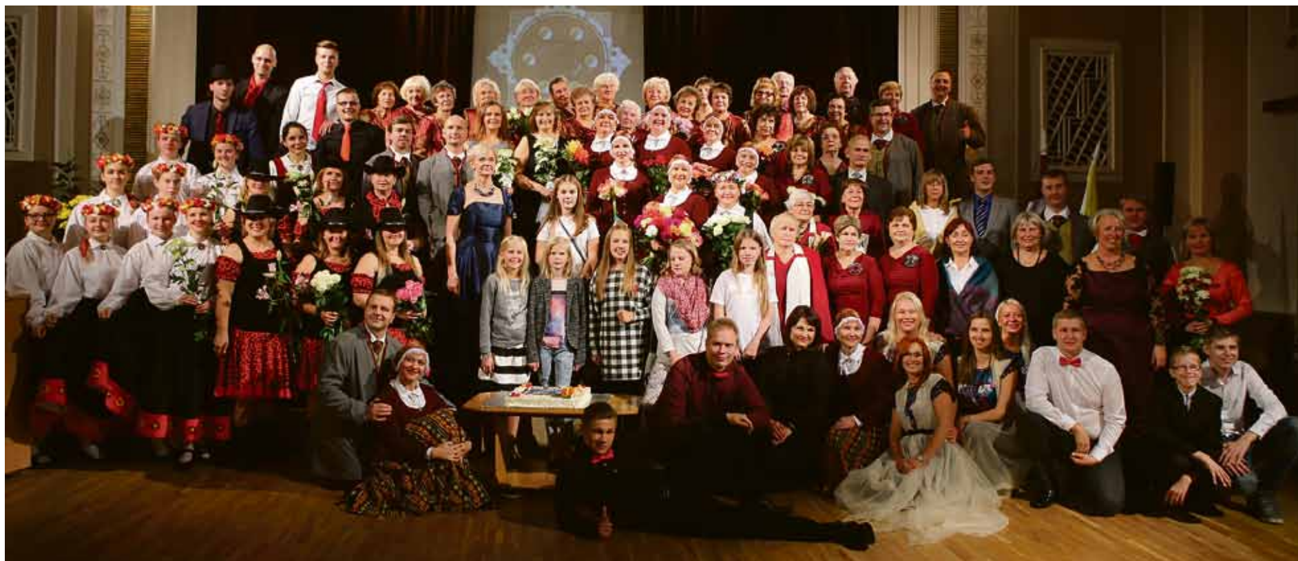
Baložu kultūras nama lielā saime jubilejas pasākumā.

Siltajā sestdienas, 24. septembra, pēcpusdienā Baložu kultūras nams pulcēja daudz skatītāju, amatiermākslas kolektīvu dalībnieku, apsveicēju un viesu, lai koncertā „Laika upe” svinētu Baložu pilsētas kultūras nama atklāšanas 55 gadus.