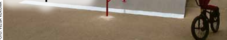
Jaunais skeitparks Ķekavā.

21. septembrī par velo draudzīgas infrastruktūras izveidi un velo kultūras veicināšanu tiks apbalvoti 40 konkursa „Draudzīgs velosipēdistam” laureāti. Kategorijā „Velo satiksmi un velo kultūru veicinoša organizācija” atzinību ieguva Ķekavas novada pašvaldības sporta aģentūra par nesen atklāto BMX un skeitborda parku.