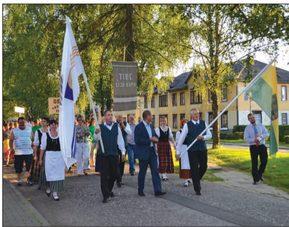
Sedas pilsētas 25 gadu jubilejas svētku gājiens