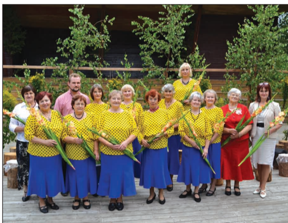
Deju kopa "Madaras" novada svētkos