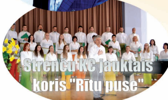
Strenču KC jauktais koris "Rītu puse"