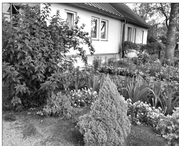
Dārza iela 9, Seda

Šogad par sakoptākajām vietām Strenču novadā komisija atzina šādu ģimeņu īpašumus: