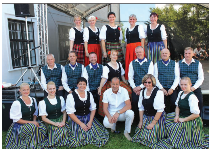
Strenču novada delegācijas pārstāvji un deju kopa “Tīne” Rosicē

Marta sākumā Strenču novada dome saņēma oficiālu ielūgumu viesoties sadraudzības pilsētā Rosicē, Čehijā. Laikā no 24.augusta līdz 28.augustam Strenču novada pašvaldības pārstāvji viesojās Rosicē un vizītes laikā piedalījās svētkos “Bruņinieku parāde – cīņa par meiteņu un dāmu sirdīm”. Rosicē šie svētki notika jau 25. reizi un tos apmeklēja arī Rimocas (Ungārijas) pašvaldības delegācija, ar kuriem Strenču novads pilsētu sadraudzības līgumu noslēdza 2013.gadā. Svinībās pašvaldību pārstāvji uzrunāja klātesošos, kā arī, apmainījās apsveikumiem un dāvanām. Svētkos uzstājās Strenču novada kultūras centra vidējās paaudzes kolektīvs “Tīne”, viesi no Ungārijas, Čehu bruņinieku biedrība “Taranis” un citas vietējo mūziķu grupas.