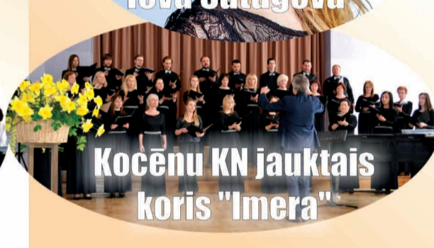
Kocēnu KN jauktais koris "Imera"