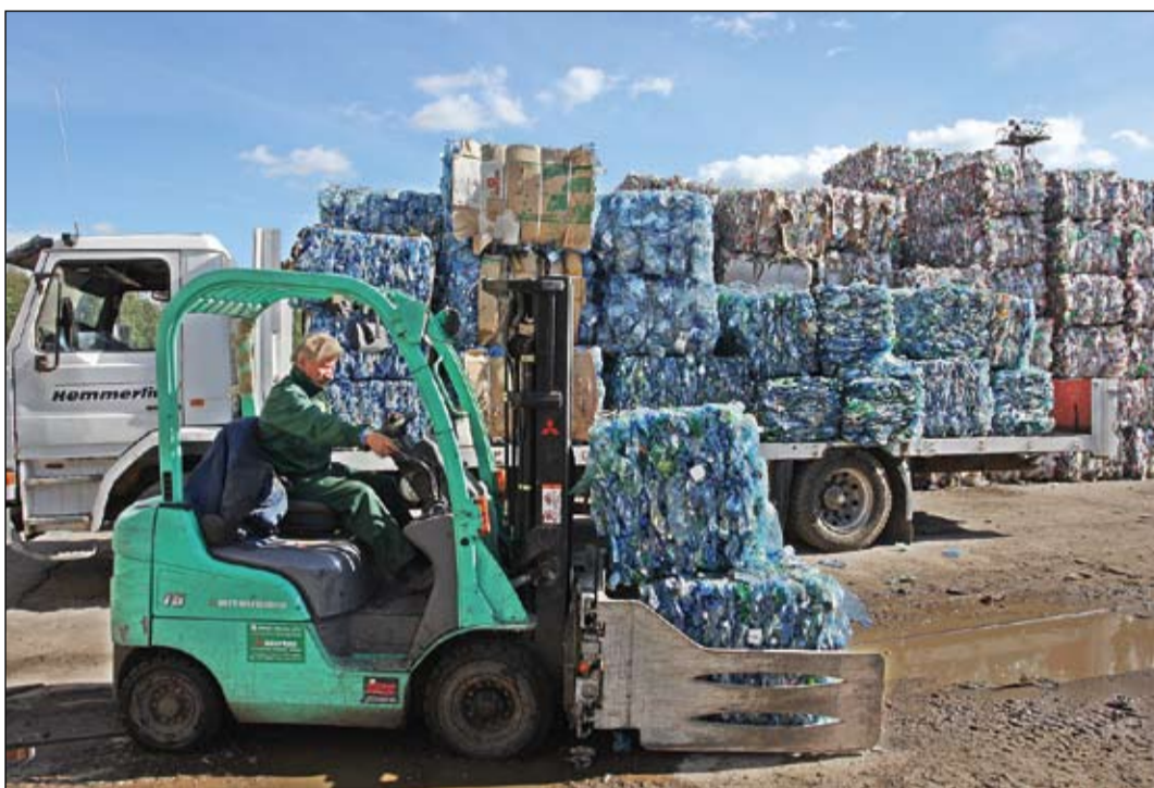
Uzņēmums «PET Baltija», testa režīmā strādājot, jau pārbaudījis tehnoloģiskās līnijas darbību – gūta pārliecība, ka visas «bērnu» slimības izslimotas un nepilnības novērsta, lai PET pudeles varētu pārstrādāt pārslās.