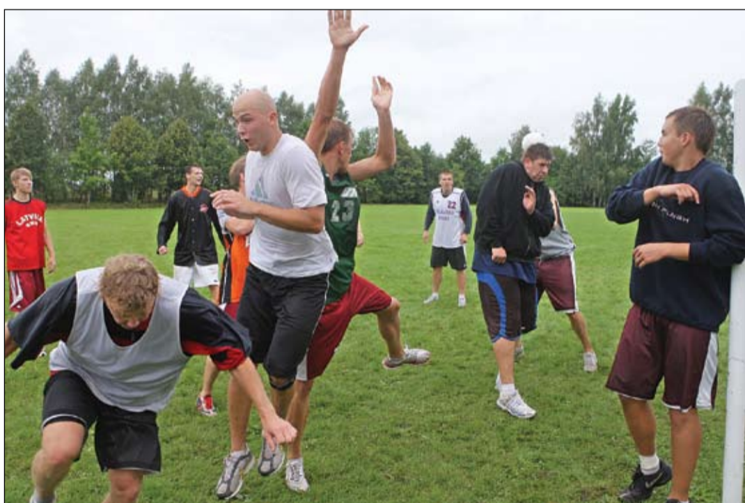
11. augustā visa komanda devās uz Kandavu, kur divas nedēļas tika aizvadītas treniņnometnē. Nu gatavošanās jaunajai sezonai turpināsies tikai Jelgavā.

veni 800 sēdvietu, līdz ar to, ieskaitot stāvvietas, spēles varēs vērot apmēram deviņi simti līdzjutēju. Tas gan būs pagaidu risinājums, jo jau nākamā gada septembrī plānotam ekspluatācijā nodot jauno Zemgales Olimpiskā centra zāli, tādējādi visas lielās spēles varēs vērot jau vairāk nekā divi tūkstoši līdzjutēju,» piebilst J.Kaminskis.