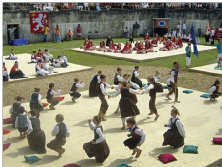
Mazākie šogad pabijuši Šveicē, nākamajā gadā jau ielānāts brauciens uz Eiropiādi Viļņā un arī kāds tālāks ceļojums.

«Pēc vasaras piedzīvojumiem domāju, ko īpašu «Vēja zirdziņš» varētu sagādāt šajā gadā, jo Dziesmu un deju svētki aizvadīti, arī lielas jubilejas kolektīvam nav. Tad nu saklausījām to, kas skan visā Latvijā – Latvijas 90. dzimšanas diena –, tāpēc nolēmām, ka šī sezona kolektīvam izskatīsies ar devīzi «Vēja zirdziņš»