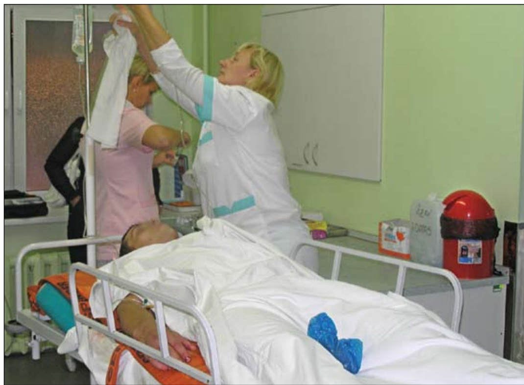
Ar «ātrajiem» Jelgavas pilsētas slimnīcas Uzņemšanas nodaļā nogādāts kāds vīrietis ar grieztu brūci padusē. Pacients – pamatīgā alkohola reibumā. Ārstiem nav ne jausmas, kur brūce iegūta, taču komanda nostrādā operatīvi: kaut pacients zaudējis daudz asiņu, dzīvībai briesmas nedraud.