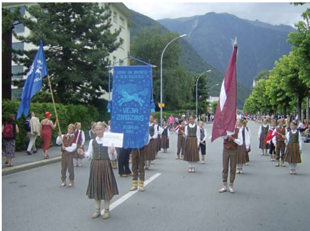
Jauno, daudz lielāko un vairāk zvaigznītēm rotāto karogu «Vēja zirdziņš» pirmo reizi izrādīja Dziesmu un deju svētkos, nu tas pabijis arī Šveicē, bet kolektīva himna pie tā dziedāta tikai pagājušajā nedēļā.