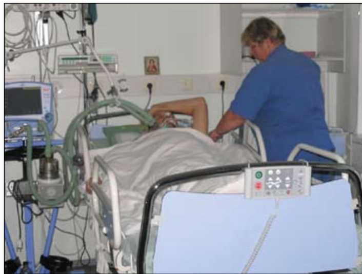
Ārsti atzīst, ka Reanimācijas nodaļā pacientu novērošanas monitori ir vieni no labākajiem Latvijā, gultas – tādu nav pat dažā labā angļu klīnikā. Arī pārējais aprīkojums ir teju modernāks ne tikai reģionālo, bet pat valsts mēroga slimnīcu vidū.