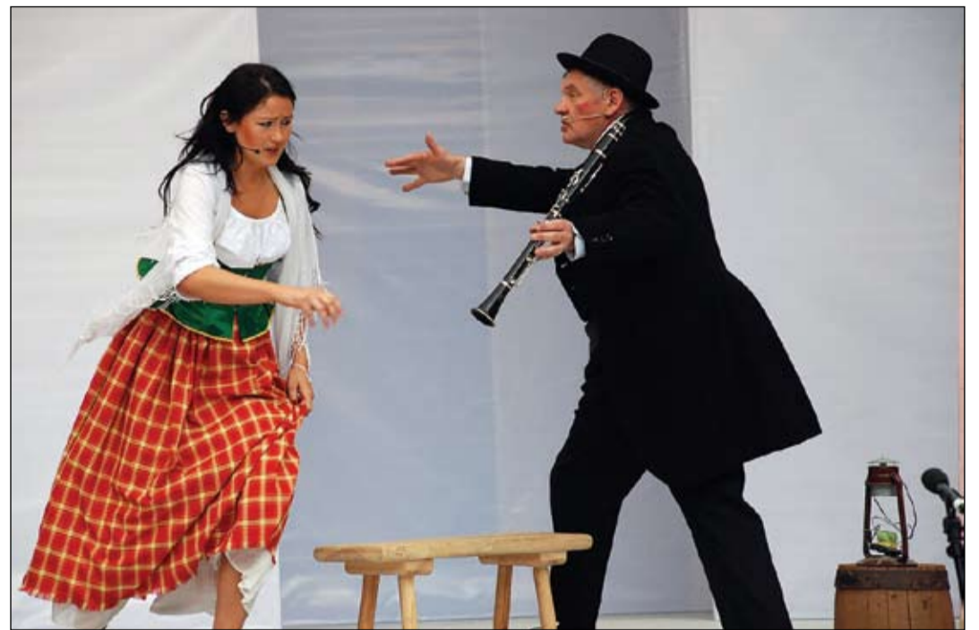
Jelgavas Ādolfa Alunāna teātra aktieri teātra tēva 160 gadu dzimšanas dienu ieskandinās ar Alunāna pirmo opereti «Mucenieks un Muceniece» Rīgas Latviešu biedrības namā, taču Jelgavā teātrinieki rādīs koncertuzvedumu «Sauciet veco Ādolfu!».