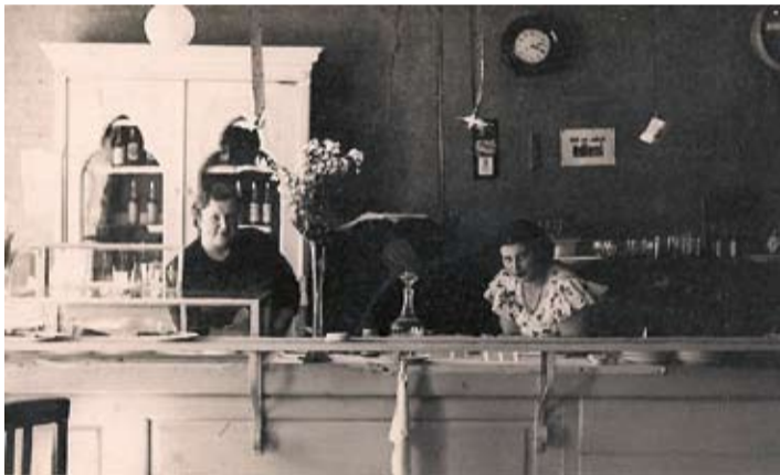
Omulīgas un smaidošas savus klientus kafējnicā gaida pārdevējas. Uzmanīgi ielūkojoties, var pamanīt, ka arī 1940. gadā tiek izmantots mūsu ķeramais papīrs!

P.S. Varbūt arī jūsu ģimenes albumā saglabājušās interesantas vēstures liecības par Jelgavu un jūs esat gatavi tajās dalīties?! Fotogrāfijas, īpaši par laika posmu no 1940. gada, gaidīsim redakcijā Svētes ielā 33, 211. kabinetā, tālrunis 63048801, vai aicinām tās iesūtīt pa e-pastu: redakcija@zi.jelgava.lv.