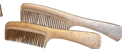
Četrdesmitajos gados šādas ķemmes izgatavoja kāds Siera muižas nometnē ieslodzītais.

Vēl trīsdesmito gadu beigās tieši šādi Polijā ražoti svāri bija plaši izmantoti. Protams, ne līdz gramiem precīzi, bet lielāku smagumu svēršanai visai parocīgi. Skaidrības labad jāpiebilst, ka pēc līdzīga principa veidoti svāri tika izmantoti pat līdz 80. gadiem.