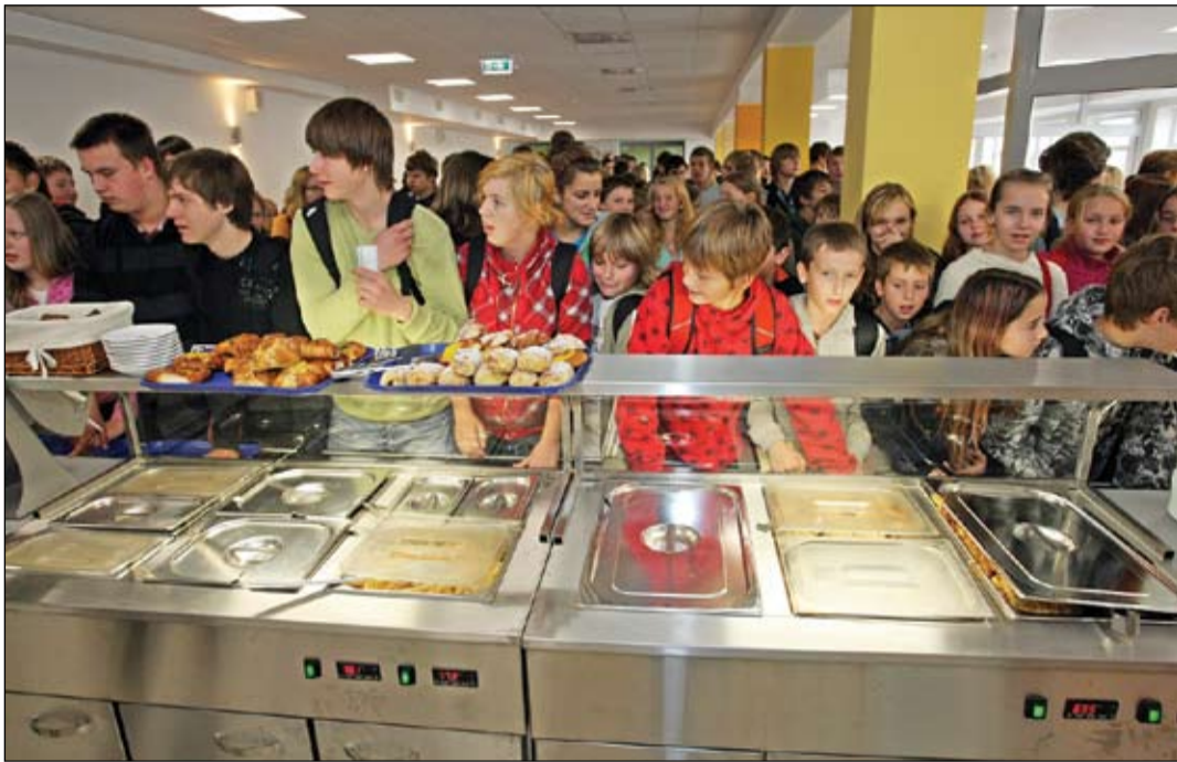
Darbu sācis 4. vidusskolas jaunais modernais ēdināšanas komplekss, kur jau no šīs nedēļas bērnu nodrošina ar siltām pusdienām. Reizē ar ēdnīcu izremontētas arī garderobes, mazā sporta halle un tās palīgtelpas, izbūvēts siltummezgls un divi meiteņu mājturības kabineti.