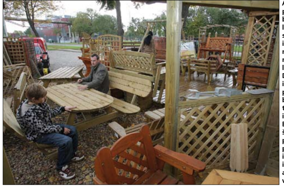
Ar dārza precēm un bērnu rotaļlaukumiem saistīto koka izstrādājumu tirdzniecības laukums Dobeles ielā prasās pēc uzlabošanas, tomēr ideja interesanta. Būtišķi, ka šeit piedāvātu pašu ražoto produkciju, iespējams iegādāties arī sagataves.

rency isti nedarbojas. Varbūt vajoktas izmaiņas tirdzniecības struktūrā, mazajiem veikalniem pirms lielveikalu ienākšanas tiesām bija savas tradīcijas un citādāka pieeja pircējam. Lielie «iziet» uz apgrozījumu, uz tā rēķina kaut kam cenu var atļauties samazināt, kaut kam palielināt, bet visam pa vidu prātā paturot savu peļņu.