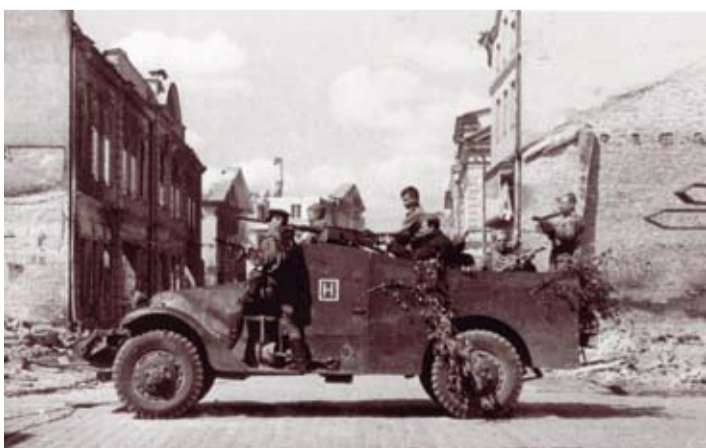
Šādi 1944. gadā Jelgavas ielās jeb kauju laikā pārvietojās sarkanarmieši.