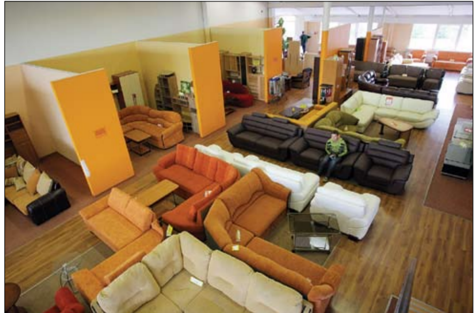
Veikalā «MNL» veikas izmaiņas preču sortimentā, izveidojot pievilcīgu, no citiem atšķirīgu mēbeļu sortimentu.

rency isti nedarbojas. Varbūt vajoktas izmaiņas tirdzniecības struktūrā, mazajiem veikalniem pirms lielveikalu ienākšanas tiesām bija savas tradīcijas un citādāka pieeja pircējam. Lielie «iziet» uz apgrozījumu, uz tā rēķina kaut kam cenu var atļauties samazināt, kaut kam palielināt, bet visam pa vidu prātā paturot savu peļņu.