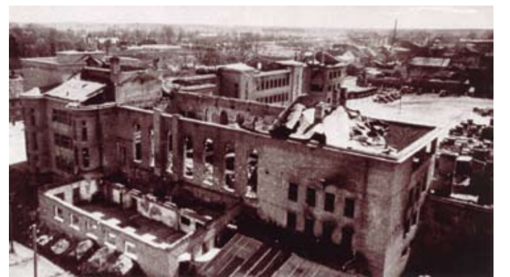
Kara laikā Jelgava tika nopostīta un nodedzināta. No 80 procentiem ēku pāri palikušas bija tikai drupas. Šāds skats 1945. gadā pavērs no ūdensvada torņa uz tagadējo Jelgavas Valsts ģimnāzijas ēku.