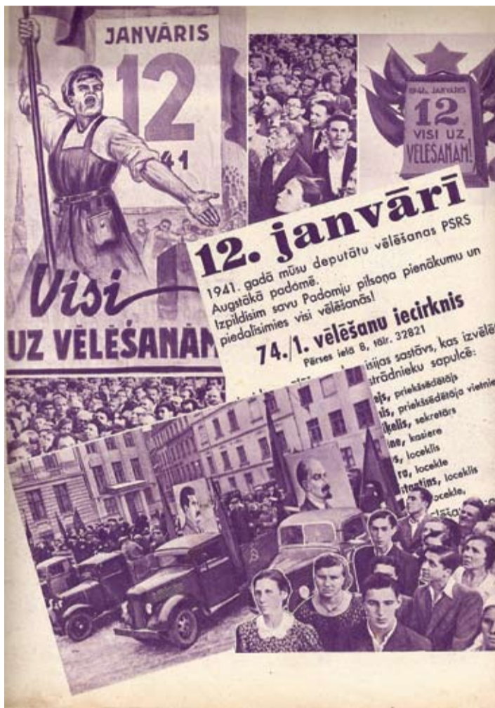
Pirmās padomju varas vēlēšanas, kurās piedalījās, protams, ir obligāta, taču, neraugoties uz to, agitācijas kampaņa izvērstā visai plaša.