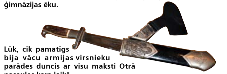
Lūk, cik pamatīgs bija vācu armijas virsnieku parādes duncis ar visu maksti Otrā pasaules kara laikā.