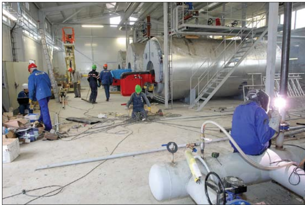
Pirmdien jaunās katlumājas būvnieki no uzņēmuma «Filter» veica pēdējos priekšdarbus un iekārtu pārbaudi, lai otrdienas pēcpusdienā jaunais siltuma avots sāktu ražot siltumu un karsto ūdeni Pārlielupes patērētājiem.