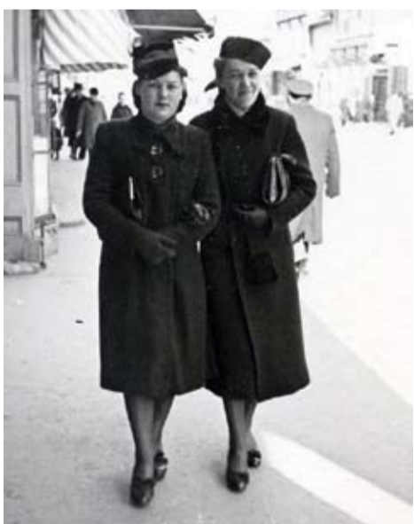
Vēl pēdējie skati no Jelgavas ielām – pilsētnieču mierīgas pastaigas 1940. gadā.