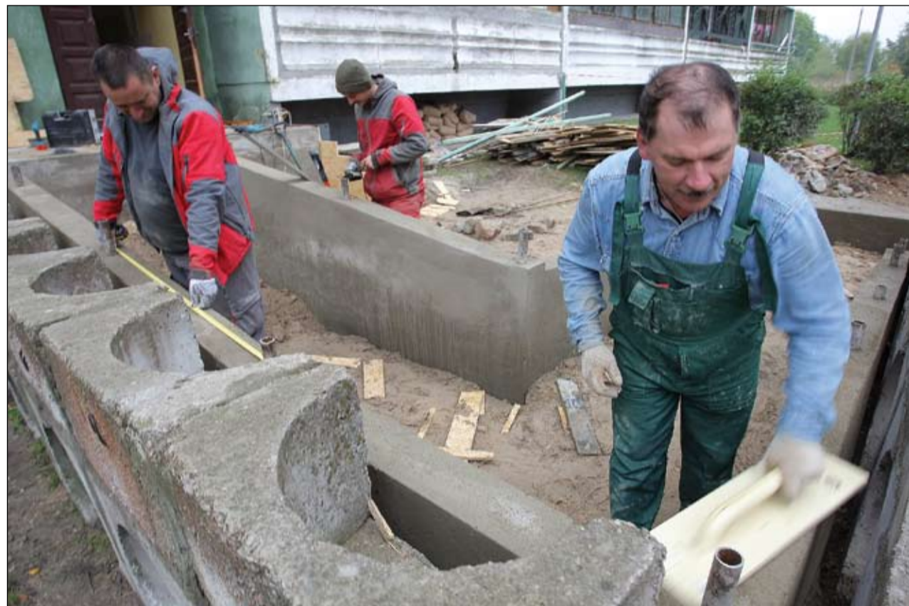
Atmodas ielā 98 pandusu izbūvē SIA «ZKK būve». Tā kopējās izmaksas ir 5720 latu, ko pilnībā finansē pašvaldība.