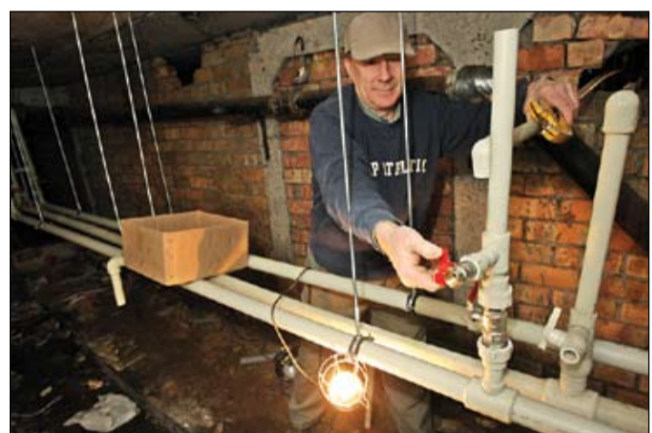
Pieslēdzot daudzdzīvokļu mājas apkurei, samērā bieži gadās problēmas. Šonedēļ, palaizot siltumu pirmajos sešos namos, apsaimniekotāja pārstāvjiem no Nekustamā īpašuma pārvaldes nebija būtisku problēmu, ko novērst.