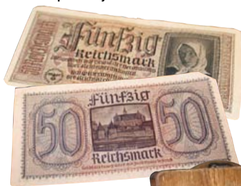
1940. un 1941. gadā jelgavnieki norēķinājās ar Padomju Sociālistisko Republiku Savienības rubļiem, bet jau no 1941. līdz 1945. gadam apgrozībā bija vācu okupācijas markas.