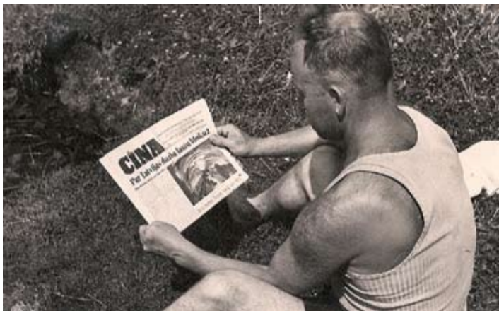
Jauni laiki, citas avīzes – 1941. gadā pēc padomju okupācijas.