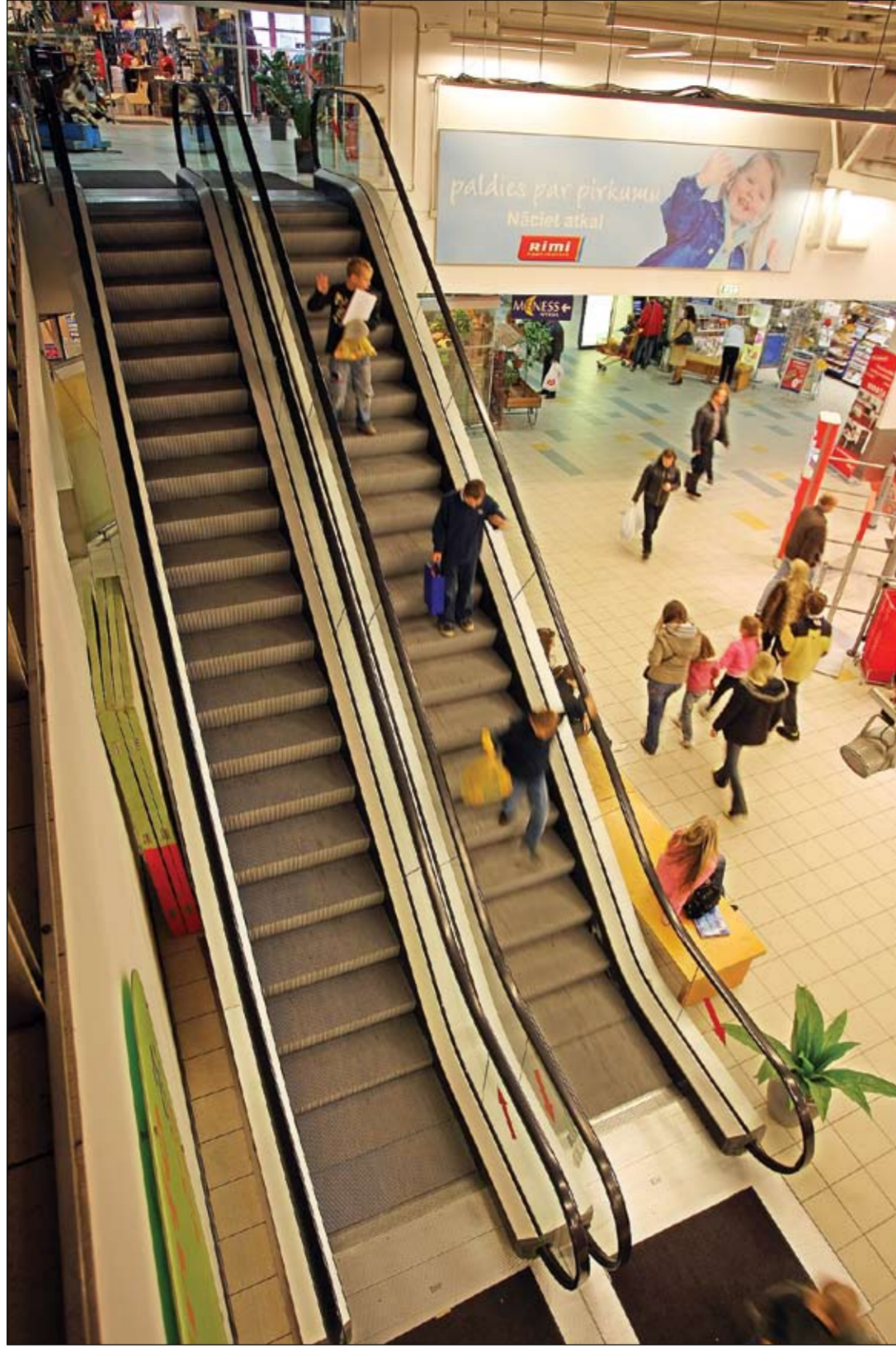
«Vivo centrs» pārdevēji nekad nevar būt droši, ka kāds no apmeklētājiem nepedier pie tā sauktajiem kontrolpircējiem, kas centra uzdevumā pārbauda pārdevēju apkalpošanas līmeni.

Sporta un atpūtas centri Uzvarētājs «Fitland»