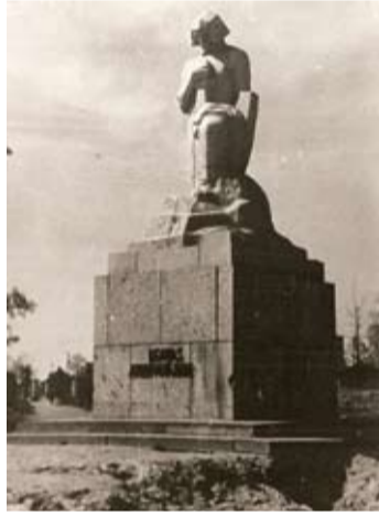
Kara laikā Zemgales gebitskommisārs fon Medems lika nokalt bruņinieka tēlu no pieminekļa «Jelgavas atbrīvotājiem». Tāds pēc kara piemineklis stāvēja pie stacijas.

Lādiņa čaula? Jā, bet vēl pēckara gados tā tika izmantota pavisam citam, daudz ikdienišķākam mērķim. Proti, lādiņa čaulā ielēja degmaisiņus, bet augšdaļā piestiprināja lupatiņu, kas degot radīja pietiekamu gaismu, lai pie tās pat skolēni varētu mācīties. Tolaik elektrība vēl bija retums.