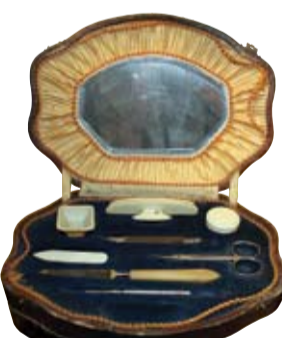
Šādus manikīra piederumus līdz pat kara laikam izmantoja Jelgavas dāmas.