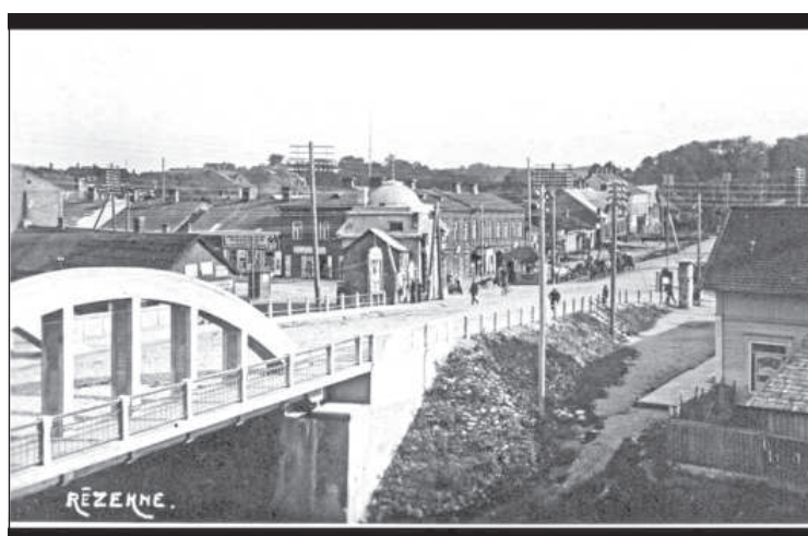
Ничего из того, что видим, больше нет.