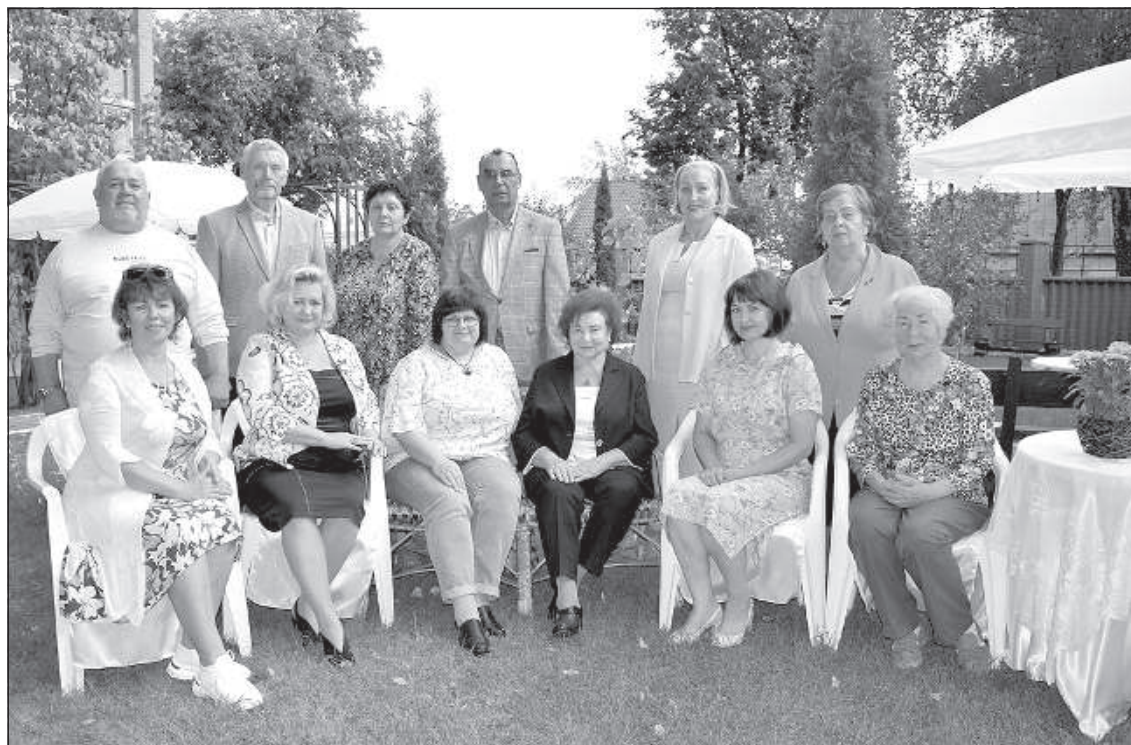
«Все вместе – поэтическая сила!».

В этом году Дни поэзии открыла Латгальская центральная библиотека. За последних несколько лет мир изменился, пандемия внесла свои коррек-