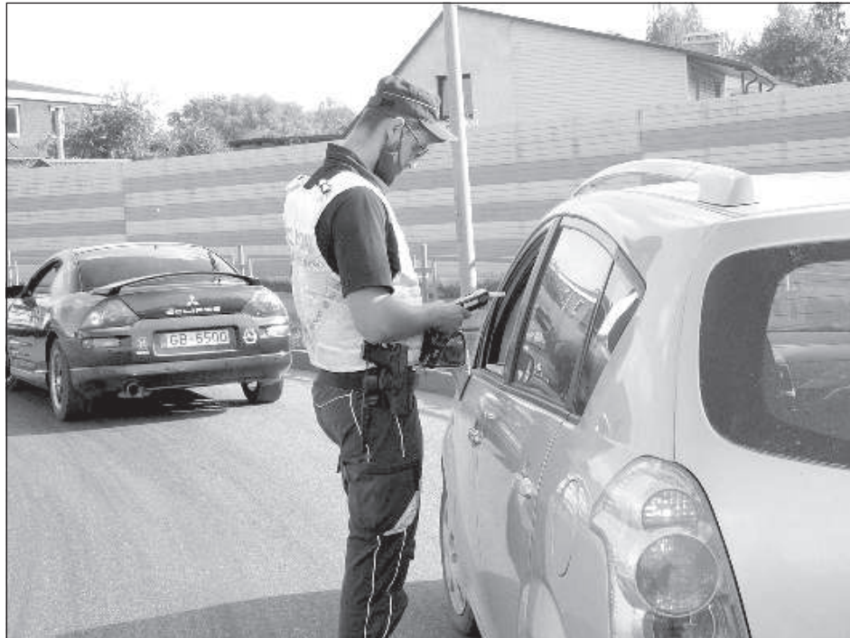
Инспектор Дорожной полиции в Даугавпилсе проверяет водителя на алкоголь.

Чтобы избежать уголовной ответственности, мужчина предложил полицейским взятку в размере 55 евро. И получил вто-