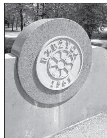
Один из исторически информативных жерновов на нынешнем мосту.

начиналась аллея Атбривошанас. От моста в сторону Даугавпилса шла улица Пулквежа Калпака. В советские годы тоже так было: улица Октября была до моста, а за ним начиналась другая улица – 1 Мая. Только в поздние советские годы вся Большая Николаевская улица 11 царских времен (которую до моста называли Двинским шоссе, а за мостом – Петербургским шоссе) стала одной улицей с одним названием.