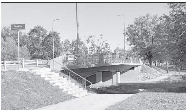
Эти фонарные столбы над мостом мне не очень нравятся.