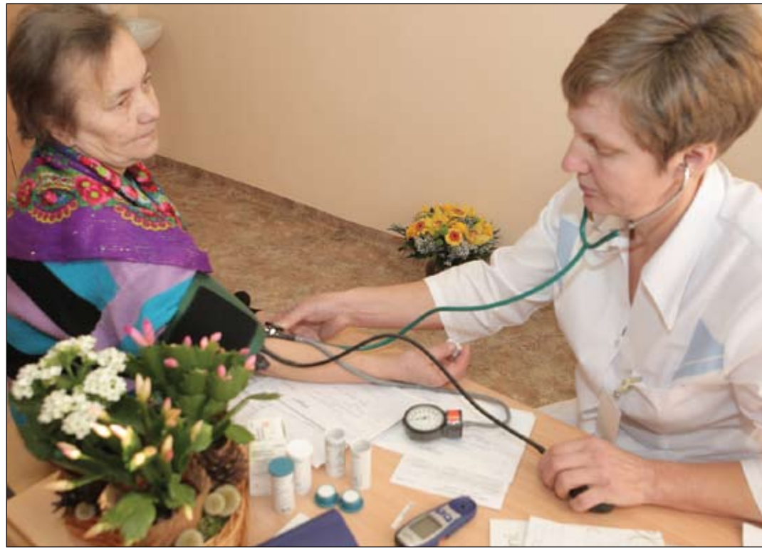
Jau pirmajās dienās pēc Sirds veselības kabineta atvēršanas Zemgales veselības centrā apmeklētāju netrūka – jelgavnieki rindā jau bija pierakstījušies līdz 24. novembrim.

«Diemžēl valstī pašlaik vairāk tiek runāts par slēgšanu, nevis atvēršanu, tādēļ jo īpašs prieks par jaunatvērto Sirds veselības kabinetu. Tas apliecina, ka valstī tomēr tiek domāts arī par profilaksi, turklāt šī