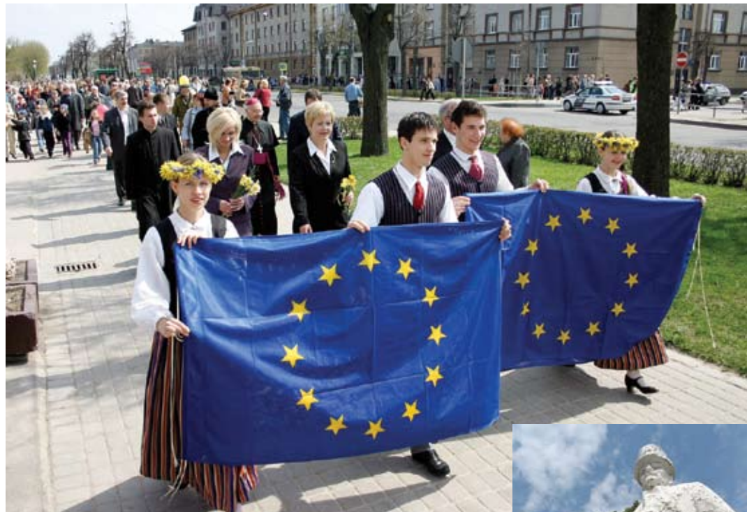
2004. gada 1. maijs – Latvija un Jelgava svin iestāšanos Eiropas Savienībā.

«Iedezies par Latviju» – tas skan kā aicinājums, izgaismojot Latvijas tiltus, vienojoties kopīgā talkā un gaidot mūsu valsts 90. dzimšanas dienu. «Jelgavas Vēstnesis» arī aicina – iedegsimies par savu pilsētu! Nu jau devto nedēļu vēsturiskās fotogrāfijas piedāvājam iepazīt Jelgavu: kā tā augusi, mainījies, atīstījiesies 90 gadu laikā. Šoreiz devītais vēsturiskais posms – no 1998. līdz 2008. gadam.