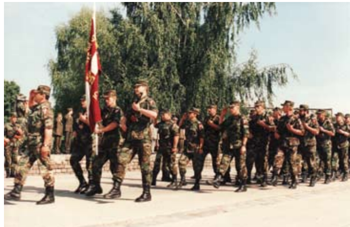
9. septembrī savu dzimšanas dienu svin 52. Jelgavas zemessardzes bataljons. Tam par godu jau deviņdesmito gadu beigās zemessargi pilsētā rīkoja militāru parādi.