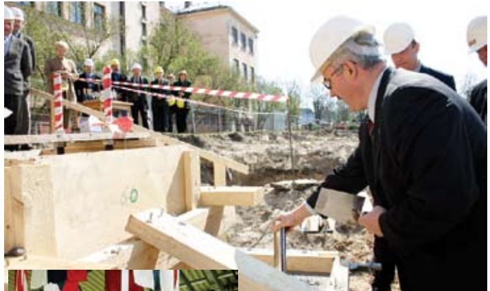
2004. gadā vēl tikai būvlaukums, bet jau pēc gada šajā vietā tiek atklāta Jelgavas Sporta halle.

Diez, cik daudz pilsētu var lepoties ar to, ka vienā gadā savās mājās uzņēmušas divus pasaules čempionātus. Jā, stājhoķeju droši vien atceras daudzi, bet vai atminamies, ka 2006. gada oktobrī Jelgavā notika SKDUN pasaules čempionāts karatē, kur piedalījās sportisti no 25 valstīm? 2005. gadā Jelgavā tiek atklāta vācu koncerna AKG automobiļu dzesēšanas iekārtu rūpnīca. Tās produkciju pārņēma tādi pazīstami zīmoli kā «Porsche», «Ferrari», «Bentley», «Volvo», «DaimlerChrysler» un citi.