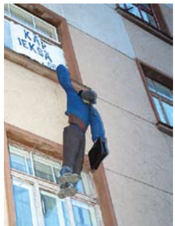
Ko tādu var izspēlēt tikai Jelgavas studenti!

2006. gada maijā ne tikai Rīga izdzīvo hokeja drudzi, bet arī Jelgava – kamēr galvaspilsētā risinās pasaules čempionāts hokejā, Jelgavā cīnās pasaules čempionāta komandas stājhoķejā.