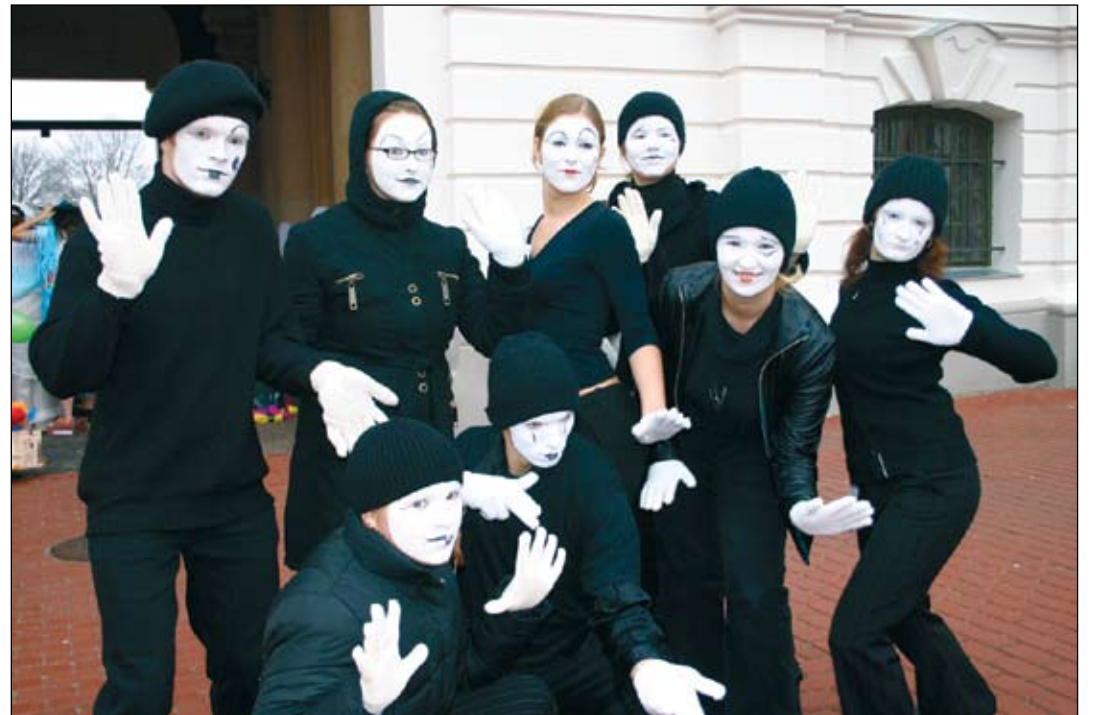
Atraktivitāte ir studentus raksturojošākā iezīme – to viņi gadu no gada pierāda Studentu dienā.

Bet vakarā jaunieši kopā ar studentiem startēs lāpu skrējienā pils pagalmā, piedalīsies pašdarbnieku koncertā un ballē pils auļā, kurā par ciemiņu un pašmāju studentu atpūtu gādās grupa «Labvēlīgais tips».