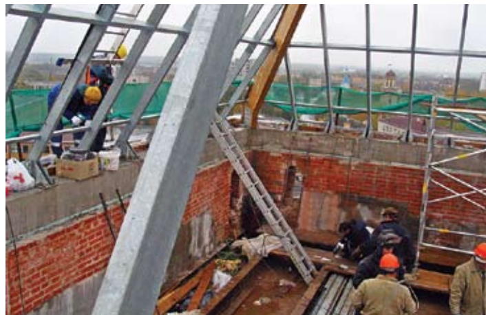
Svētās Trīsvienības baznīcas tornis tiek pie jumta.