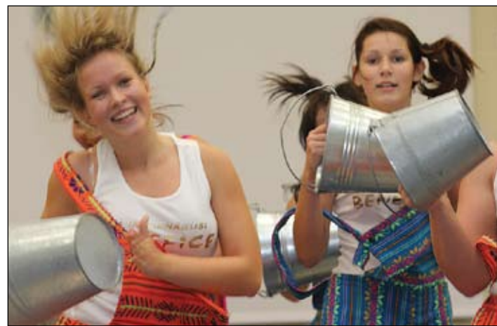
Deju studija «Benefice» uz Latvijas Nacionālās operas skatuves izdejos jau līdz šim skatītāju augsti novērtēto Spaiņu deju.

Koncertā piedalīsies Izglītības un zinātnes ministrijas Valsts jaunatnes iniciatīvu centra (VJIC) organizētā pasākumu cikla «Tu esi Latvija», veltīta Latvijas Republikas proklamēšanas 90. gadadienai,