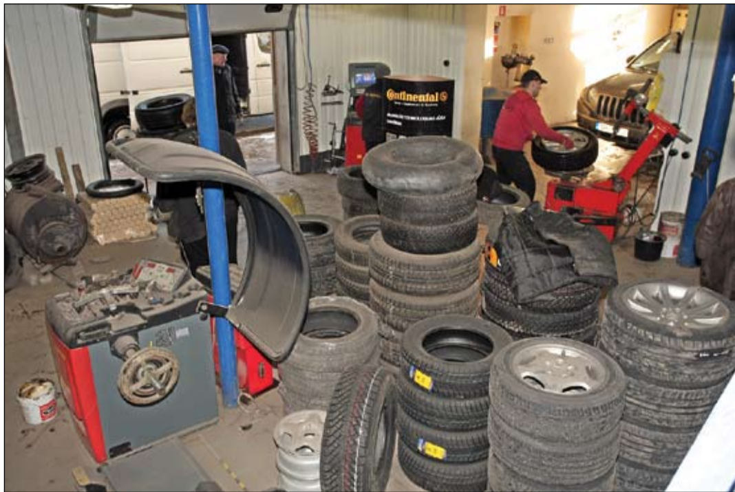
Dažādām automašīnām no lielā pasaules riepu klāsta ik dienu tiek uzliktas tās, kuras vislabāk piemērotas Latvijas laika apstākļiem – cietākas, mikstākas, frikcijas, ar un bez radzēm, galvenais, lai tās būtu izvēlētas katram braucējam individuāli.

Pirmais sniegs jau sagaidīts, un ne tikai iedzīvotāji steidz no skapiem vilkt ārā ziemas zābakus, mētelus un cepures – ziemas «apavus» prasa arī auto. Kaut ziemas sezonas riepas autovadītāji varēja sākt nomainīt jau no 1. oktobra, joprojām šis darbs tiek atlikts uz pēdējo brīdi, un visbiežāk pie ziemas riepu auto tiek tad, kad autovadītājus pārsteidzis pirmais sniegs. Šoreiz «Jelgavas Vēstnesis» pavadīja dienu riepu centrā «AB Montāža», vērojot, kāda rosība tur valda, uzsniegot pirmajam sniegam.