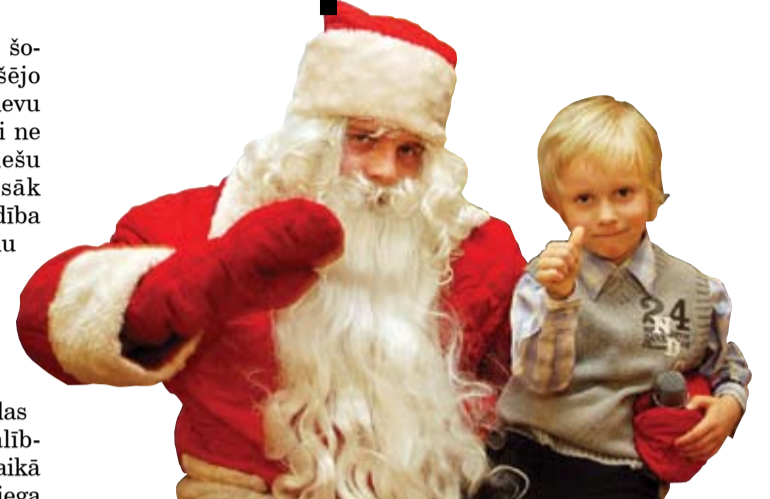
Mazākos pilsētniekus, kuri uzaicināti uz «Sniega karalieni», Ziemassvētku vecītis iepriecinās tūlīt pēc izrādes.