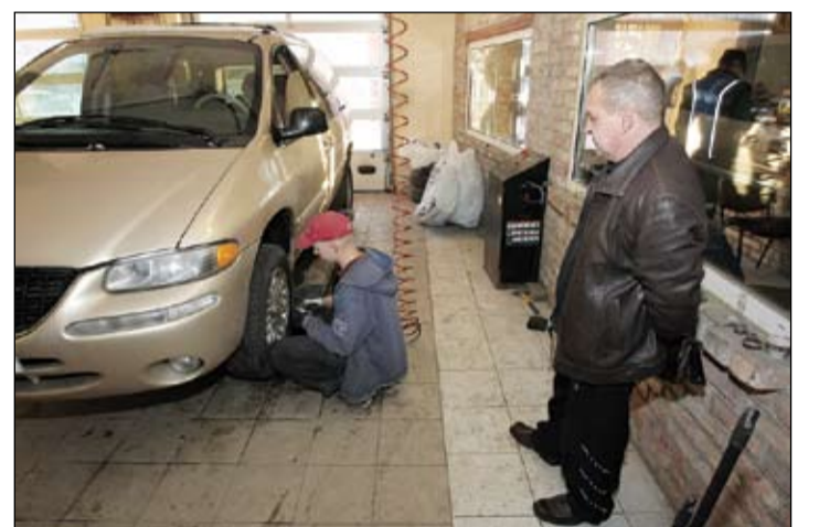
Meistaru darbu var novērtēt arī klients.

Brīdi, kad pametam riepu centru, rindā vēl stāv vairākas automašīnas.