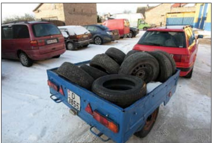
Jāņonkulis servisā bija ieradies ar riepu pilnu piekabi un automašīnas bagāžnieku. Paša auto no šī lielā klāsta jāizvēloties tikai divas, bet no pārējām «jāizceļot» četras labākās sievas auto, kas vēl jāpārmonē uz diskām.