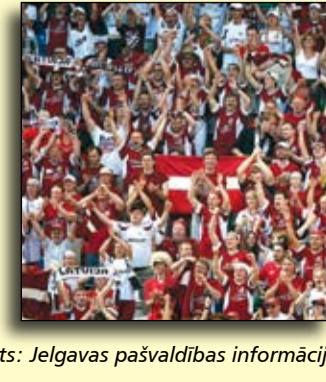
Avots: Jelgavas pašvaldības informācija