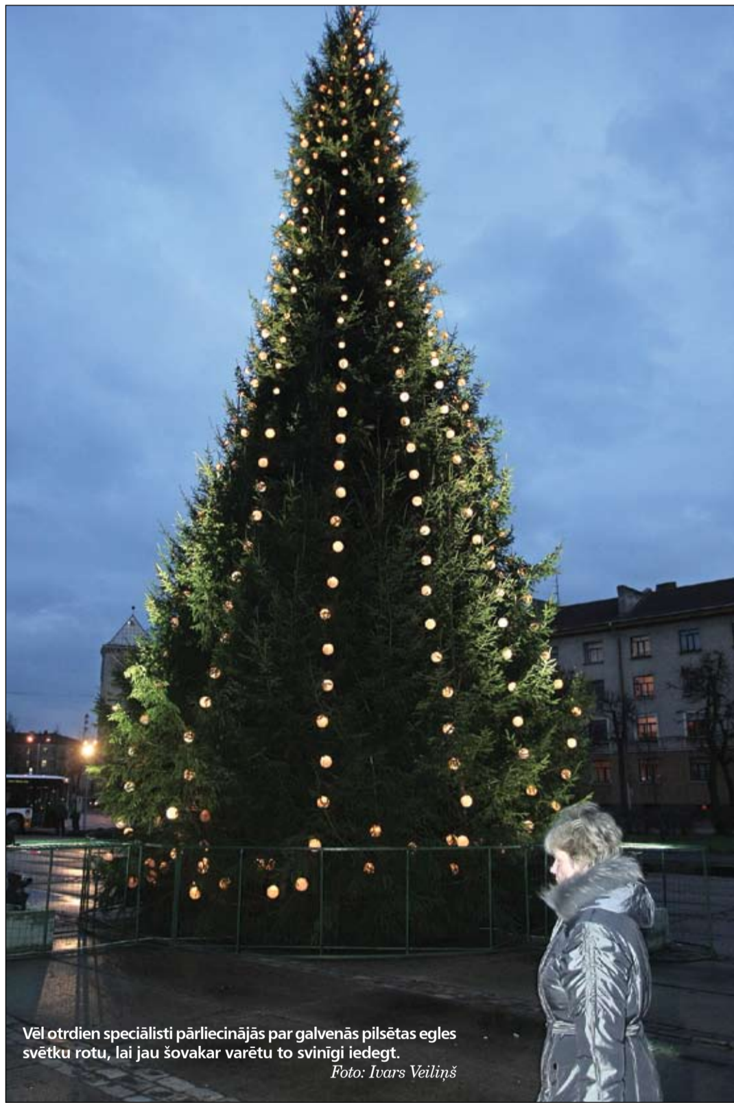
Vēl otrdien speciālisti pārliecinājās par galvenās pilsētas egles svētku rotu, lai jau šovakar varētu to svinīgi iedegt.

Konkursā par Ziemassvētku noformējumu uzvarēja SIA «Studio des fetes Latvija». Kopumā šim mērķim atvēlēti 32 979,82 lati.