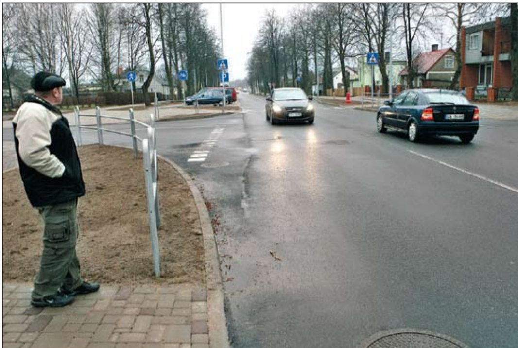
Kaut arī satiksme Brīvības bulvārī ir atjaunota, objekts pēc rekonstrukcijas vēl nav pieņemts – pašlaik, tehnoloģiskās pauzes laikā, speciālisti apzina paveiktā kvalitāti, lai darbu veicējs varētu novērst atklātos defektus.