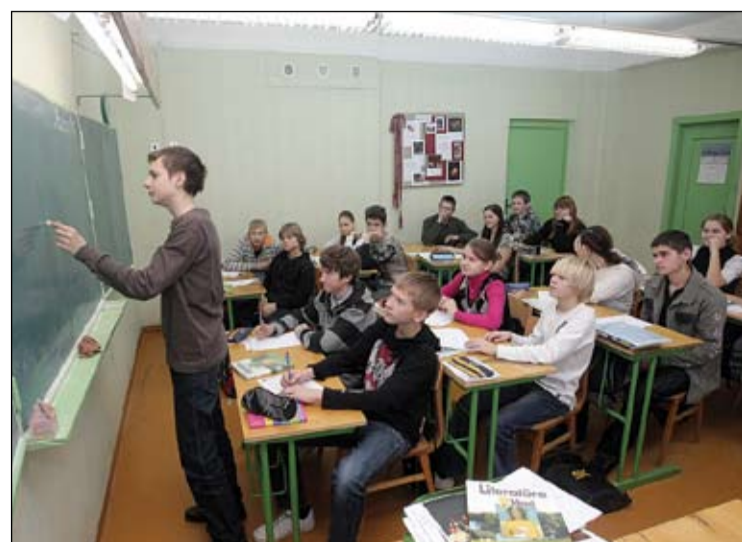
Literatūras stundā skolēni gatavojās rakstīt eseju par vienu no Aleksandra Čaka dzejoļiem – katram bērnam bija jāuzraksta sava atziņa par izlasīto.