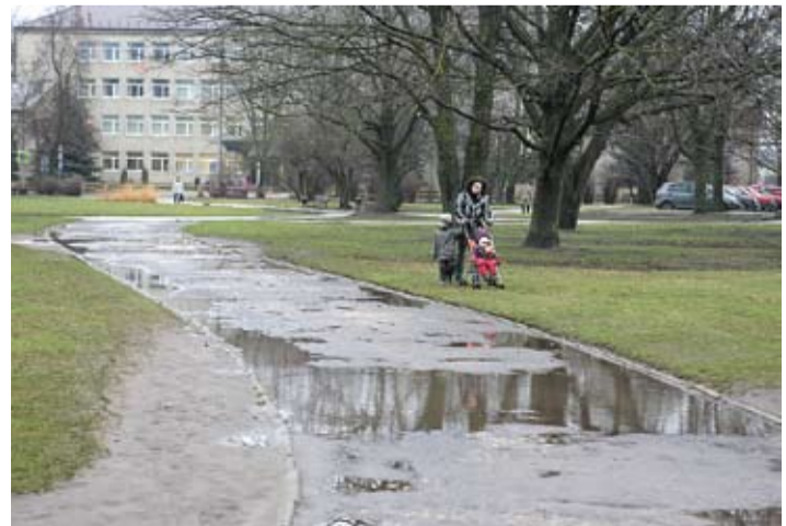
Skvērā aiz kultūras nama ietves, kas sākas iepretim bijušajam «Jelgavas maiznieka» veikalam, remontdarbus paredzēts veikt 2009. gadā.