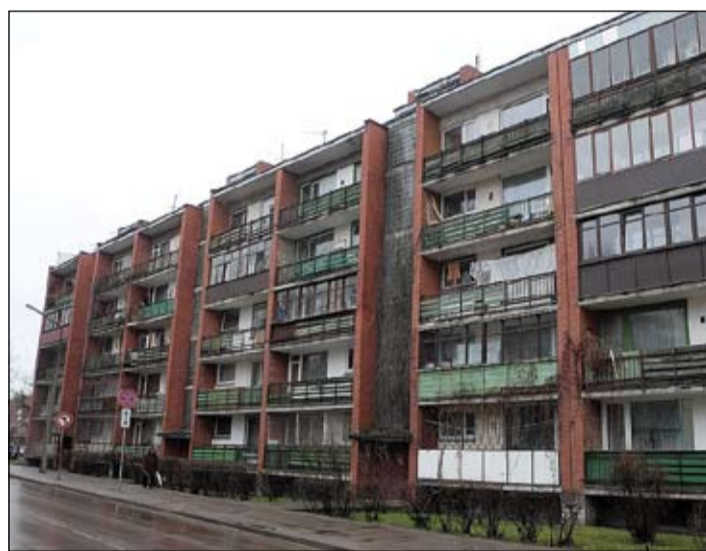
Jelgavas apbūves noteikumi paredz, ka logu rāmju krāsojuma tonim ēkas fasādē jābūt vienādam.

Viņa atgādina, ka Jelgavas apbūves noteikumi paredz, ka logu rāmju krāsojuma tonim ēkas fasādē jābūt vienādam. «Taču logu nomaiņa notikusi ilgstošā periodā, tādēļ grūti