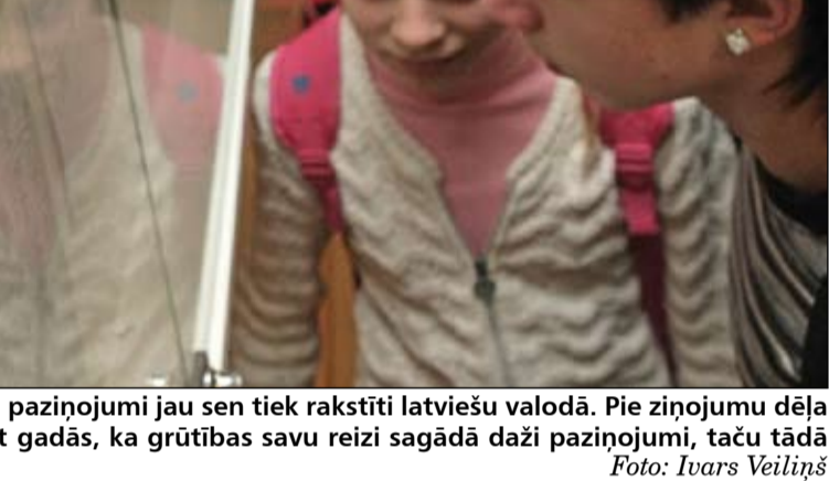
paziņojumi jau sen tiek rakstīti latviešu valodā. Pie ziņojumu dēļa t gadās, ka grūtības savu reizi sagādā daži paziņojumi, taču tādā

latviešu, gan citu tautu tradīcijas. 6. vidusskolas direktors smaidot vien noteic, ka brīžiem esot pat tā, ka kolēģiem jāaizrāda, jo svētku koncertos programma veidota tikai no skaņdarbiem latviešu valodā. «Tad saku: bet mums taču ir arī krievu valoda, izmantojiet to! Tad, piemēram, 1. septembrī jau parādās muzikāli priekšnesumi gan angļu, gan poļu, gan krievu, gan valsts valodā. Un tas šādā daudznašā kolektīvā ir tik dabiski un pašsaprotami – tas, ka skolēni apgūst valsts valodu, nenozīmē, ka viņi pazaudē savas saknes. Tikai no katra paša ir atkarīgs, kā spēj godāt un cienīt savu kultūru,» uzskata A.Holsts. Viņš bilst, ka identitāti cilvēkam zaudēt ir praktiski neiespējami. «Mēs, latvieši, no vēstures zinām – latvietis, kurš