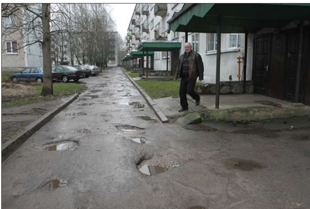
Šogad jau sāka koplietošanas ielu sakārtošana, aizlāpot gadiem ilgi veidojušās lielās bedres, un tas turpināsies arī nākamgad, kad kārtā varētu pienākt arī Pērnavas ielas 18. nama iebraucamajam ceļam.