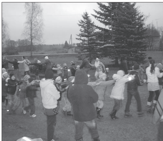
Eglītes iedegšana Plāņos