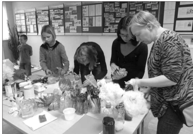
Darbs nometnē “Štābiņš”