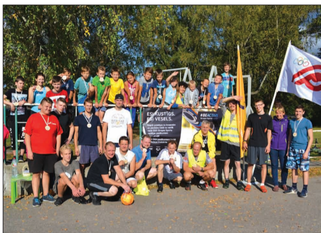
Futbola dienas dalībnieki