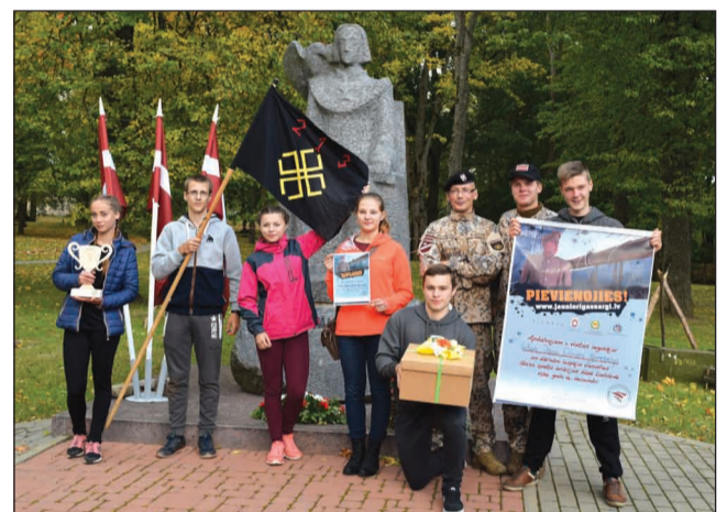
Spēles "Jaunie Rīgas sargi" uzvarētāji