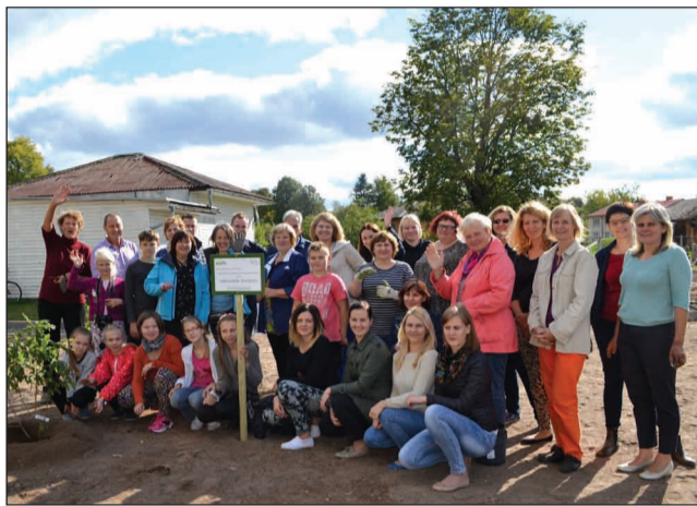
Projekta "Iekrāšosim Strenčus!" dalībnieki