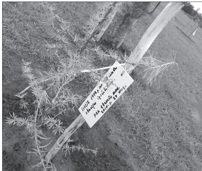
Koks, kas tika iestādīts no Strenču stacijas 1949. gadā aizvestajiem

Savu artavu Likteņdārza izveidē jau no dārza tapšanas pirmsākumiem ir veltījuši Latvijas Politiski represēto apvienības Strenču nodaļas biedri. Šobrīd, kad jau veidojas Likteņdārza aprīse, viņi atceras pašu pirmo talku, kad nācās brīst pa dubļiem, lasot akmeņus. Šobrīd Likteņdārzā ir izveidoti celiņi un centrālā eja Ābeļu aleja, kas ved uz topošo Amfiteātri Daugavas krastā. Likteņdārzā jau ir iestādīti 250 koki. Kopš Kokneses fonda dibināšanas dienas, kas ir Likteņdārza idejas autors, Likteņdārza veidošanā ir iesaistījušies vairāk nekā 10 000 cilvēku. Šogad, augustā, Latvijas televīzijas rīkotajā ziedošanu akcijā "Top Latvijas Likteņdārzs!" tika saziesti 35 tūkstoši 164 lati.