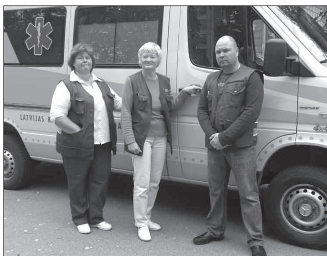
Neatliekamās palīdzības brigāde