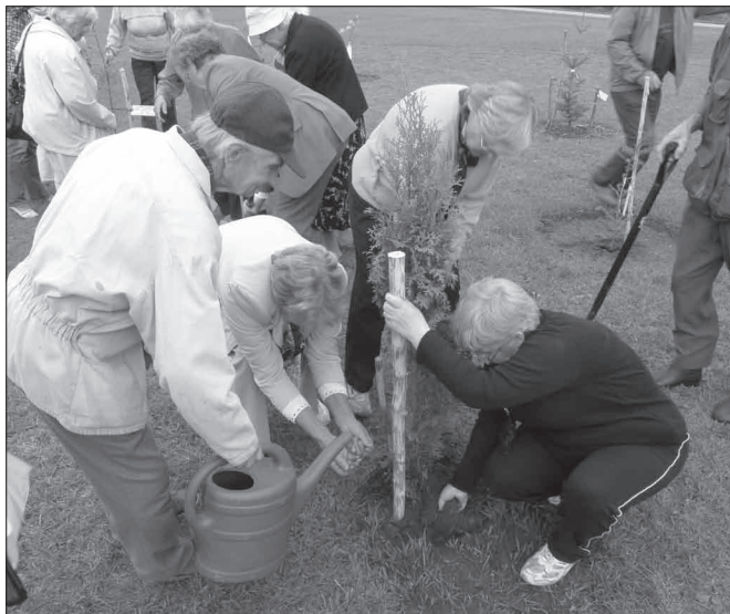
Koku stādīšana Likteņdārzā