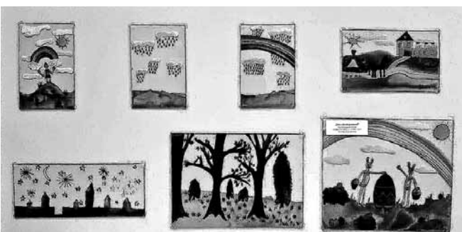
Dārtas gleznojumi uz stikla.