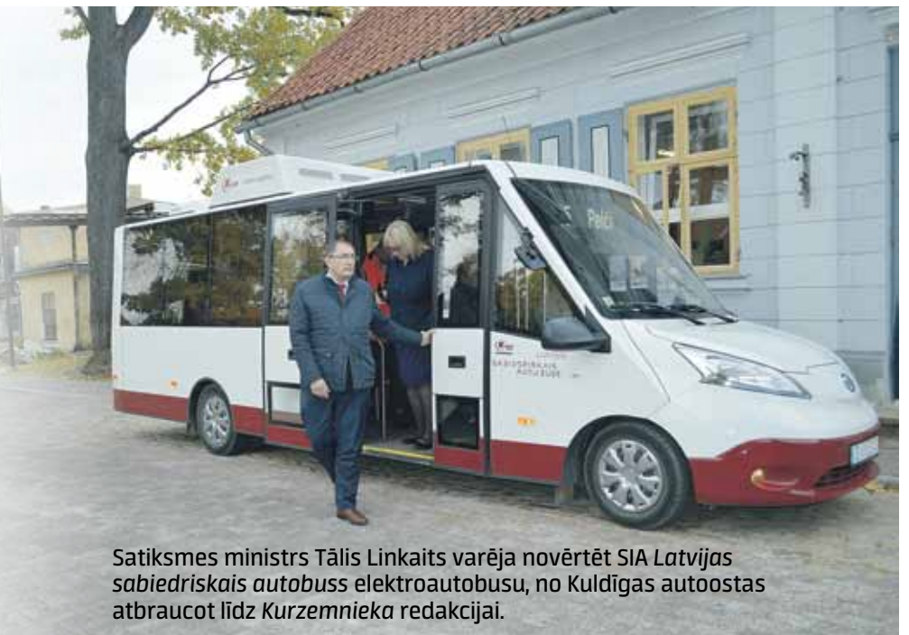
Satiksmes ministrs Tālis Linkaits varēja novērtēt SIA Latvijas sabiedriskais autobuss elektroautobusu, no Kuldīgas autoostas atbraucot līdz Kurzemnieka redakcijai.

Tā novēlēja satiksmes ministrs Tālis Linkaits, kurš trešdien Kuldīgas autoostā aplūkoja SIA Latvijas sabiedriskais autobuss jaunus transporta līdzekļus, kas kopš augusta pasažierus pārvadā Kuldīgas un Saldus maršrutos.