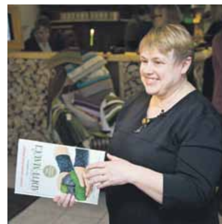
Rokdarbu izstāde Kuldīgas rātsnamā: mauči un linaines.