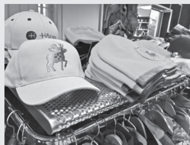
Var iztikt ar košu galvassegu, bet drošāk būs arī ar spilgtu apģērbu.