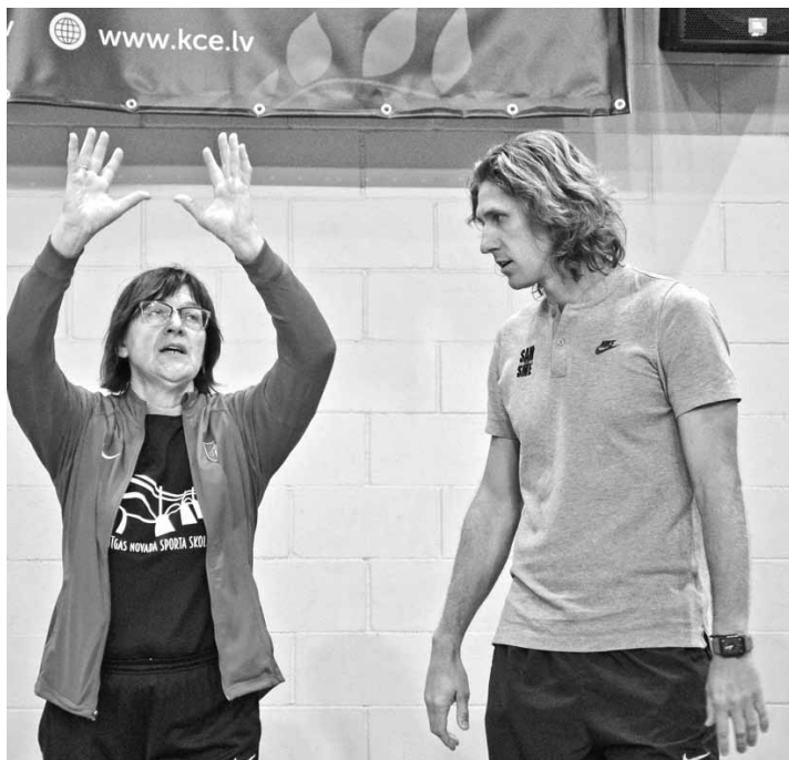
Trenerim arī vajag treneri.