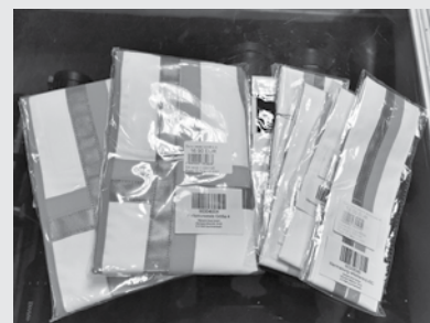
Mednieks jau pa gabalu ieraudzīs un atšķirs suni no meža dzīvnieka, ja tam ap kaklu būs spilgta siksna vai mugurā veste.