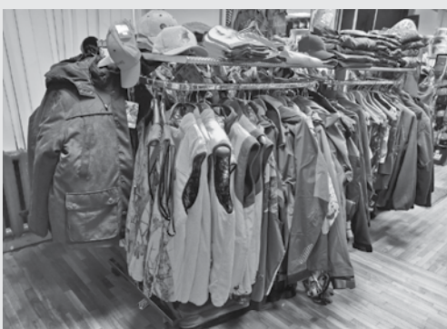
Apģērbs ar spilgtiem elementiem medību laikā ir noteikumos ierakstīta prasība, nevis ieteikums.

„Mednieki sāk apzināties, ka spilgtas krāsas apģērbs palīdz citiem viņus ieraudzīt.”