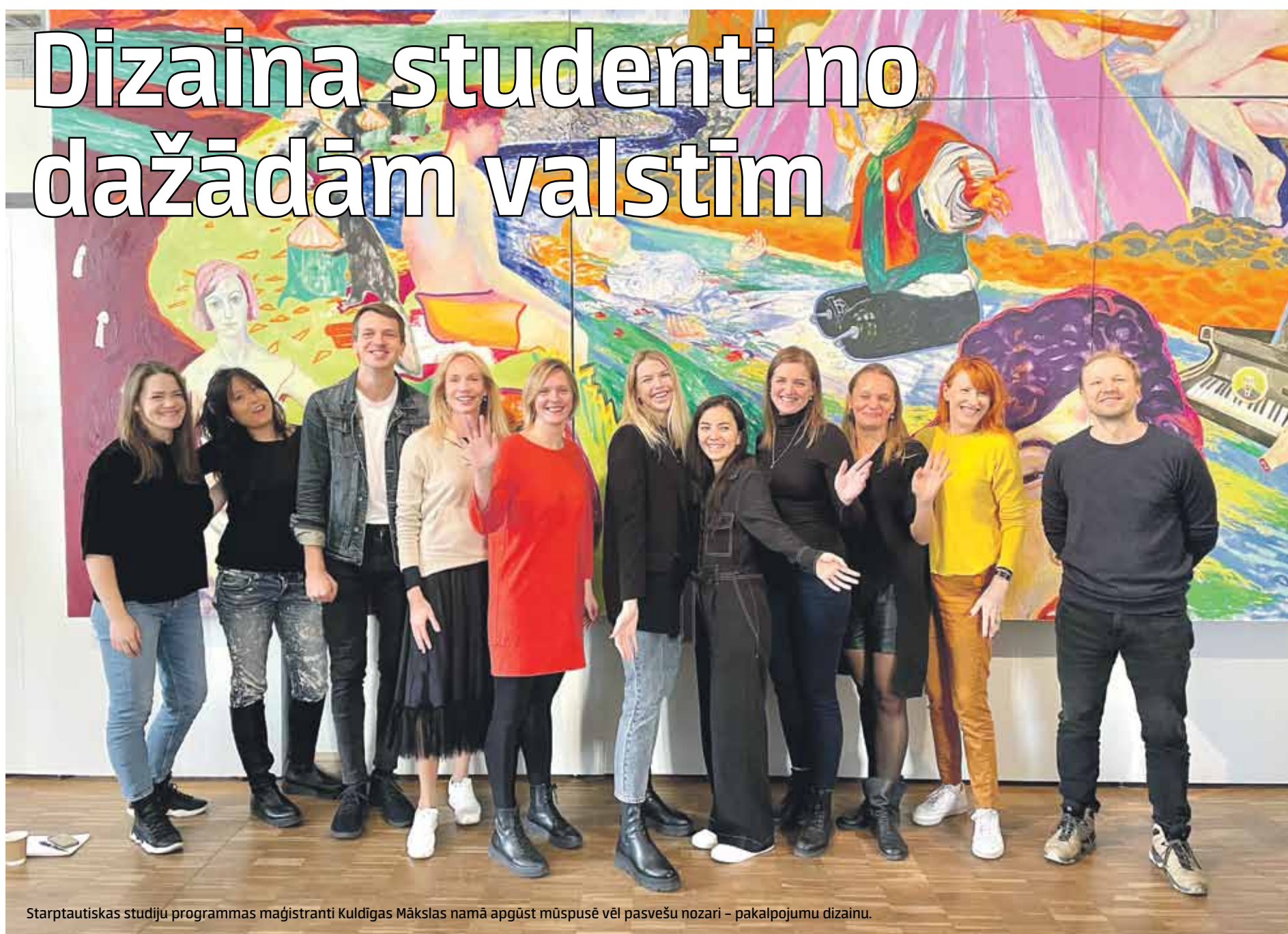
Starptautiskas studiju programmas maģistranti Kuldīgas Mākslas namā apgūst mūspusē vēl pasvešu nozari – pakalpojumu dizainu.

Vairāki studenti no Latvijas un ārzemēm Kuldīgā iegūs maģistra grādu specialitātē Pakalpojumu dizaina stratēģijas un inovācijas . Mūsu sabiedrībai tā ir diezgan jauna terminoloģija. Būtiskākais, ko viņi apgūs, ir biznesa pamati, mācoties saprast pakalpojumu saņēmējus un to, kā pakalpojumus uzlabot. Latvijas Mākslas akadēmijai programma ir kopīga ar Lapzemes Universitāti Somijā. To pabeidzot, studenti iegūs divus diplomus.