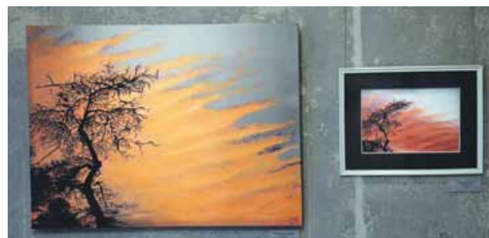
Tēva fotogrāfijā un meitas gleznā Restarts – saulrieta košo krāsu toni vakara debesīs.

Gleznot sāku nesen – pirms gadiem četriem. Ar ģimeni bijām ekskursijā, palikām kādā viesu namā, kurā bija izliktas kanvas (foto uz audekla – red.). Dēls teica, ka viņš istabā tādu gribētu. Atbildēju, ka nav problēmu – uztaisīšu pati, bet, kad sāku strādāt, sapratu, ka tas nav tik vienkārši. Skatījos internetā un pamazām mācījos.”